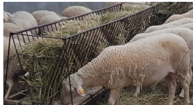
Նկ. 3. Բլանշ ցենտրալ մասիվ ցեղի ոչխարների կերակրումը:

Փորձարարական մեթոդի համաձայն՝ ոչխարների կշռումներն ու չափումները կատարվել են հատուկ չափիչ գործիքներով և «Երևանի կապի միջոցների գիտահետազոտական ինստիտուտ» ՓԲԸ մասնագետների կողմից պատրաստված և ծրագրավորված էլեկտրական կշեռքով (Նկ. 4):