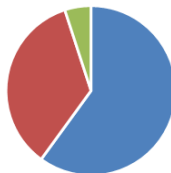
2021թ.ԱՄՆ-ում մրցութային տարբեր ընթացակարգերի արդյունքում կնքված պայմանագրերի քանակը տոկոսային համամասնությամբ