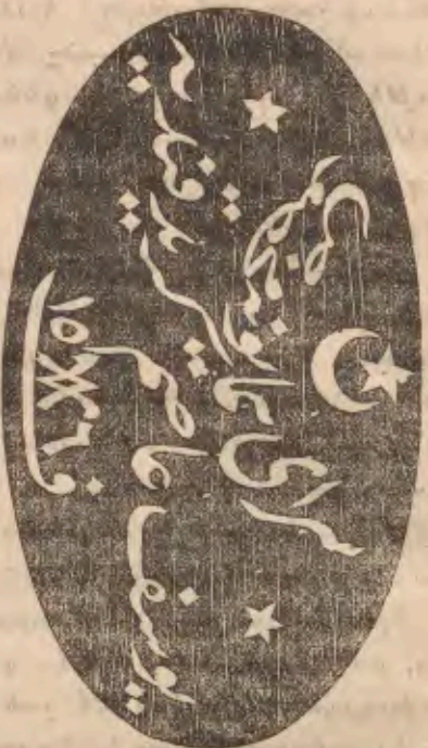
ԳԱՆՏԻԱՆԸՆ ՀԱՆԻՍ ԳՕԳՈՒՂՈՒ ՍԱՊՅԸՆԸ

Հրատարակուեցաւ 1890 Յունվար 15 Ի Թիւրք . Առ Մապիկի մանկաց . — Գրատարտ աղ- ջիլը . — Մարդս ոչ ազահ և ոչ շուայլ պէտք է ըլլայ . — Ազատարար աղջիկ մը . — Վարդենին և բաղնի . — Երեք բաղ- ճանքներ . — Թոշնաճանչ . — Ճամբորդու- թիւն ի հիւսիսային բեւեռ . — Գիտական զրօսանք . — Օգոյ ճնշականութիւն — Օգ- տակար զրօսանք — Համառօտ տեղագրու- թիւն Երուսաղէմի . — Մանուցմունք :