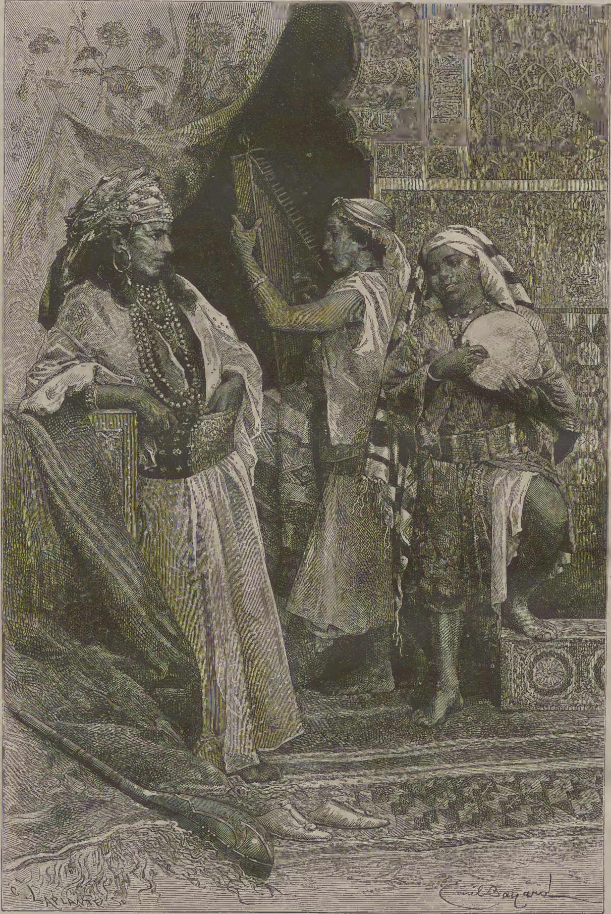
ՄԱՐՈԿԻՑՈ՝—ՄԱՐԻԹԱՆՑԻ ԿԱՆԱՅԻ: (ՄԱՐԻՏԱՆՑԻ ԶԵՆՈՒՆԻ).