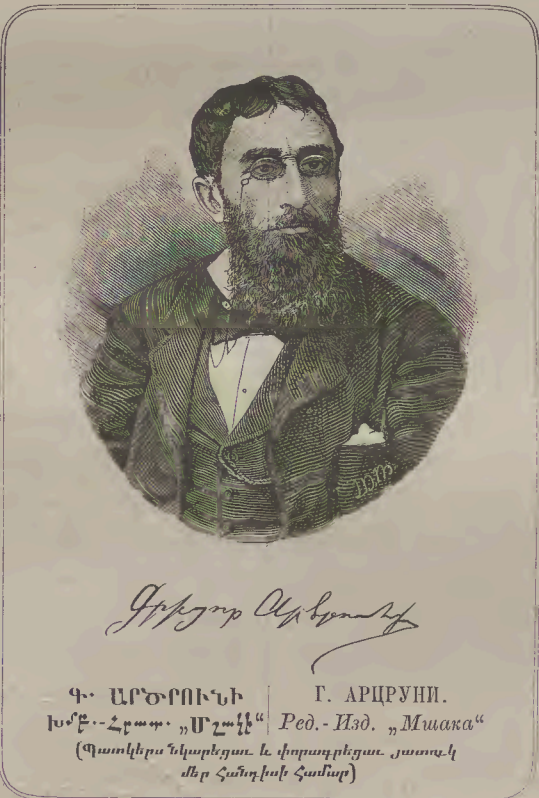
Գ. ԱՐՄԻՆԻ ԽՏԷՆ ՀՐԱՊ. ՄՂԱԿԷՆ (Պատկերանկարեցաւ և փորագրեցաւ յատուկ մեր հանդիսի համար) Г. АРМИНИ. Ред.-Изд. „Мусака“

բնաւ մեկմեկու հետ, և որոնք՝ որպէս կրթութիւն սահմանեալ էին սիրոյ Աւետարանին գալուստէն յետոյ մարտնչել մեկմեկու հետ այնպիսի գաղափարների համար, որոնք դարուց 'ի դարս մնացել են և պիտի մնան յաւիտեան: Այսօր ամենքս զարմանում ենք՝ Հայք և ուրիշ Ուղղափառք, թէ որպիսի այլանդակ պատճառով չենք միացեալ, մինչ դեռ միջնորմ չենք տեսնում մէջ տեղում, իբր որեւիցէ պատճառ, և եղածն ևս փտած և ոչինչ բան է: Մեր Հայ եղբայրքը կարծվում էին մինչև ցայժմ իբրև դաւանողք զ'ի Բնութիւն, սակայն այս հակառակամարտ վէճի մէջ նրբութիւն կայ, որ մինչև ցայժմ ևս ոչ աստուածաբանական հանձարն և ոչ ևս զբաբանութիւնք կարող չեղան բացատրել այս նրբութեան մեկնիչ սահմանները, և բաժանումը՝ թէպէտ և կայ՝ սակայն բոլորովին անհասկանալի է նոցա, որոնք իրերը քննում են պատմական, գործնական և դրական և աւետարանական օգտակար տեսակէտով“: