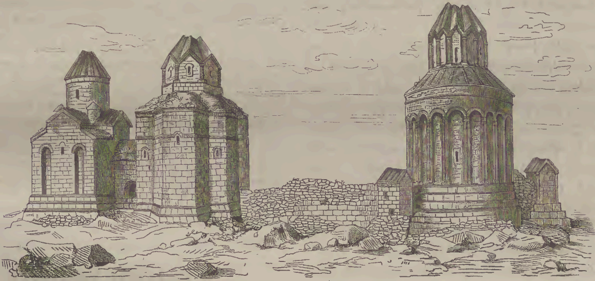
Ս. ԿԱՐԱՊԵՏ: Ս. ԱՍՏՈՒԱԾԱԾԻՆ: