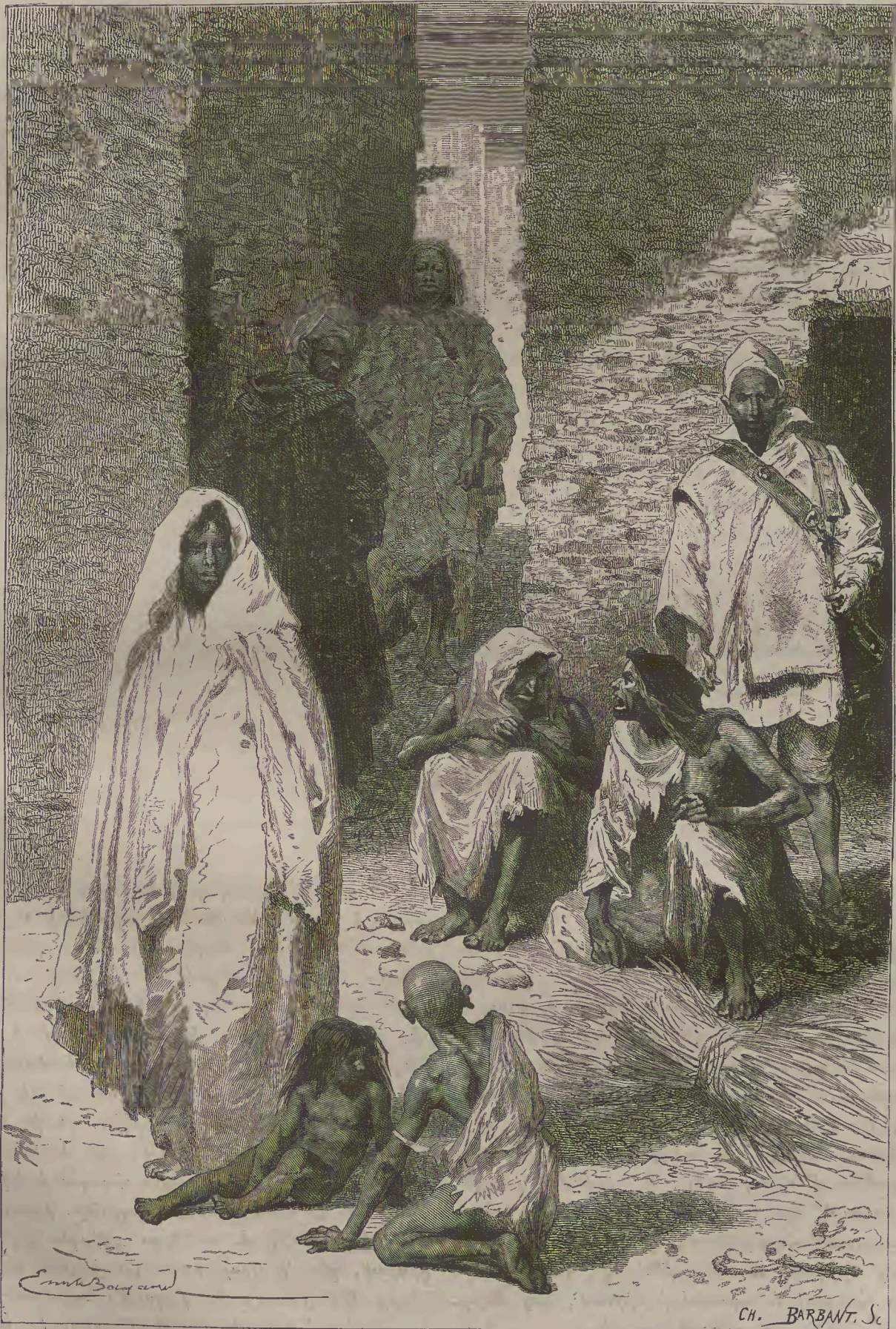
ՄԱՐՈՒՔԻՑ՝—ԲՆԱԿԻՉԻ ԱԼԲԱԶԱՐ ԳԱՂԱՔԻՑ (ЖИТЕЛИ АЛБАЗАРА).