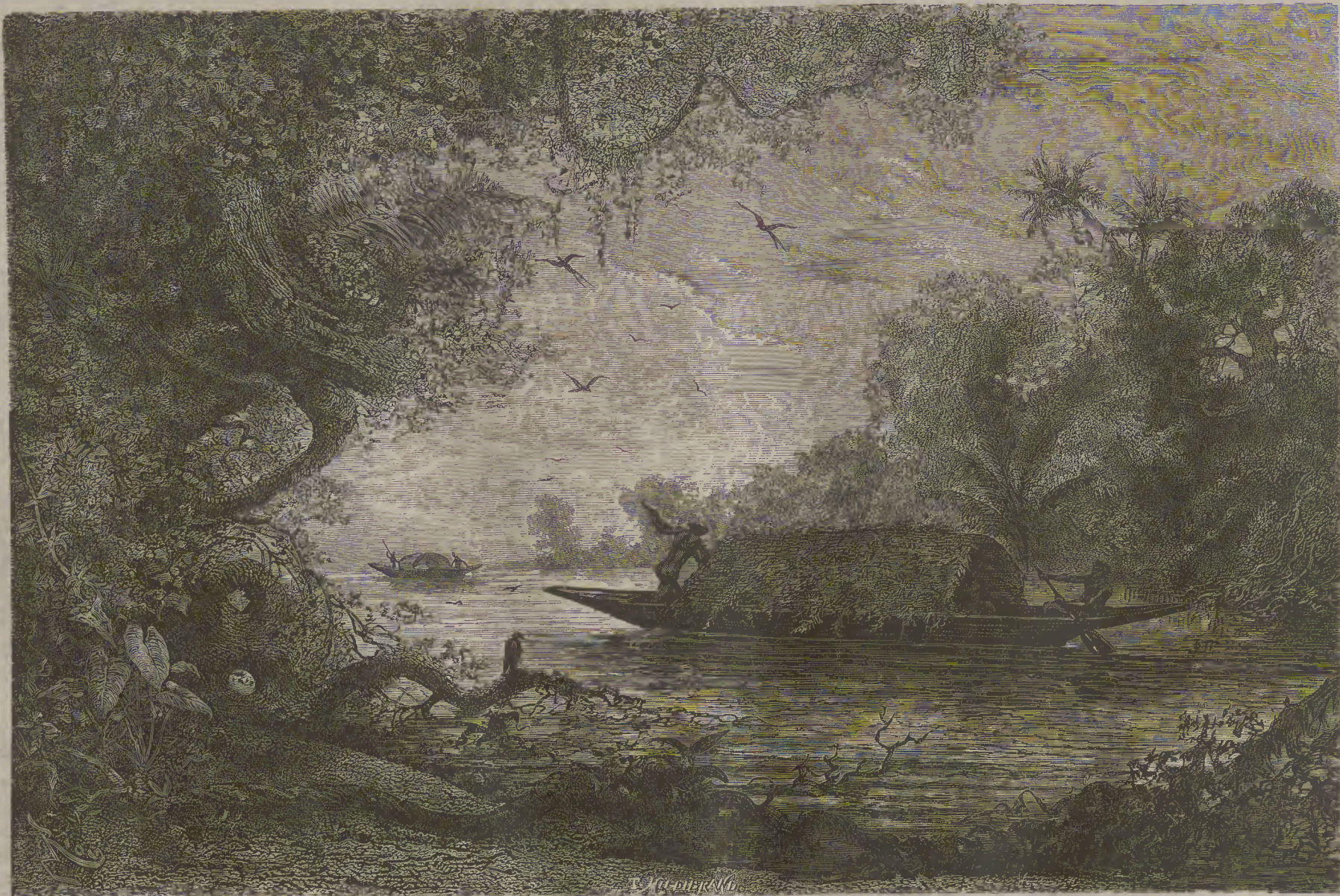
ՀԱՐԱՒԱՅԻՆ ԱՄԵՐԻԿԱ:—ՄԱԳԴԱԼԻՆԻ ՍՐԲՈՒՀՈՅ ԳԵՏԸ: (ՐԻՅԱ ՏՎ. ՄԱԳԴԱԼԻՆԻ).