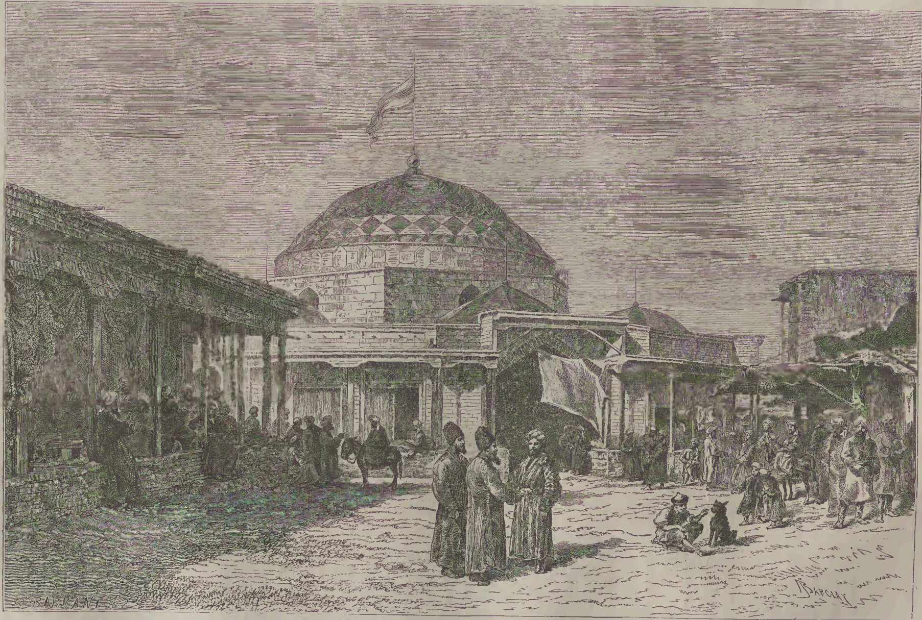
ՀՈՒՇԱՅ Ի ՍԱՄԱՐԿԱՆԴ: БАЗАРЪ ВЪ САМАРКАНДѢ.