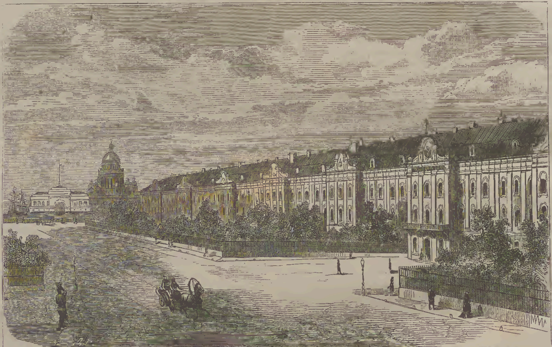
ՊԵՏԵՐԲՈՒՐԳԻ ԿԱՅՍԵՐԱԿԱՆ ՀԱՄԱԼՍԱՐԱՆԻ: (ПЕТЕРБУРГСКИЙ УНИВЕРСИТЕТЪ.)

քաղաքներիս մեր ազգայինը՝ իւրեանց բարձր ուսմամբ և նիւթական կարողութեամբ, կենդանութեան նշոյլ չեն ցոյց տալիս: Արում շատ տուաւ, շատ խնդրեցի: Այս անհերքելի ճշմարտութիւնը, կարծես, մեզ չէ վերաբերվում և մենք, տակաւին, շարունակում ենք զբաղել լոկ անձնական գործերով: Ինձ, գուցէ, օմանք յանդիմանելով ասեն՝ ինչպէս կարելի է մոռանալ Մոսկվայի և Ս. Պետերբուրգի Հայերից նոցա, որոնք իւրեանց գրականական երկասիրութեամբ և ազգասէր գործունէութեամբ, ամենայն իրաւամբ, ազգի բարերար պիտի համարվին: Հարցնողներին ես կ'պատասխանեմ այսպէս՝ երախտագէտ Հայոց ազգի զաւակն, որ յականէ, յանուանէ ճանաչում է յիշեալ բարերարներին, չ'պէտք է ուրանայ նոցա վսեմ արժանաւորութիւնը: բայց, մի քանի անձինք, միայն, չեն կարող Մոսկվայի և Ս. Պետերբուրգի Հայոց հասարակութիւնը կազմել, որպէս և մեկի կամ միւսի լաւ յակութիւնը անհնարին է առգրել բոլոր տեղացի Հայերին: Վերջինների միահամուռ ասենել ցանկացողներն թող զնան Հայոց եկեղեցի եկեղեցոյ գուրս, նոքա շուրին ուրիշ ժողովարան, ուր կարելի լինէր լսել