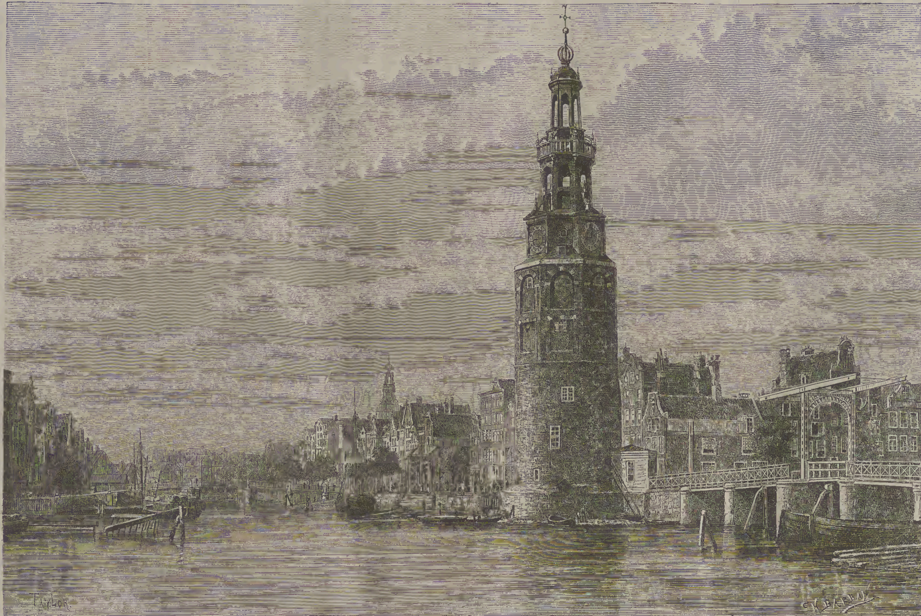
ԱՄՍԵՐԴԱՄ ՔԱՂԱՔ ՀՈՒԼԱՆՆԵՐԻՈՅ --ը կային խանութները -- Հայոց եկեղեցի և Հայոց գրգռանը: AMSTERDAM.