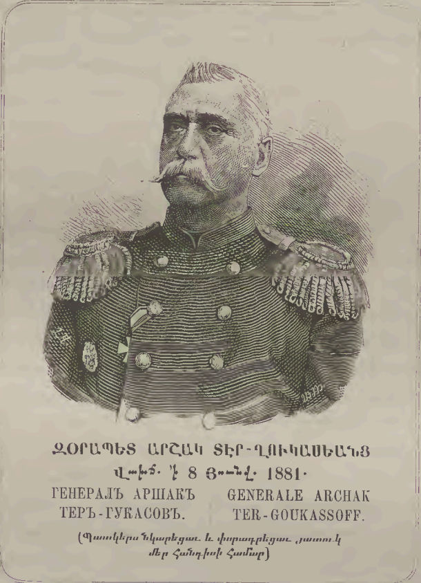
ԶՕՐԱՊԵՏ ԱՐՇԱԿ ՏԵՐ-ՂՈՒԿԱՍԵԱՆՅ Վախճ. ՚ի 8 Յունվ. 1881. ГЕНЕРАЛЪ АРШАКЪ ТЕРЪ-ГУКАСОВЪ. GENERALE ARCHAK TER-GOUKASSOFF. (Պատկերս նկարեցաւ և փորագրեցաւ յատուկ մեր հանդիսի համար)

թեամբ, անշահասէր, միշտ հանդարտ ու անխռով, խստիւ պահանջող պա- շտօնական պարտակա- նութեանց կատարումն, սակայն, առանց ՚ի զուր տեղ յանդիմանելու և բարձրաձայն սպառնալու, հանգուցեալն իւր մաս- նաւոր կեանքում, զբաւիչ զրուցող էր, բարեսրտու- թեամբ լսում ու ժպտում էր, երբ պատմում էին նորան զանազան ծիծա- ղաշարժ դէպքեր և առակ- ներ: Այս բան կարգա- ցած, յարգող Ֆրան- սիայի էնցիկլօպիդիստնե- լին և մանաւանդ Ղ. Օլ- տէրին, որ իւր հետ ման էր ածում արշաւանքների միջոցին, հարուստ պէս- պէս գիտութեանց պա-