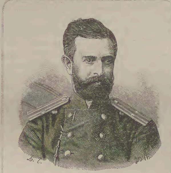
ՀԻՊԱՏՈՍԻ ՌՈՒՍԻՆՅ՝ Ի ՎԱՆ ԿԱՍՏԱՐԱԿԱՆՍԻ: РОССИЙСКИЙ КОНСУЛЬ ВЪ ВАНѢ КАМСАРАКАНѢ. CONSUL RUSSE A VANE KAMSARAKANE. (Պատկերս նկարեցաւ և փորագրեցաւ յատուկ մեր հանդիսի համար)

„Օրնչ ասացից զերկրորդն Ազամայ՝ զտեսան մերոյ Յիսուսի քրիստոսի զգեղեցկութիւնն, որոյ ծնողն էր Աստուածածին, և որդին Աստուած էր և կուսածին, և նիւթ մարմնոյն էր արին կուսին մաքրեալ Հոգւովն աստուածային: Քանզի յորժամ քարոզէր 'ի ժողովրդանոցին Տէրն մեր Յիսուս քրիստոս՝ հայեցեցեալ կնոջն նրբահայեաց տեսութեամբ 'ի գեղ երեսայն և 'ի ձե հասակին քրիստոսի՝ և անհարմանայր: Քանզի հայեցաւ 'ի մազ գլխոյն քրիստոսի՝ նա գանգրահեր էր 'ի ճակատն՝ նա իբրև զլիս արևուէր 'ի յիւնքն՝ նա իբրև զերկնային կամար էր 'ի յաչքն՝ նա իբրև զծով էր 'ի յականջն՝ նա իբրև զբլթակ քնարից ականջաց իբրև զքնար լուսատեսիլ ամպոյ էր 'ի յունկունս՝ նա իբրև զծոյլս ոսկւոյ էր 'ի յայտքն աստուածային երեսացն՝ նա իբրև զհասնտան էր 'ի շրթունսն՝ նա իբրև զլար կարմիր էր 'ի բերանն՝ նա իբրև զակն արևու էր, որ զլոյս բանիցն բղկէ: 'ի յատամունքն՝ նա իբրև զլար մարգարտաց էր 'ի լեզունն՝ նա սուր էր և սուվար, բանքն էր քաղցր և ազդարար, համեղ ու ճարտար 'ի հետ շրթանցն՝ նա իբրև զլալամի քաշուած էր 'ի գոյն ձորուայն՝ նա իբրև զթեյս ոսկւոյ շեկագոյն հարէր 'ի պարանոցն՝ նա իբրև զսին ամպոյ էր 'ի լանջքն՝ նա իբրև զծոյս բոցափայլ արեգական էր 'ի ձգումն ձեռացն որ քարոզէր՝ նա իբրև զցովունս նշուլից լուսոյ էր 'ի յանձին վայելչութիւն՝ նա ցանկալի էր