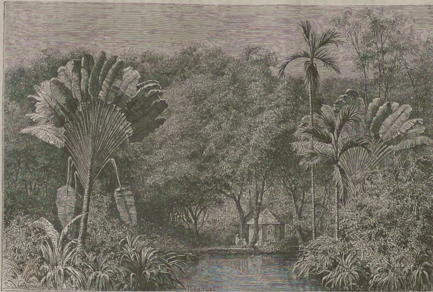
ԲՈՒՍԱԲԱՆԱԿԱՆ ՊԱՐՏԷԶ ՍԷՆ-ՊԻԵՐ ԲԱՂԱԿԻ ՄԱՐՏԻՆԻԿԱՅ ԿԼԶԻՈՅՆ: (Ботанический садъ въ Сенъ-Пьеръ).