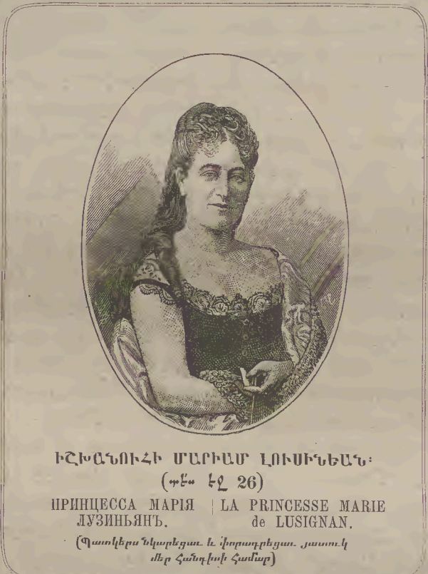
ԻՇԻԱՆՈՒՆԻ ՄԱՐԻԱ ԼՈՒՍԻՆԻԱՆ: (Դեմ էջ 26) ПРИНЦЕССА МАРИЯ ЛУЗИНЬЯНЪ. LA PRINCESSE MARIE de LUSIGNAN. (Պատկերանկարեցաւ և փորագրեցաւ յասուկ մեր հանդիսի համար)

անվստահութեան ենթարկեալ են դարերէ 'ի վեր: Նոքա գիտեն՝ թէ սոցա ամենեցուն սկզբնական պատճառն կեղրոնական վարչութիւնն է, որ չէ կարող կամ չը կամենար սանձել զօշաբաղ պաշտօնատարաց դժնդակ ընթացքն և ոչ իսկ զսպել վերջնական կերպով Վրոզաց, Աւարաց, Չերքեզաց, և այլն, հրոսակներն, որք հանապաղ կը յարձակին մի խաղաղ ժողովուրդեան վերայ և որ ուրիշ բան չը խնդրէր՝ եթէ ոչ ապրել իւր ճակտի քրտինքովն: Գիտեն թուրքիաբնակ Հայերն, որ եթէ ընդփոյթ դարման չը տարուի այս անտանելի կացութեան,