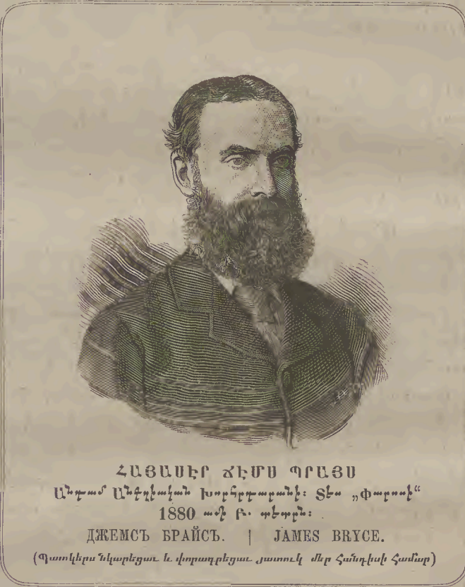
ՀԱՅԱՍՏԻ ԺԵՄՍ ՊՐԱՅՍ Անբաս Անգղիական Խորհրդարանի: Տես «Փարոսի» 1880 թի Բ. պէտրն: ДЖЕМСЬ БРАЙСЬ. | JAMES BRYCE. (Պատկերս նկարեցաւ և փորագրեցաւ յատուկ մեր հանդիսի համար)

«Անգղիական կառավարութիւնն իսկ Հայոց խնդիրը ուսումնասիրած չէր: Պիտէք, որ Անգղիոյ մէջ հասարակաց կարծիք պէտք է գոյանայ, որպէս զի խնդիր մը կարենայ իւր կարևորութիւնն ստանալ, և ես ուրախ եմ յայտնել ձեզ, որ այս հասարակաց կարծիքը գոյացած է արդէն, և Անգղիոյ պաշտօնատարաց զըւելը գանուող անձը, Պէրնսֆիլտի վարչութեան պէս, խոստացող և չը կատարող չէ: Նոյն իսկ Անգղիոյ Օգոստափառ թագուհին, Խորհրդարանի փակման առթիւ ար-