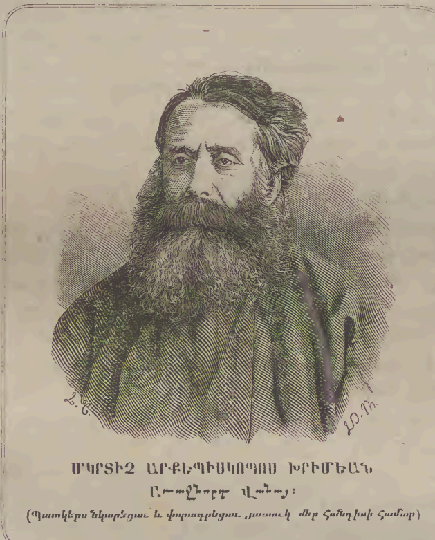
ՄԿՐՏԻՉ ԱՐՔԵՊԻՍԿՈՊՈՍ ԽՐԻՄԵԱՆ Լուսնորդ վանայ: (Պատկերս նկարեցաւ և փորագրեցաւ յատուկ մեր հանդիսի համար)

«Ժամանակն և համբերութիւնն դարձնում են թուրթի տերևներն ապրուշումի», ասում է հնդկական առածն: Նիւտոն տասնևհինգ անգամ փոխեց փոփոխեց իւր Վրոնիկոնը, մինչև գտաւ նորան բաւականացուցիչ: Միքէլ-Անճէլօ անդադար աշխատում էր, շուտ շուտ ուտում էր և մինչև անգամ երբեմն վեր էր կենում զիշերներն՝ աշխատելու համար: Քառասուն ամաց ընթացքում Իւլի Ֆիլօն ամենայն օր անցընում էր իւր գրասեղանի առջև՝ հինգ ժամ առաւօտուն և հինգ ժամ երեկոյին: Մօստէպէօ, խօսելով իւր աշխատութեանց մինի վերայ, ասաց իւր բարեկամներից մինին՝ «Կուք կը կարգաք այս գիրքը քանի մի ժամի մէջ, բայց հաւատացնում եմ ձեզ, թէ աշխատութիւնն, որ նա ինձ նստեց, ծածկեց իմ գլուխս սպիտակ մազերով»: