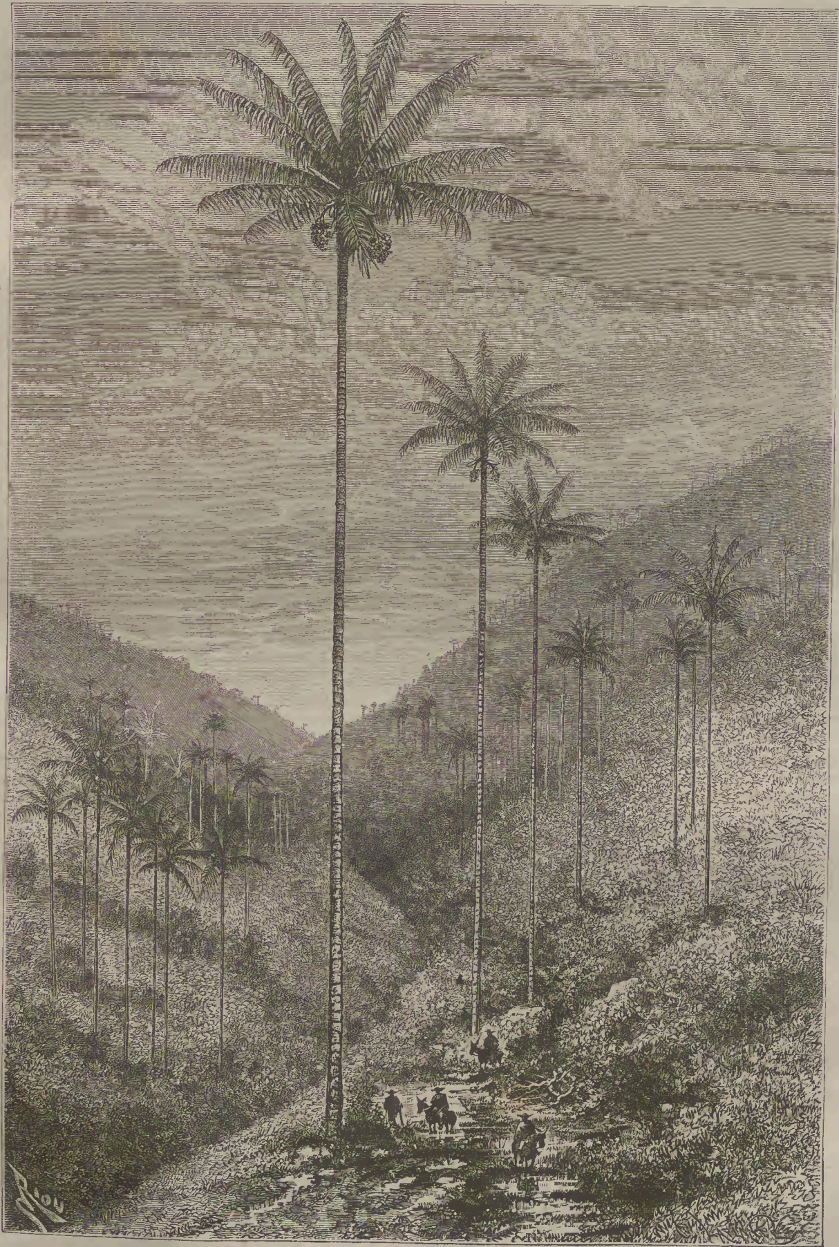
ՄՈՍԿՎԱԿԱՆ ԱՐՄԵՆԻԻ ՀԱՐԱՆԱՅԻՆ ԱՄԵՐԻԿԱՅՈՒՄ: