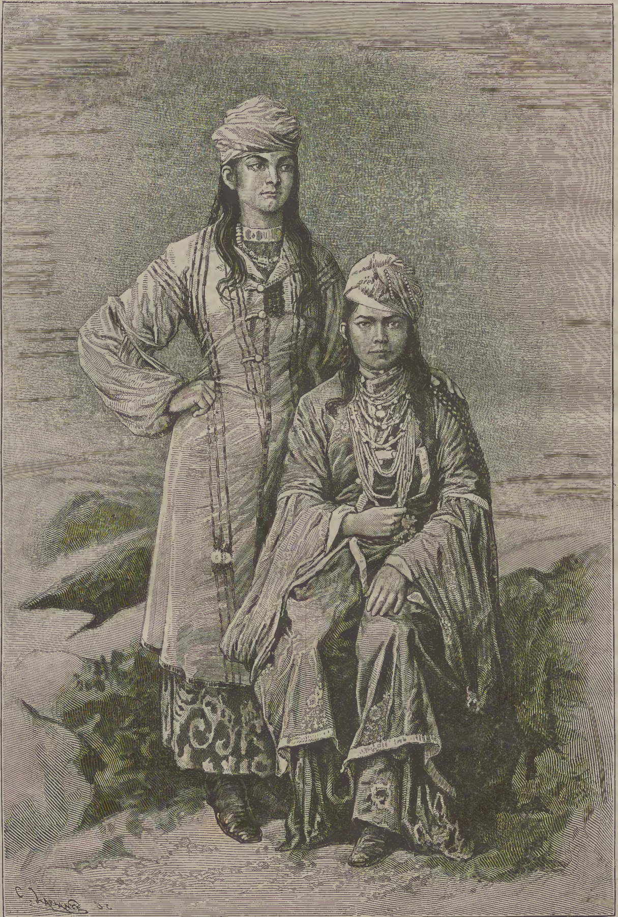
ԹՈՒՃԻԿ ԵՒ ՍԱՐԹ ԿԱՆԱՅԷ: