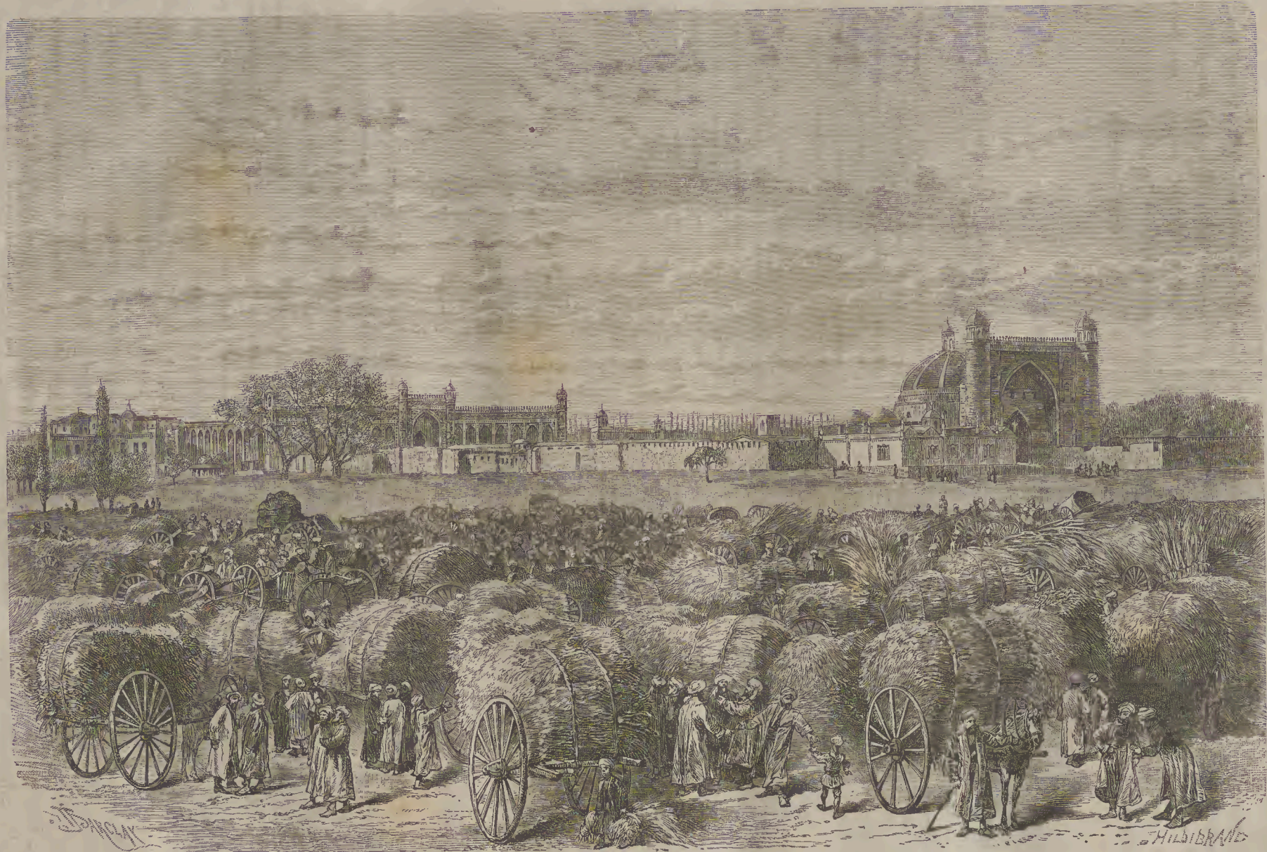
ՎԱՃԱՌԱՆՈՑ Ի ՍԱՄԱՐԻԱՆԻ: