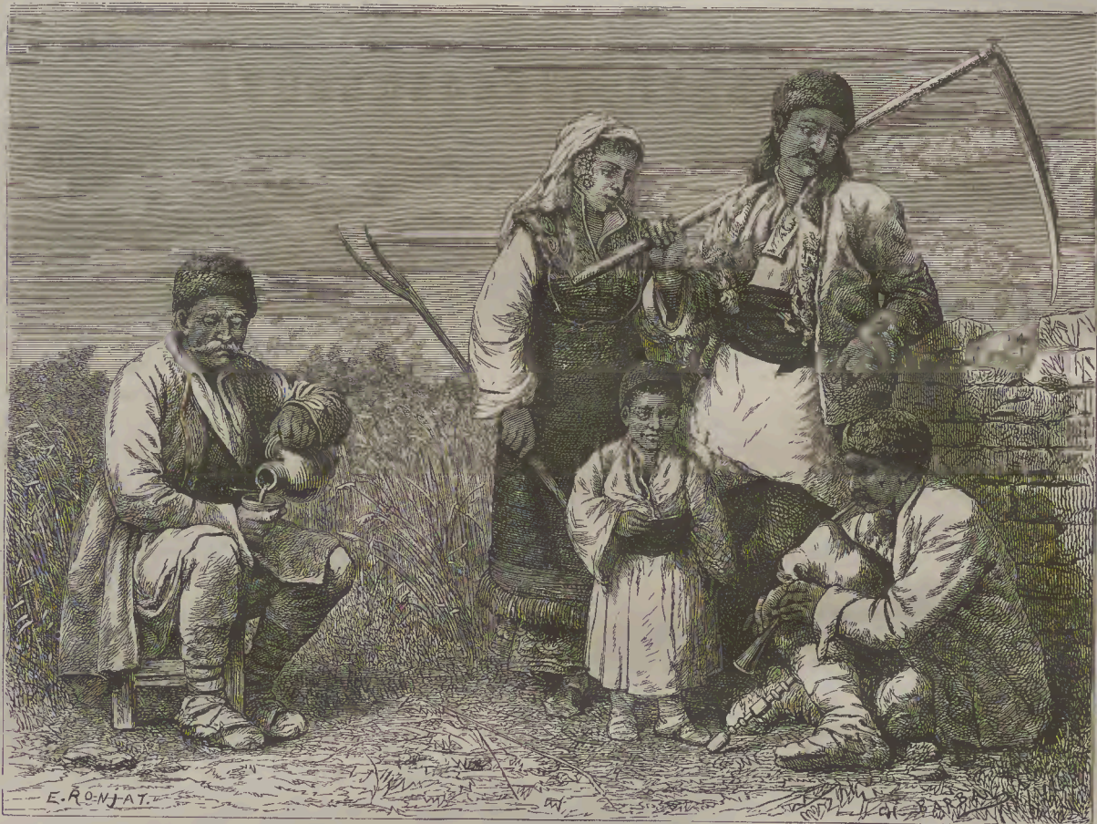
Հ Ո Ղ Ա Գ Ո Ր Ծ Բ Ո Ւ Լ Ղ Ա Ր Բ

յաջողութեանցն թիրսենիքլեայ, խորհեցան զամահու նիւթել Մանուկայ՝ օրինակ զայս: Առաքեցին զարս ոմանս յուզել կեղծօք զազմուկ կագոյ առ դրամբ տանն Ապտի Պայրաքտարայ՝ ուր հիւրութեան էր Մանուկ. իբր զն յերանել նորա արտաքս ընդ այլոց՝ որպէս 'ի զէպ իսկ էր կարծել՝ 'ի շփոթս անդ խռանն սպանցեն և զնա: Արարին արքն որպէս պատուիրեցանն. և ընդ ծագել խռովութեանն ծառայք Ապտի Պայրաքտարայ վազեցին 'ի դուրս՝ տեսանել զինչ իբր իցեն. և անդէն մի