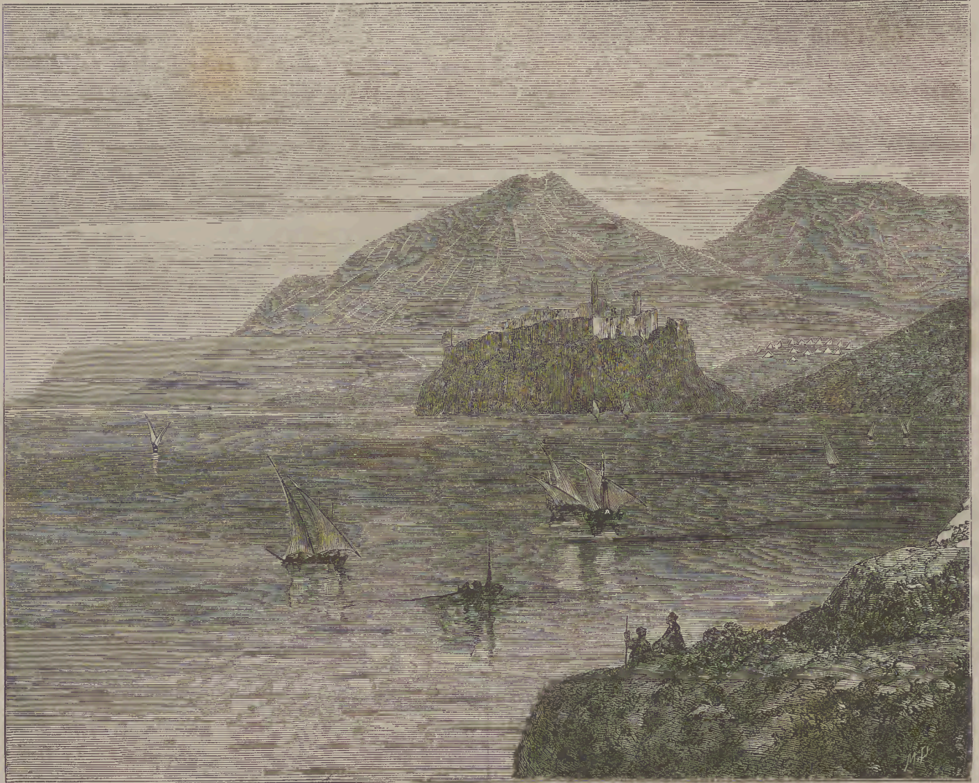
ԳՈՒԼՉԻՆԵՕ ՔԱՂԱՔ ԱԼԲԱՆԻՈՅ

Ի վերջոյ կարող չեմ չը յայանել իմ առ ՚ի սրտէ շնորհակալութիւնս նաև ընդհանուր հայ