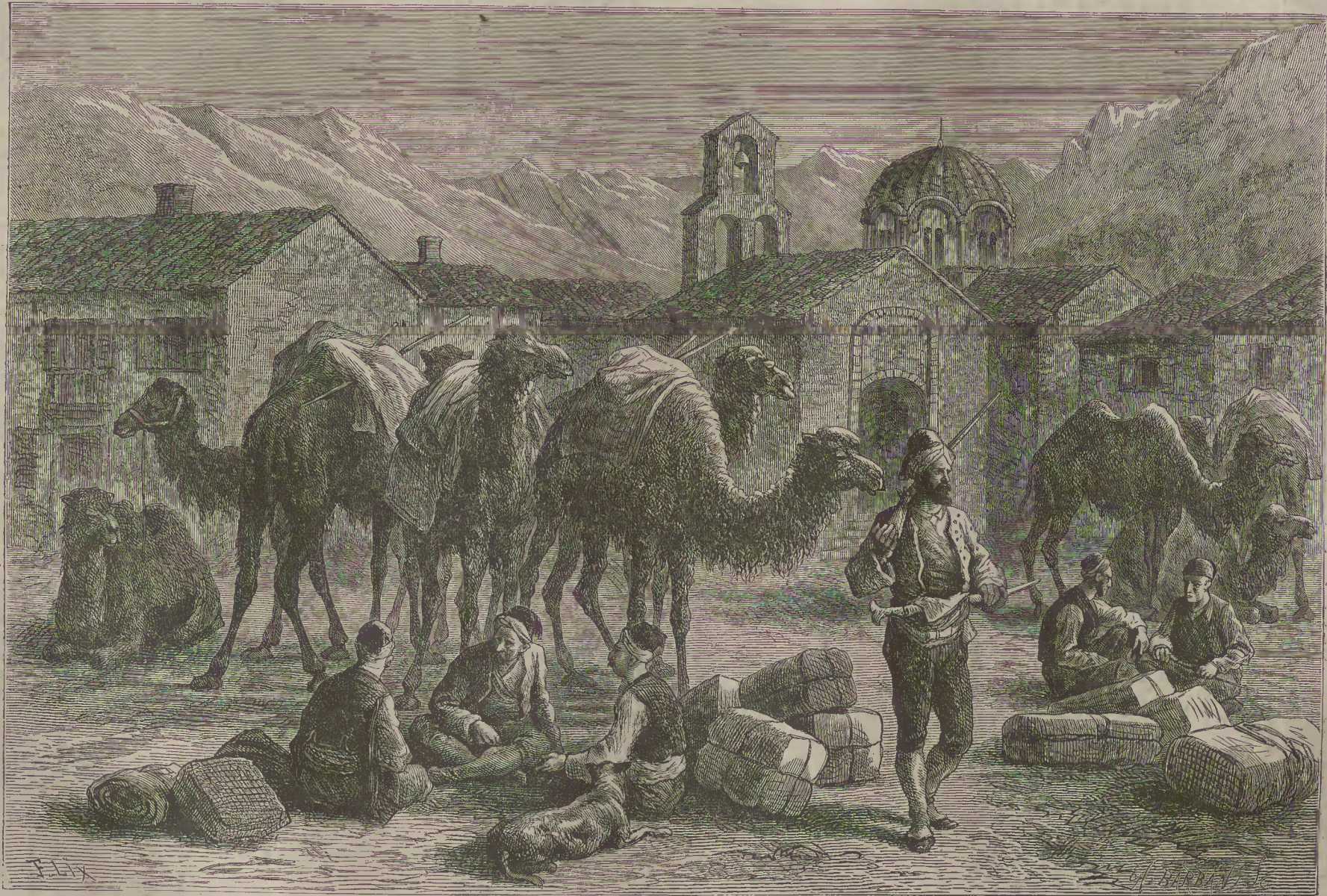
ԹՈՒՐԿԱՅ ԳԵՐՎԱՆՍԵՐԱՅ Ի ԹԵՍԱԼՂՈՆԻԳԷ