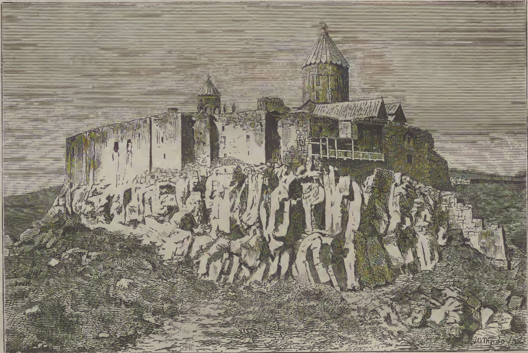
ՏԱԹԵՒԱՅ ՎԱՆՔԻ Ի ՀԱՐԱՒԱՅԻՆ-ԱՐԵՒԵԼԵԱՆ ԿՈՂՄԱՆԷ Ի ՍԻՆԵԱՅ ԳԱՒԱՌԻ: (Պատկերս նկարեցաւ և փորագրեցաւ յատուկ մեր հանդիսի համար)

այսպիսի բան պատահելու լինի, ժողովականաց մեծամասնութիւնը ընկնում է պատճառ տուողի վերայ գոչումով order, order: Նորա, որք գիտնն պարլամէնտական սովորութիւնքն, իւրեանց հակառակորդաց ճառասացութեան ժամանակ առհասարակ ձևանում են իբր թէ քնած են՝ ընդունելով բոլորովին անշնորհ ձևեր. «ես այնքան բեղարեցայ քո ճառից, որ պիտի քնեմ» իբր թէ ասում է նա: Նսխադասին պատասխանում է առհասարակ ազատականը, որ վերկենալով իւր տեղից, սկսում է իւր բանը արդէն աւելի մեղմ և ծանր: Իւրաքանչիւր կիւրակէ, երեկոներին, տէրութիւն-