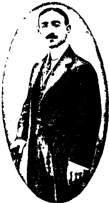
Ալի Ռիզա Պէյ. — Ali Rıza Bey. Commissaire Général Ottoman à l'Exposition Internationale de Turin 1911

Օսմանեան կառավարութիւնը սկզբան մտադիր էր Երկու Յուցահանդէսներուն ալ հասաարագէս մասնակցիլ և այս երկու շինութեանց համար յատկացուցած էր 3000 Օսմ. ոսկւոյ գումար մը: