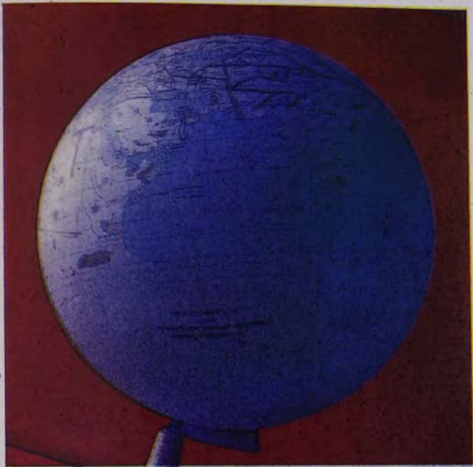
Երկրագունդը ըստ Աճաճիա Ռիբակացու (610—685 թթ.) «Աշխարհացոյցի» վերակազմությունը Ա. Տ. Երեմյանի