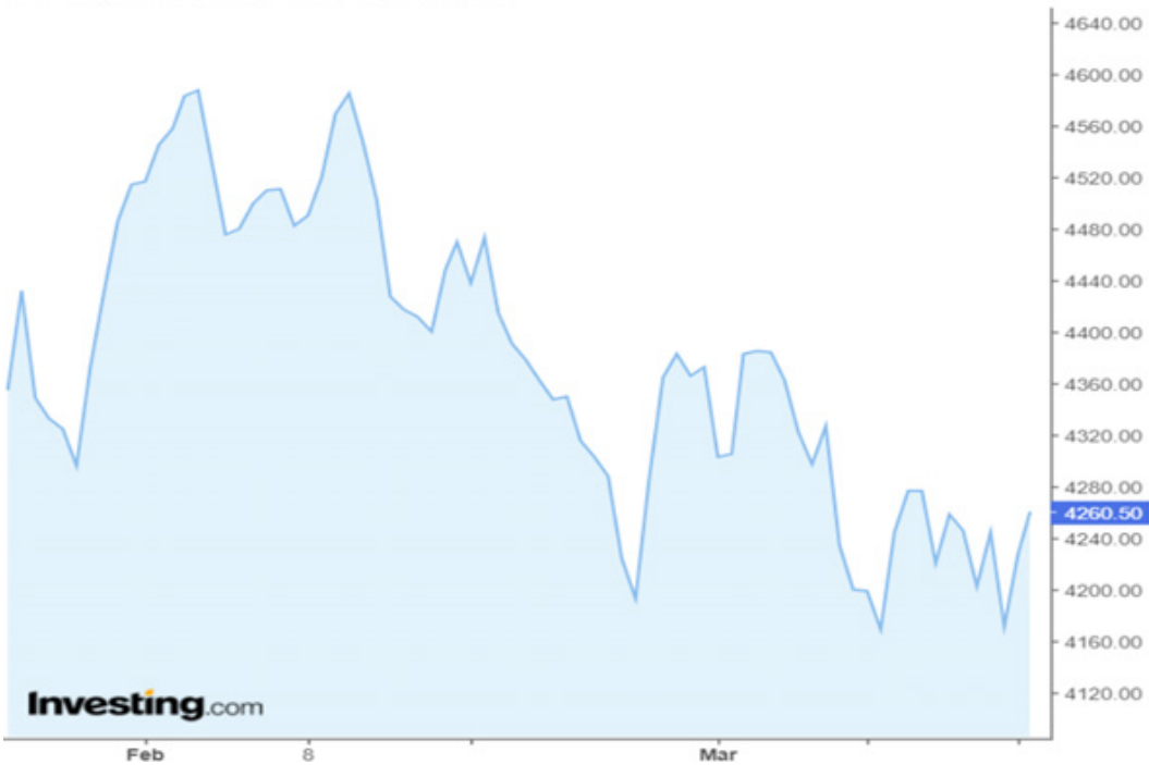
S&P 500, United States, NYSE(CFD):US500, 300