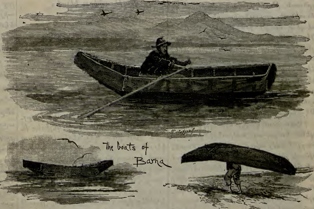
ԳՈՒՐՐԱՆՆ ԵՒՆԻԼԵՆ ԽԱՅԻՖ ԳԱՅԸԳԼԱՐ

լէ գափլանմըզ իտի, լաքին Մարտ ա- լընտա շիտաէթլի պիւր եաղմուր եաղ- տը վէ գար անիտէ էրիտի: Վէ եէր գուրույընճա պիւր կիւն գարղանըն սա- հիպի պաղտա չալըլըր իքէն, պիւրագ էօթէտէ գէվալը, էօրղուն վէ չամու- րա պուլաշմըզ պիւր գարղա կէօրաիւ- քի, եիւրիւյէրէք վէ սըչրայարագ քէն- սիսինէ սօղրու կէլիլօր իտի: Վէ պիւր տէֆա տահա պագալըլընտա, օլ գար- ղա քէնտիլէրին գարղասը օլտըլընը անկլատը. վէ անիտէ գէվալը գուշը մէքթէպտէն գաշմըզ վէ փէշիման օ- լարագ կէրի կէլմիշ պիւր չօճուզ կիպի գօլը իւզէրինէ ալարագ սէվմէյէ վէ