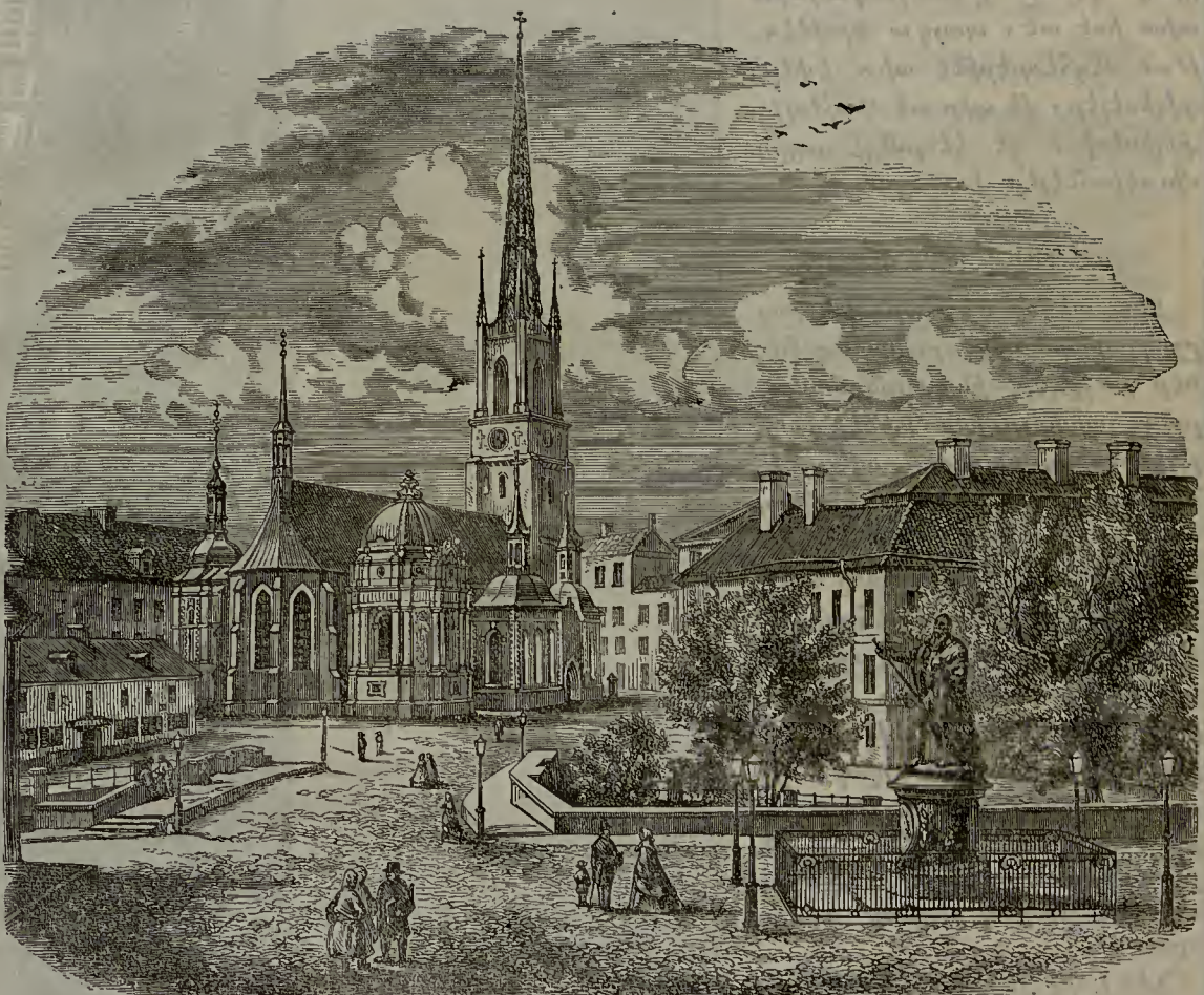
ԻՍԹՕԳՂՈԼՄՍԱ ՊԻՏՏԵՐ ԶՈԼՄ ԲԵԼԻՍԷՍԻ

Շիմալի Էվրոփատա էն կիւղէլ մէվգըրի օլան շէհր իսվէճ մէմլէքէթինին փայլթաթը օլան իսթօգհօլմ շէհրի տիրքի, անըն բէսմինի իքինճի սահիֆէտէ կէօրէճէքսինիղ: Պու շէհր Մալար կէօլիւնին Պալթիգ տէնիղինէ տէօքիւլ տիլիւ մէվգըրտէ պինա օլունմըլ աըր: Էվլէլքի շէհր իւչ ատալար իւղէրինէ պինա օլունմըլ խոյինտէն «Շիմալի վէնտաիկ» թէսմիյէ օլունմըլ աըր: Լաքին պու շէհր վէնտաիկտէն թէմիգ օլուպ, թապի կիւղէլլիյի ճիհէթիլլէ անտէն ալա պիր շէհր տիր: Պու իւչ ատալար շիմոի շէհրին մէրքէզի գըսմընը թէշքիլ էտէրլէր, վէ քէօփրիւլէրլէ պիրի պիրլէրինէ պիրլէշաիքլէրի կիպի շիմալտէն վէ ճէնուպտէն տախի գարաւա պիթիլիլլէր տիր: Պու քէօփրիւլէրին էն կիւղէլլի Նօրպրօ (շիմալի քէօփրիւ) տէնիլէն քէօփրիւ տիր քի, պէօլիւք ատայը Նօրմալմէն