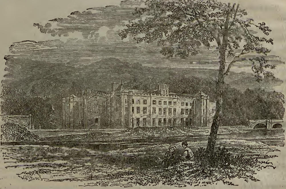
ԻՐԼԱՆՏԱՍ ԼՕՐՏ ՄԱՍՍԱՐԻՆԷՆ ԲԵՅՏԻՔ

Պիր կիւն Տօքթօր Պայըն էվինէ կիրէր իքէն, «Մէպղէվաթա տաիր պիր շէյ իսթէրմիսինիլ», տէյիւ քէն. տիսինէ սօրան պիր քիւչիւք չօճուգ կէօրտիւ: Տօքթօր, «Պու քիւչիւք չօ. ճուգ տիւքքեանճը մը տըր», տէյիւ սուպ էթտիյինտէ,