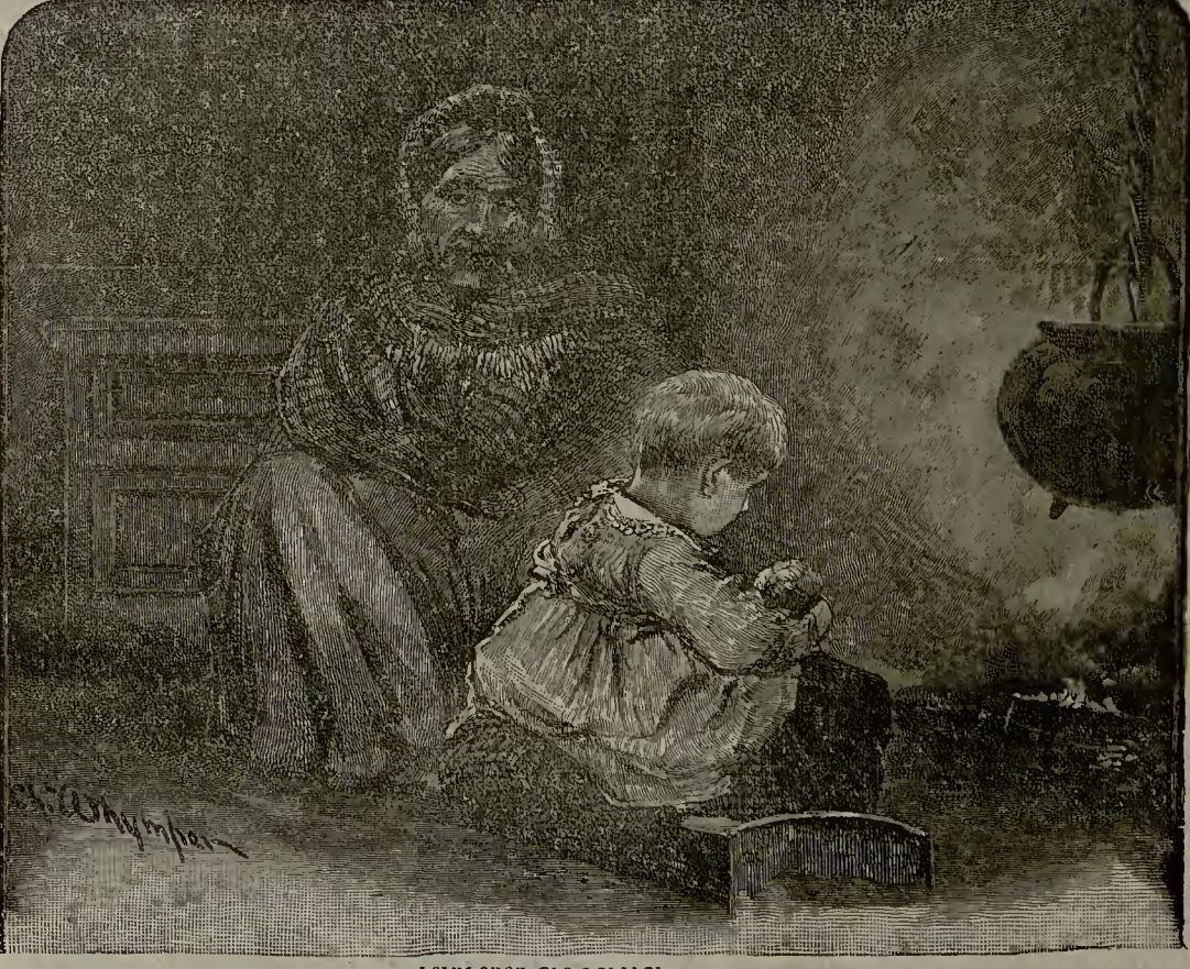
ԻՐԱՆՏԱՍԱ ՊԻՐ ԳՈՒԼԻՊԵ

Վէ օլ սաաթ Տօքթօր վէ գարըսը պու չօճուղը եիւրէքլէրինին իչինէ վէ էվլէրինէ գապուլ էթտիլէր իսէ տէ, պու չօճուղ ասըն էն մէչուր հէքիմ լէրինտէն վէ էն էյի ատէմլէրինտէն պիրի օլմագընը պիլմէյլէր խոի: Գէն- տի մէրհամէթլէրինէ թէպիմ օլուան պու չօճուղըն իսթիյարըղլարընտա քէնտիլէրէ տէյնէք, վէ գըղլարընա հէմ քէնտիլէրէ պիր օղլան էվլատըն- տան ղիյատէ սահիպ օլմագընը կէօր- մէղլէր խոի: Պու ճիւմիլ չէյլէր օլ վա-