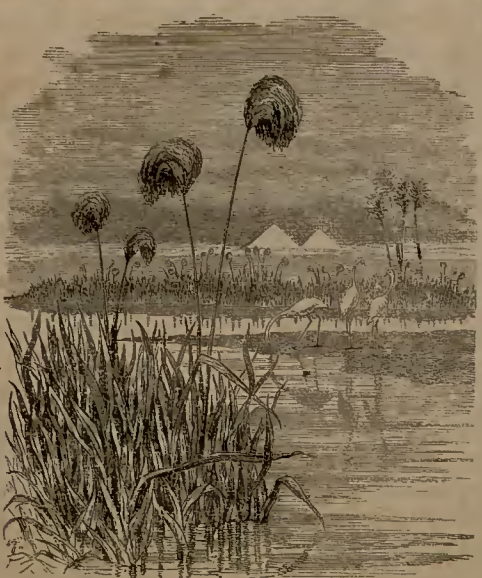
ՓՍՓԻՐԻՒՍ ՆԱՄ ԳՍՄԸՅ

Նիւ Ըրմազըն հաննտա ֆափիրիւս թապիր օլունուր պիր ճինս գամըչ պի- թէր. պունլարըն պաղըսը սէքիզ հա- լսոտ Օն արչըն երևքսէքլիյինտէ օ- լուպ՝ պաշլարընտա տախի թասվիր- տէ կէօսթէրիւմիշ օլտուղու միսիլիւ պիր տէմէթ փիւսկիւ կիպի չիչէքտէն թէփէլիքէրի վար տըր : Պունլարըն իշթարափընտա պէյաղ պիր շէյ վար , էսքի Մըսըրըլար պունտան քեաղըտ հափարըլար խտի :