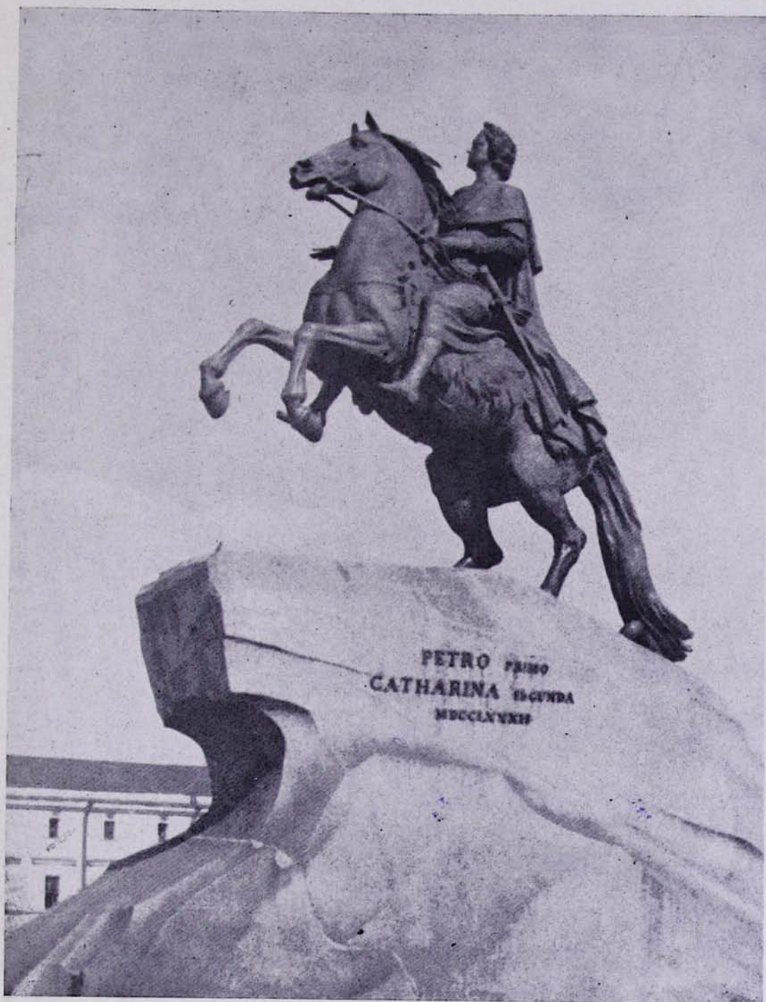
ԼԵՆԻՆԳՐԱԴ. ՊԵՏՐՈՍ Ա-Ի ՀՈՒՅԱՐՁԱՆԸ