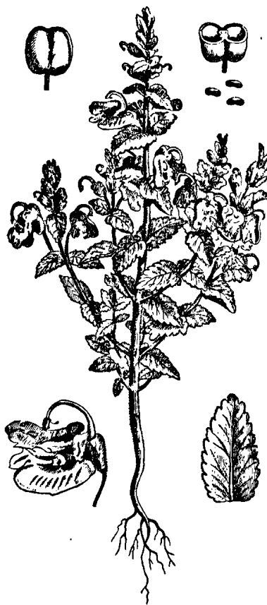
Փղկնիկ ծաղիկ (Elephas Orientalis).

տեսուն նկարել տուեր էր : Էդուկ, որ այս պատկերացոյց տախտակներս ժա- մանակին 'ի լոյս ընծայուեցան . ասոնք Լատէի պարտէզին ունեցածներէն ա-