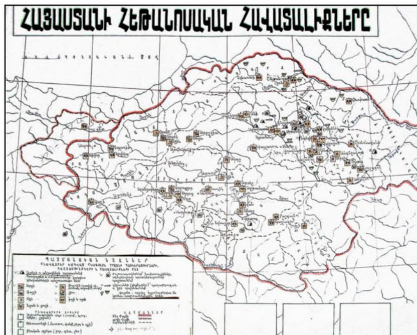
Fig. 2. Pagan Beliefs in Armenia

B/ The second map – “Pagan Beliefs in Armenia”, reflects the oldest religious beliefs and related pantheistic notions, including the worship of mountains and caves, plants and animals, rivers and lakes, etc. (fig. 2). The map also shows the places of worship of the stone stelas – vishaps (dragons), petroglyphs with cult content, the sanctuaries and all sorts of shrines created by nature and man.