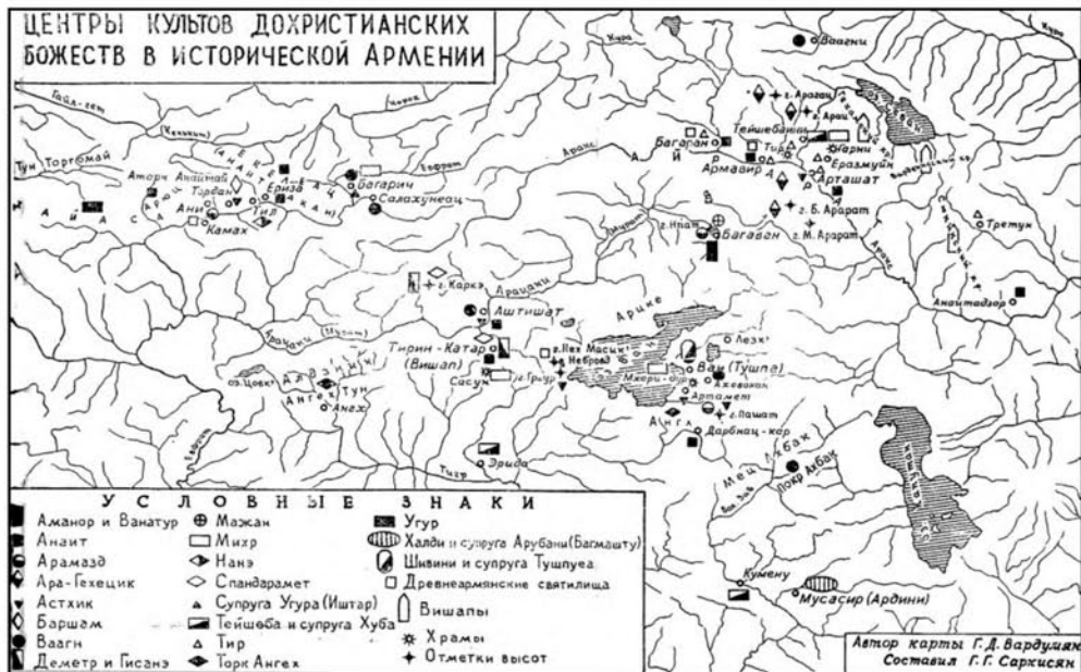
Fig. 1. The Cult Centers of the Pre-Christian Deities in Historical Armenia

The main material of this map includes the sanctuaries, temples of gods and goddesses, according to stages of development of the heathen pantheon. Thus, from the Hayasan pantheon (XV–XIII centuries BC), only two worship centers of the supreme couple are indicated on the map: the father god Ugur in the central city of Hayasa (of the country of Hayasa-Azzi), and the mother goddess, whose name is conveyed by Ishtar's ideogram, in Bagarich (the province of Higher Armenia). Information about these and other deities of the Hayasan pantheon (the cult centers of which are also noted in the inscription, but not reflected on our map) comes from Hittite sources, and these materials are mostly published. 3 The main source is a political document – a treaty concluded between the king of the Hittite Empire and the ruler of Hayasa, in the oath part of which the deities of