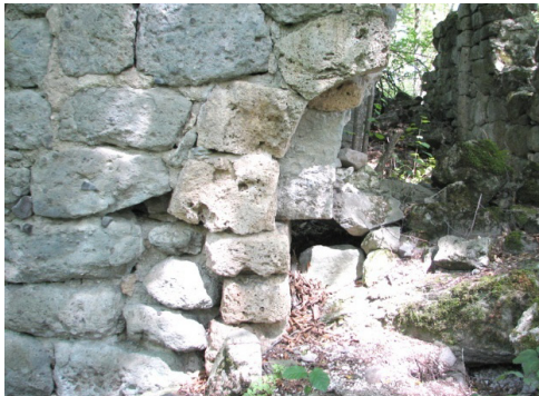
The entrance survived

The monument is in ruins today. Only a northern part with 5,5 m height survived, while both eastern and western sides survived only partially. The southern part did not survive at all. The ground of the church is around 1,0 – 1,5 m, while the niche is still under ruins. The western entrance survived. It includes a smooth lintel provided with a mosaic made of a shaved rose travertine. The altar is divided from the hall by a thin line of a rose shaved travertine. It should be noted that the church has got a very modest decorative design. The only decoration found in the church can be that shaved rose travertine. No additional decorations, mosaic or inscriptions are to find here.