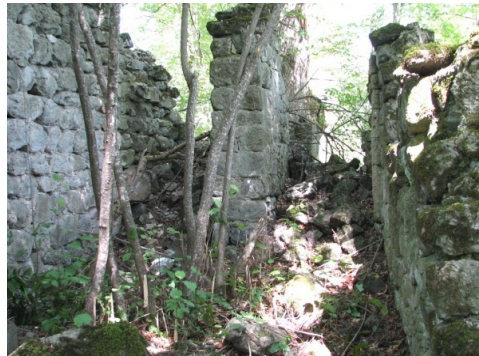
The altar of the church

Having analyzed the ruins in details we came to a conclusion that the church had been reconstructed before. It becomes clear while examining the altar. Initially, it was built as a single-apsed church. The altar had a low scene the front side of which was outlined by a shaved laying. The altar also had a rather wide pre-altar area which from inner side was limited by an arc emerging the semicircle.