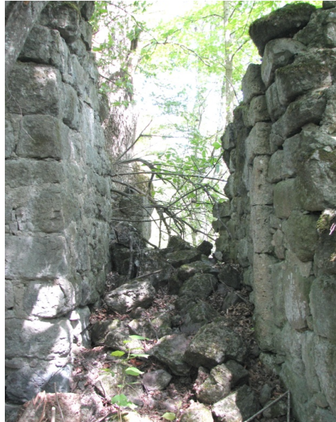
The southern altar of the church

Subsequently, during the restoration works, a partition was erected along the altar axis, which divided the large altar into two narrow, the northern and southern altars. In favor of this division's somewhat later dating speaks a fact that the eastern wall of both altars is no longer a semicircle, as it was initially, but a curvilinear. In addition, a frontface of the partition was built with grey sandstone and not a shaved rose travertine as it was in case of the large altar. It is worth noting that churches with double-altars emerging in the main hall are uncommon for Armenia. Likewise, they are very unusual for Artsakh architectural tradition. For instance, two small churches of the Apostol Elishe monastery were built this way. Their extra narrow altars have a semicircle shape and a single window looking eastwards. In our case, both narrow altars are not assumed by semicircles, but they do have a single window looking eastwards. By the way, one can notice that partially survived windows of altars with the time became wider. They were covered by the aforementioned shaved travertine. A condition of stay of the eastern facade does not allow us to state that those both windows were built during the restoration works. It is likely that initially the large altar had three windows, unless the central one was subsequently closed as the partition was erected.