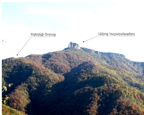
A view of Kachaghakaberd from Qolatak village

By an administrative division of the Republic of Nagorno-Karabakh, Kachaghakaberd and its church are located within the Khachen village of the Askeran region. However, while being mentioned by primary sources as a fortress attached to the village of Qolatak, we should probably keep this information for our further discussion.