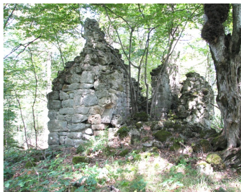
A view of the church from South-West

Kachaghakaberd is one of the most famous fortresses of Artsakh-Karabakh. For its magnificent outlook it always attracted the attention of scholars. Unlike other numerous fortresses in the region, Kachaghakaberd is mentioned in the primary