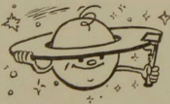
Սատուրնի օղակի լայնությունը 1 մ է:

Չախլիկները կազմում են երկրագնդի բնակչության մոտ երկու տոկոսը: Հետաքրքրական է, որ նրանց թիվը ժամանակի ընթացքում դրեթե չի փոփոխվում: