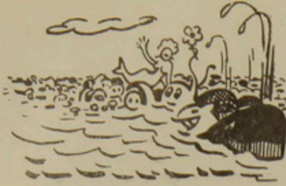
Օվկիանոսում բնակվում է կենդանիների բազմաթիվ տեսակ:

Ամերիկայում գտնվող շվեյցարական տուրիստական բյուրոն իր շվեդ կոլեգաներին առաջարկել է համատեղ բացատրական աշխատանք տանել ամերիկացիների շրջանում հետևյալ լողունը՝ «Շվեդիան և Շվեյցարիան դա նույն բանը չէ»: Այդպիսի ընկերության անհրաժեշտությունը բացատրվում է նրանով, որ ամերիկացիները ծանոթանալով շվեյցարական տուրիստական պրոպակտներին, հաճախ տուժանք են գնում... Շվեդիա մեկնելու համար և ընդհակառակը: