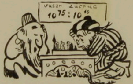
Շախմատային խաղի բոլոր վարիանտների ընդհանուր թիվը 10^{140} է: