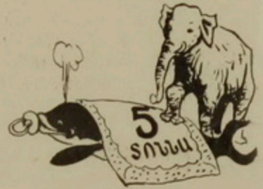
Կապույտ կետի նորածին ձագը կշռում է չափահաս փղից ավելի՝ մոտ 5 տոննա:

Մեծ թվով հայեր են ապրում Բուլղարիայում, Ռումինիայում, Արգենտինայում, Բրազիլիայում, Հոնաստանում, Իրաքում, Իրանում, Թուրքիայում, Կանադայում, Եթովպիայում, Սուդանում, Հնդկաստանում և այլ երկրներում: