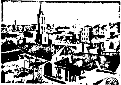
ԱՏԱՆ, Հայկական թաղամասը

29.- Ակնարկութիւն 8 Յունուար 1918-ին նախագահ Ուիլսոնի հրատարակած 14 կէտերուն, որոնք համաշխարհային խաղաղութեան հաստատման նպատող սկզբունքներ կը նախատեսուէին ըլլալ Համաշխարհային Առաջին Պատերազմի արարուէն ետք ձեռնարկուած խաղաղութեան բանակցութիւններու ընթացքին: 12-րդ կէտը ուղղակի կ'առնուէր Օսմանեան դաւն լուծը ճաշկանած ժողովուրդներուն եւ կը տրամադրէր. «Ներկայ Օսմանեան Կայսրութեան բրբական բաժնին պէտք է երաշխատրուի ապահով ինքնիշխանութիւն, բայց միւս ազգութիւններուն, որոնք այժմ կը գտնուին բրբական իշխանութեան ներքեւ, պէտք է երաշխատրուին կեանքի աներկբայ ապահովութիւն եւ ինքնավար զարգացման բացարձակապէս անընձարելի պատեհութիւն...»: