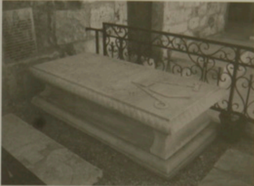
Չախին Պարոնտէրի եսկ աջին Շոքայակիրի շիրմաքարերը, Ս. Փրկիչ գերեզմանատուն, Երուսաղէմ

Բայց աջողմամբն Աստուծոյ ամենայն պարտուցն ազատեաց զՍուրբ Արքուն, եւ պայծառակերպ եւ շքեղաբանձ եւ անպատմելի զարդեօք զարդարեաց, զմէջ տաճարին