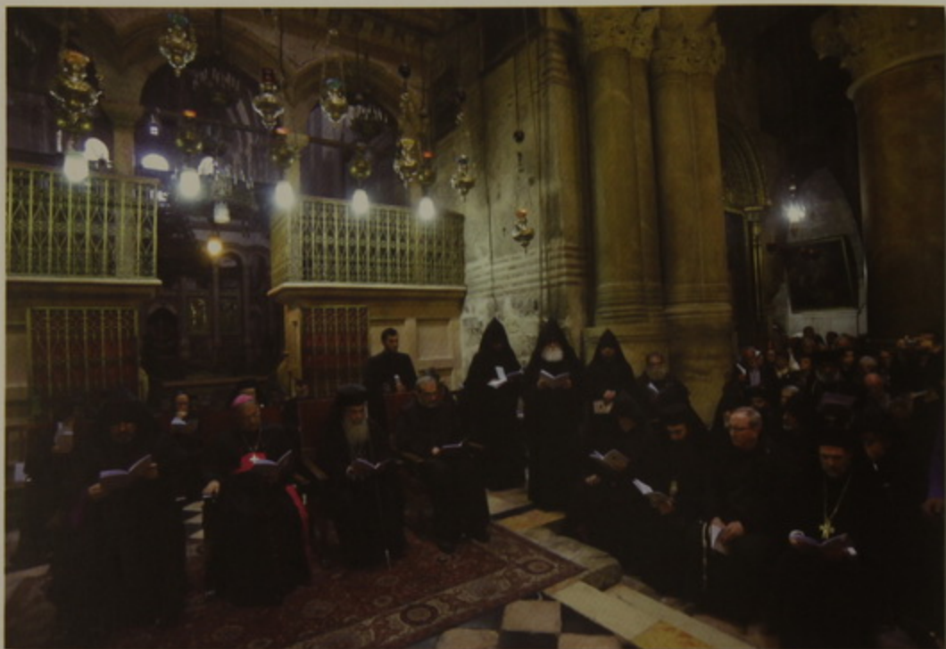
Պատրիարք Հայրն ու քոյր եկեղեցիներու բարձրագոյն առաջնորդները կը ձայնակցին հոգեպարար արարողութեան