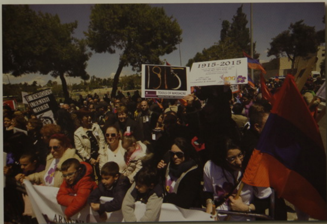
Պահանջատէր հայութիւնը Թուրքիոյ հիպատոսարանին առջեւ