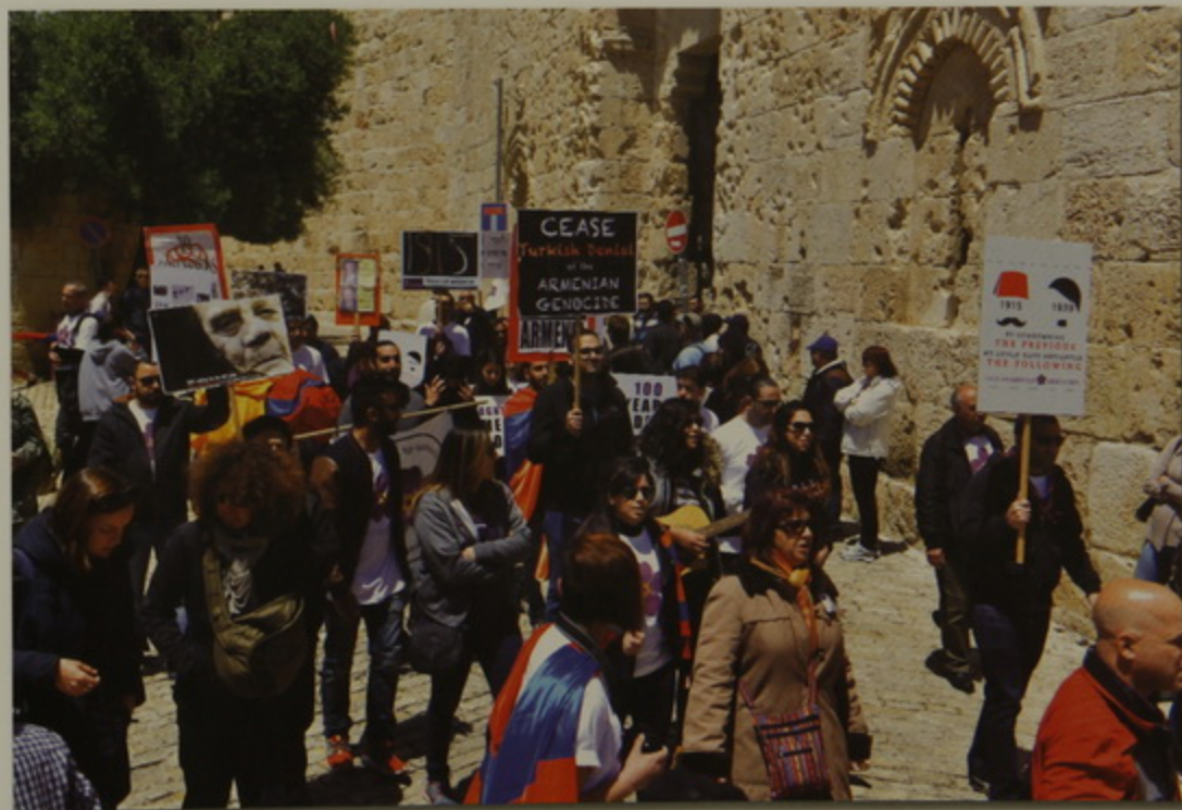
Ս. Փրկիչի մօտ. Սիոնի դուռ