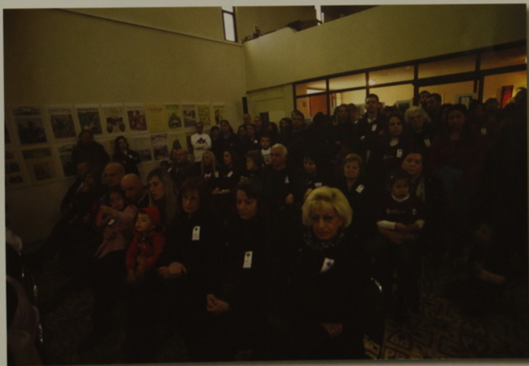
100-ամեակի Յուշահանդէս. երեք սերունդ