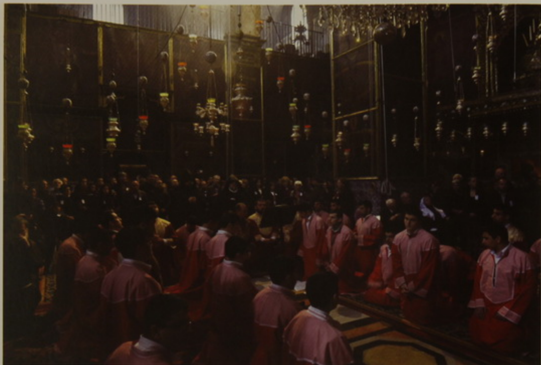
Հակոբ Ս. Յակոբյան տաճարին ներս