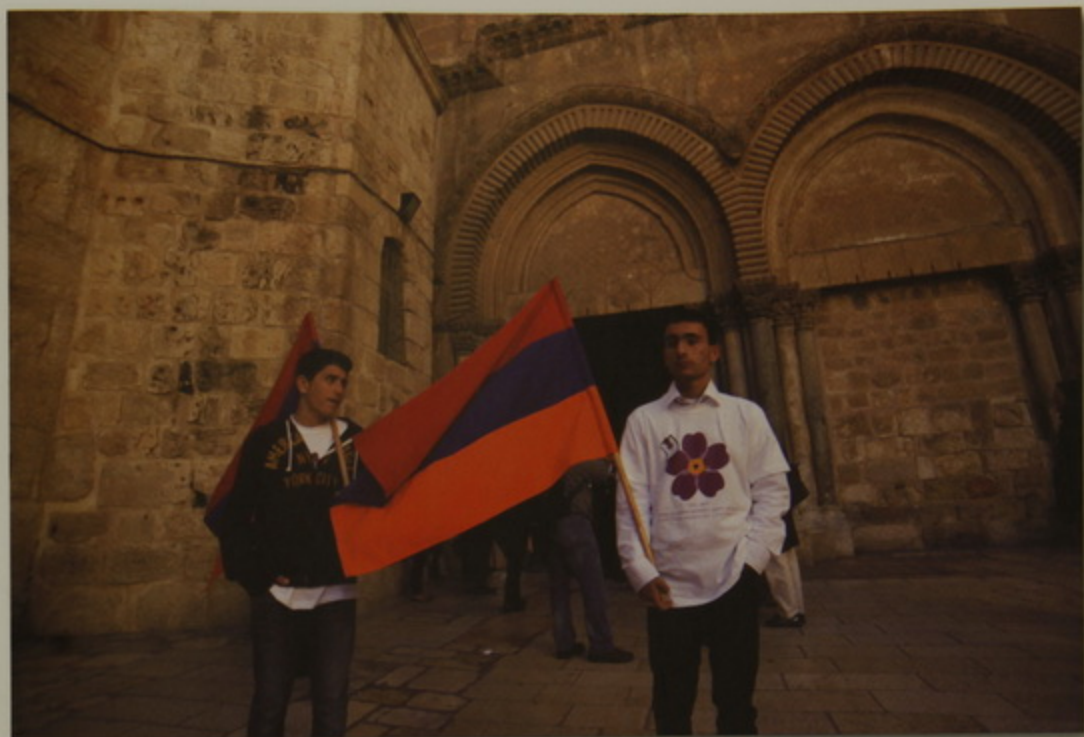
Հայ դրօշի հպարտ պաշտպանները