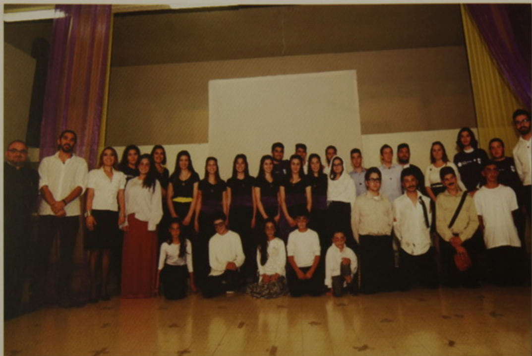
Թարգմանչաց վարժարանի մասնակիցները 100-ամեակի Յուշահանդեսին