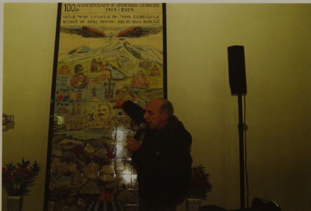
«Մահ եւ Վերածնունդ». գործ՝ Վիգեն Լեփեճեանի