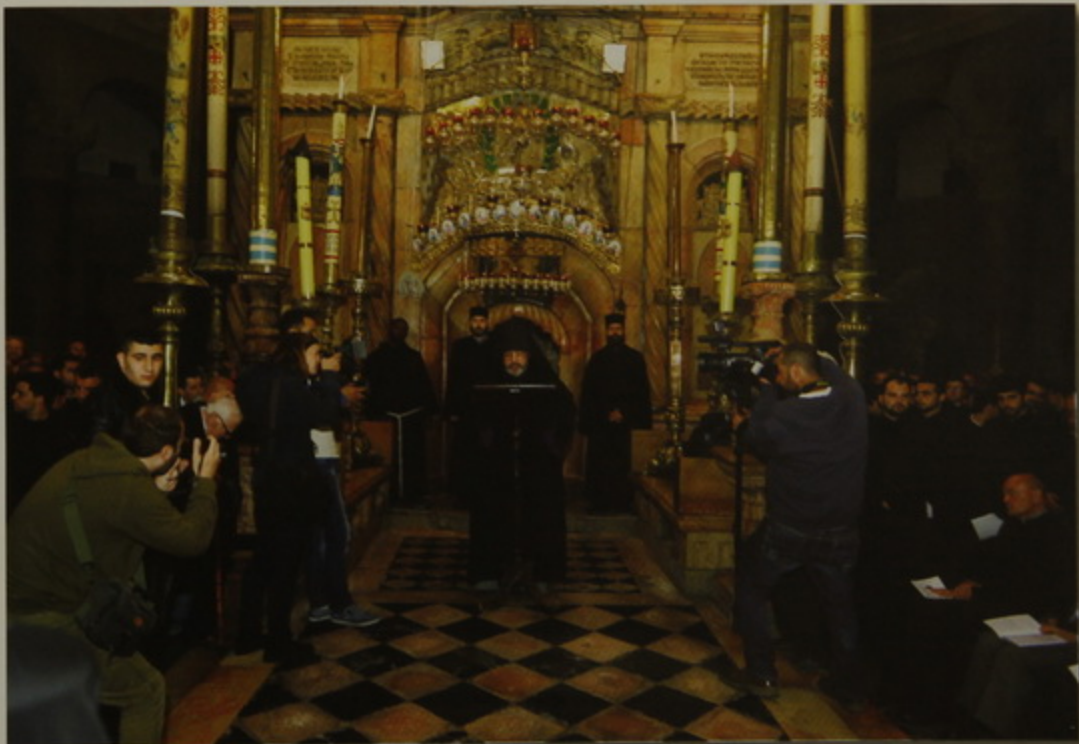
Պատրիարք Հօր պատգամը Բրիստոսի Ս. Գերեզմանին առջեւ