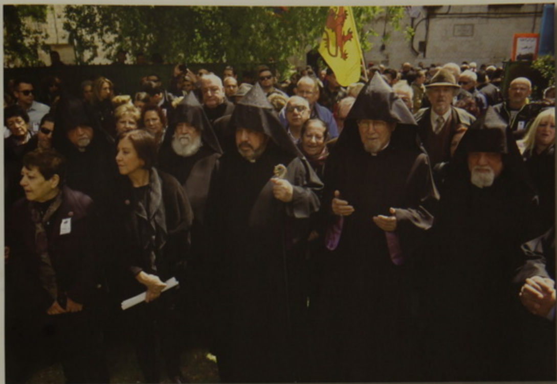
Տէրունական աղօթք Յեղասպանութեան յուշարձանին առջեւ