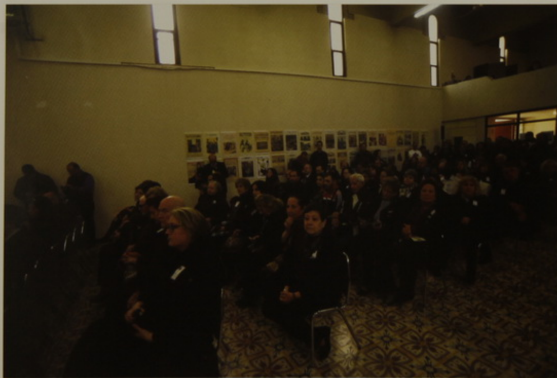
Յուշահանդէսի ներկայ հասարակութիւնը