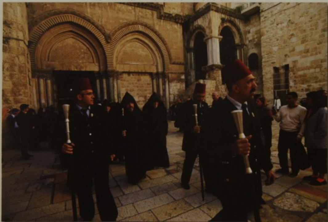
Պատրիարք Հայրը եւ իր շքախումբը Ս. Յարութեան տաճարէն կը վերադառնան Մայրավանք