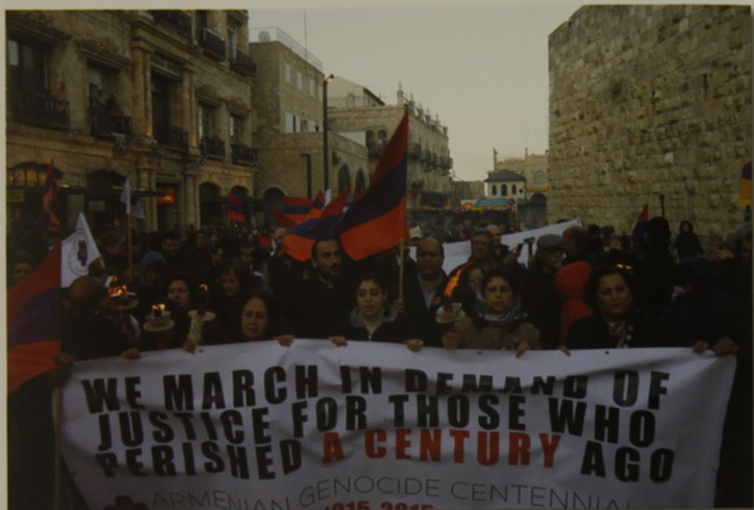
Երուսաղէմ, հին քաղաք. Պահանջատէր Սաղիմահայութիւնը