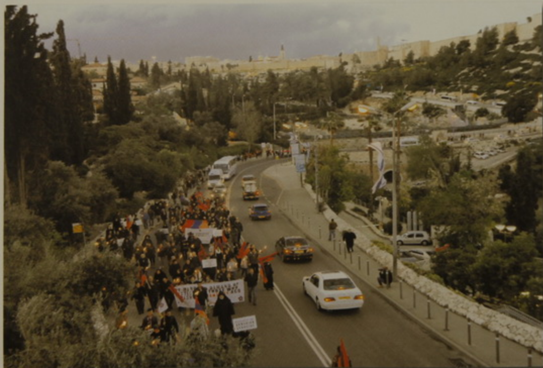
Մոմաւառութեամբ խաղաղ երթ դէպի Ս. Գրիգոր, նոր Երուսաղէմ