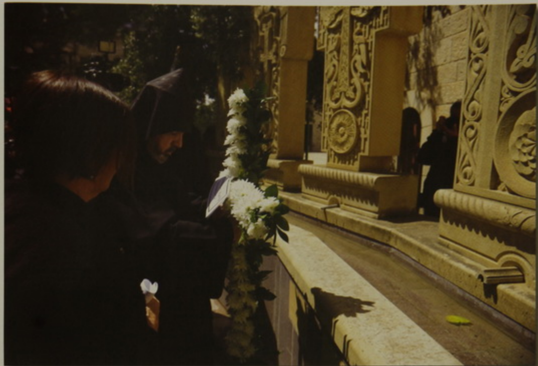
Ամենապատիւ Պատրիարք Հայրը Յեղասպանութեան Յուշարձանին առջեւ