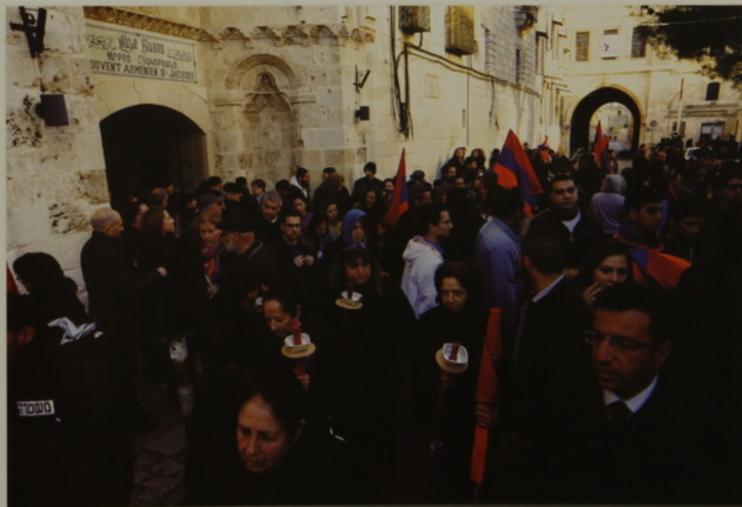
Դէպի Ս. Գրիգոր, նոր Երուսաղէմ