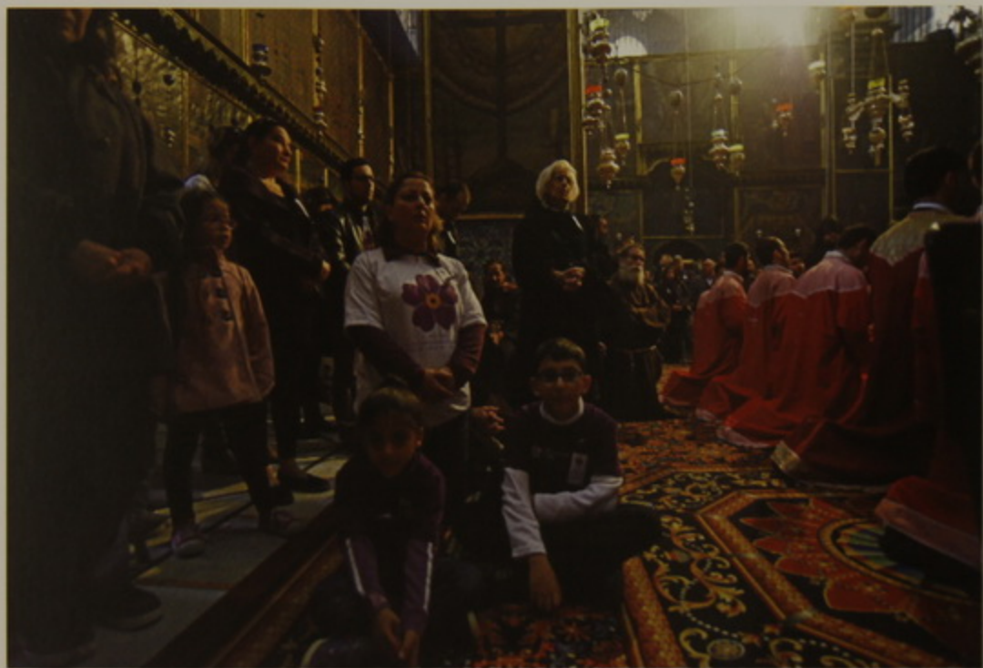
Հոգեհանգիստ Ս. Յակոբայ Մայրավանքին մէջ