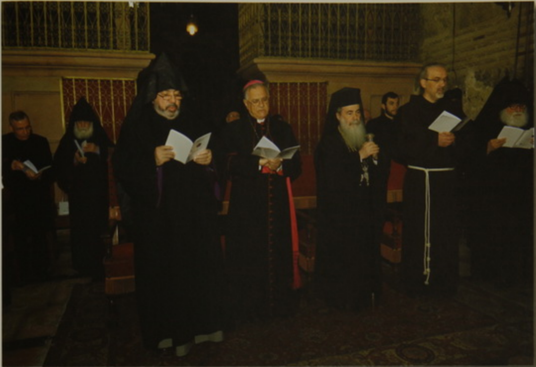
Պատրիարք Հայրն ու քյոյ եկեղեցիներու բարձրագոյն առաջնորդները կ'աղօթեն Բրիստոսի Ս. Գերեզմանին դիմաց