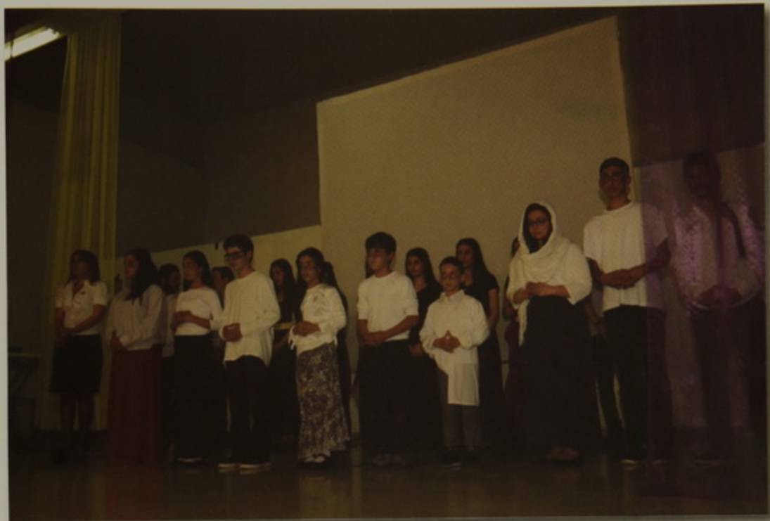
Սրբոց Թարգմանչաց վարժարանի աշակերտներու ներկայացում