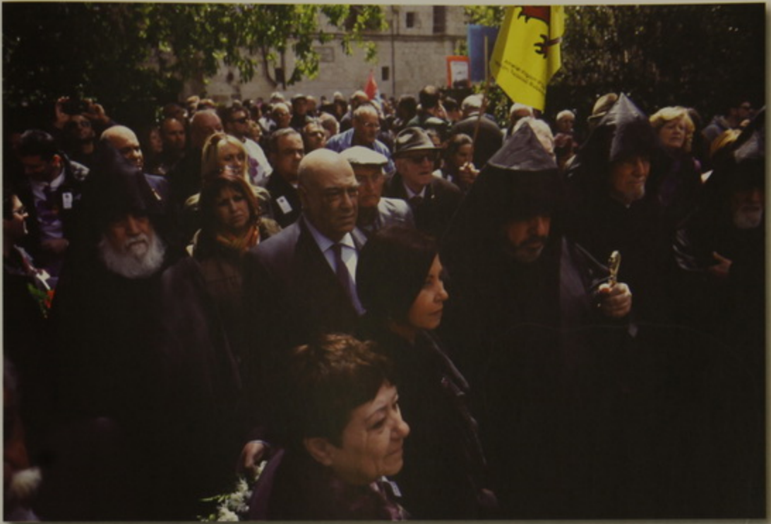
Յեղասպանութեան Յուշարձանի առջեւ