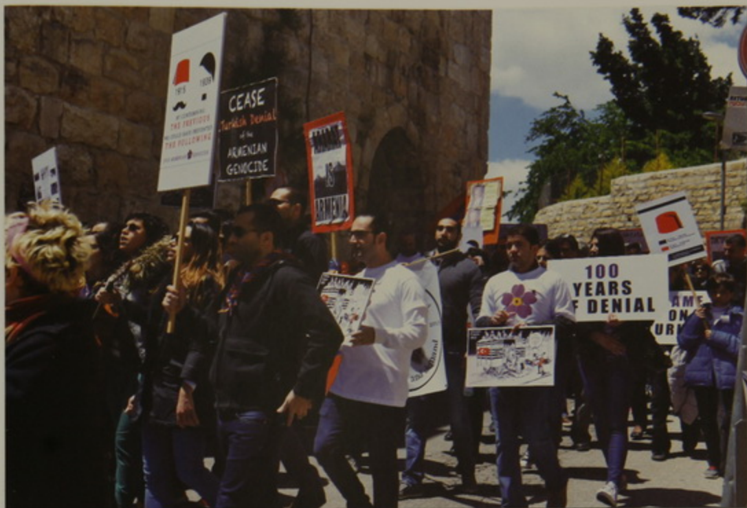
Երիտասարդներու բողոքի քայլարշաւ