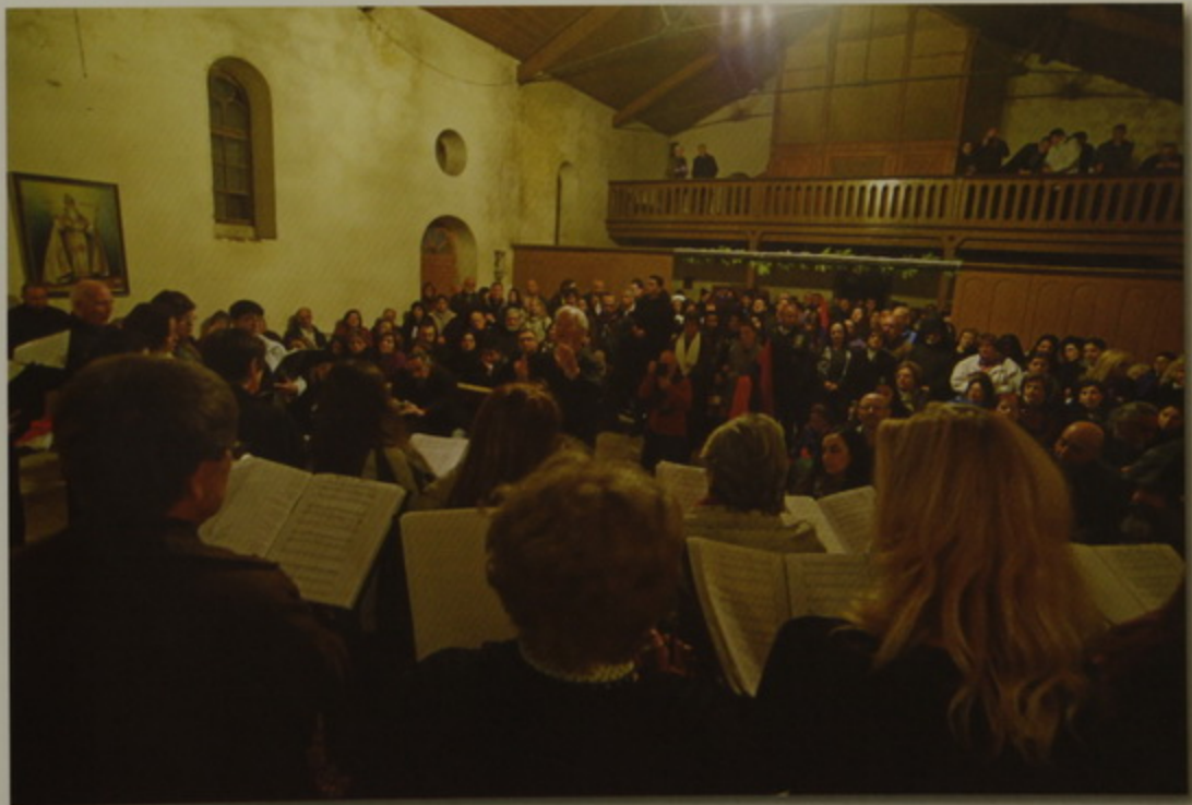
Եղեռնի զոհերուն նուիրում համերգ Ս. Գրիգոր եկեղեցոյ մէջ