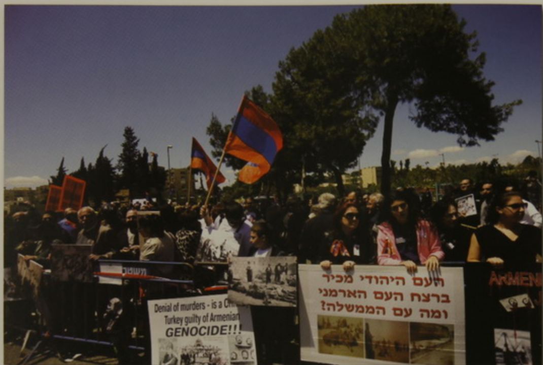
Թուրքիոյ հիւպատոսարանին առջեւ