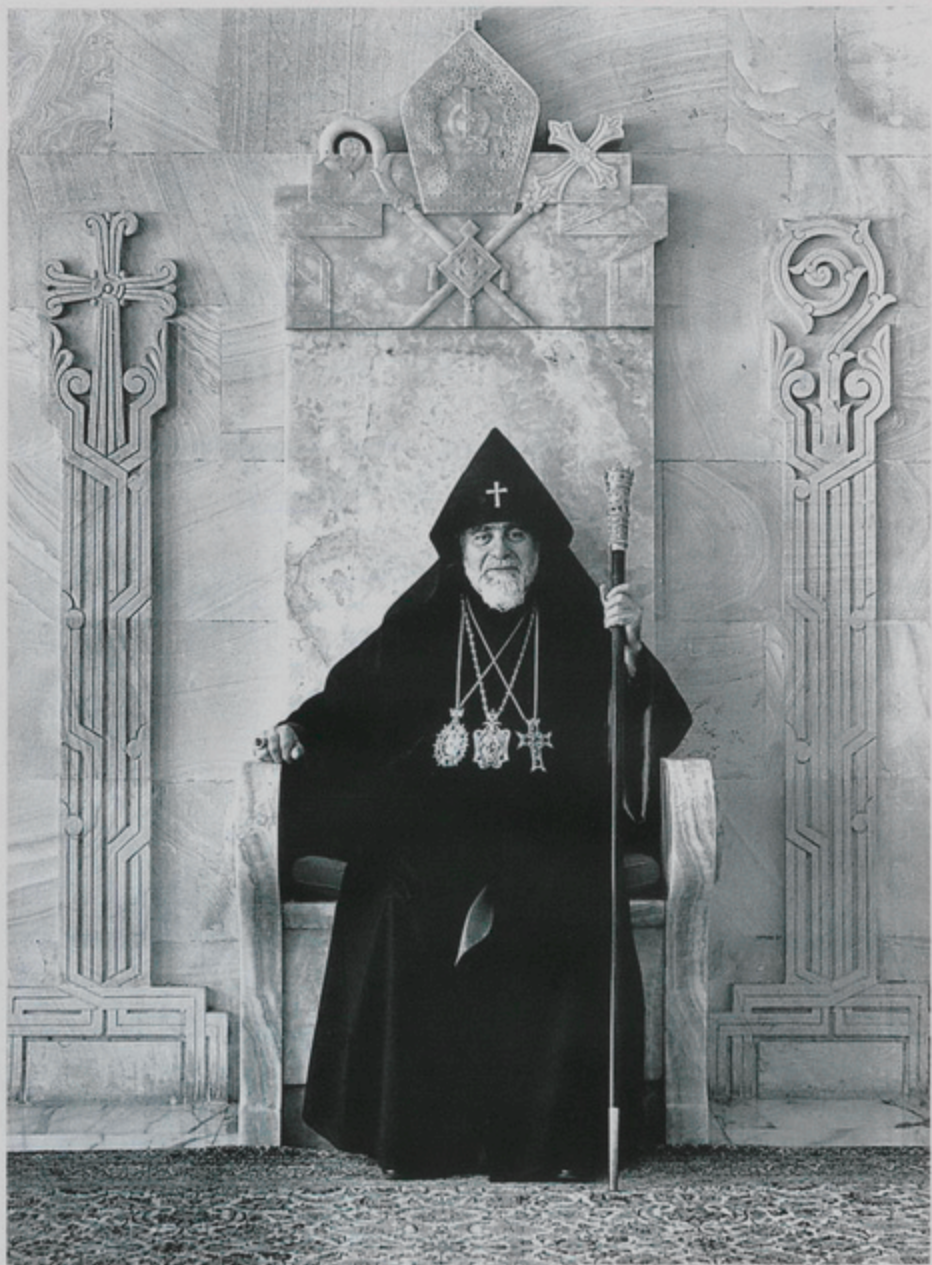
ԳԱՐԵԳԻՆ Ա. ԿԱԹՈՂԻԿՈՍ ԱՄԵՆԱՅՆ ՀԱՅՈՑ (1982-1999)