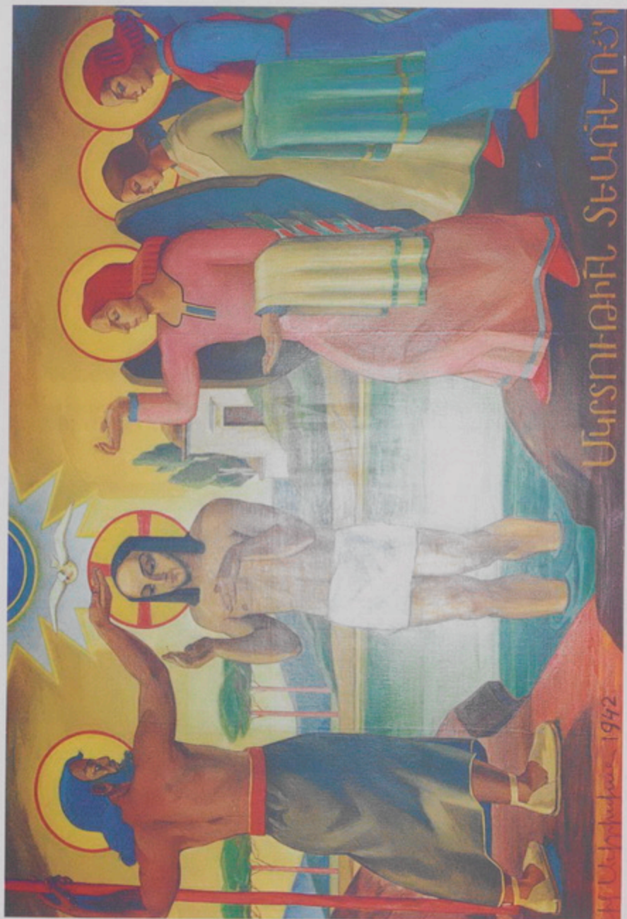
Արհեստագիտական Տեսիլ-Ո՞ր (1942), Հովհաննես Խաչատրյանի օգտագործմամբ