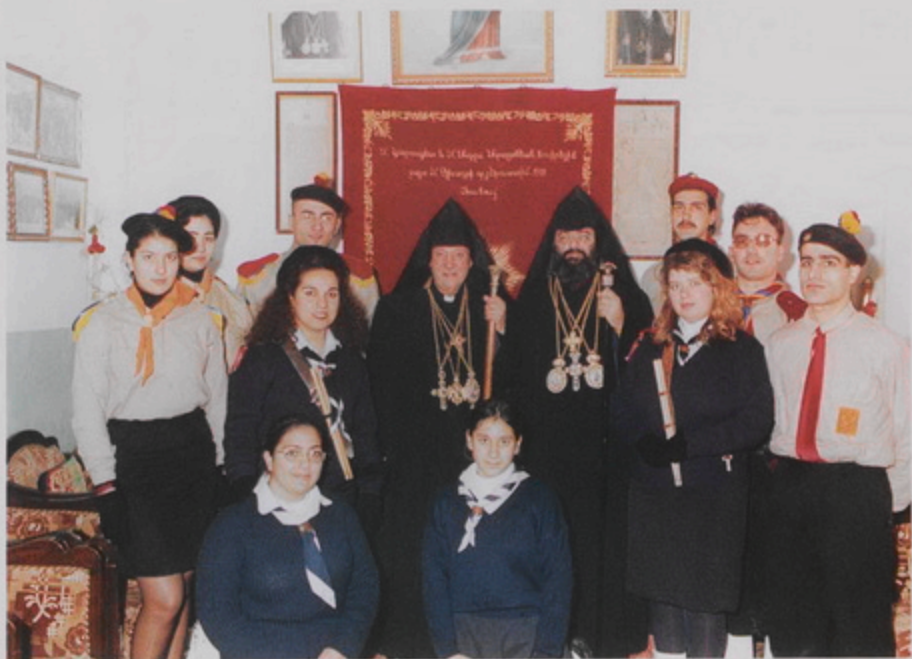
Հ.Ա.Բ.Ա.ի և Հ.Ե.Ա.ի սկսառւումներ Թորգոմ և Մնարոյ Պատրիարքներուն հետ Բերդիէմի Հայոց Վանի Տնայարանին մէջ, 18 Յնվր. 1999