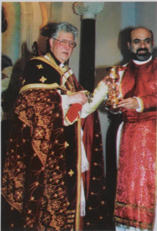
Վան Նայսի Ս. Պետրոս եկեղեցւոյ օծման 40 ամեակին առիթով, Հոգևոր Հովիւ Տ. Ծնոյիւի Բեկ, Տեմիրնեան Թորգոմ Պատրիարքէն կր ստանայ Երուսաղէմէն նուէր բերուած սկիի մը