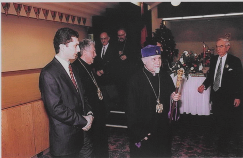
Գարեգին Ա. Վեհ. Կաթողիկոսի մոտեր Նիլ Եօրբի Ս. Վարդան Մայր Տանարի Դատոհնան սրահի հիւրասիրութեան սահուն (Պիր. 20 Դեկտ. 1998)