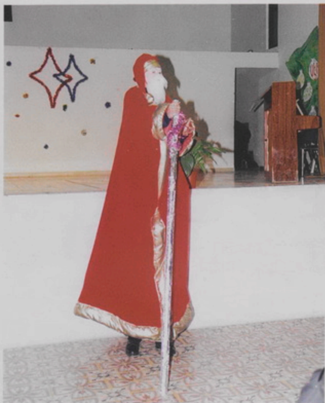
ժողովադատաց Վարժարանի նոր Տարուան «Կաղանկ Պապուկը» (15 Յնվր. 1999)