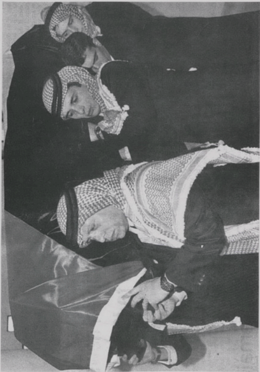
Հանգուցեալ Հիւսէյն Ա. Բազաւորին դաժարը կրօնկտուն շարքին Ազատ լիւսի Բ. Բազաւոր հողմանին (9 Փետր. 1999)