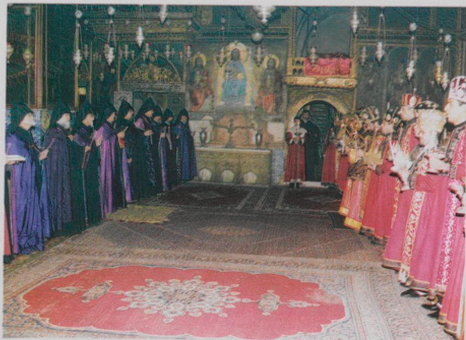
Ս. Ստեփանոս նախասարկապի տոնին առիթով սարկապաց հանդիսությունը Առաքելական ժամերգության ընթացքին (7 Յուն. 1999)