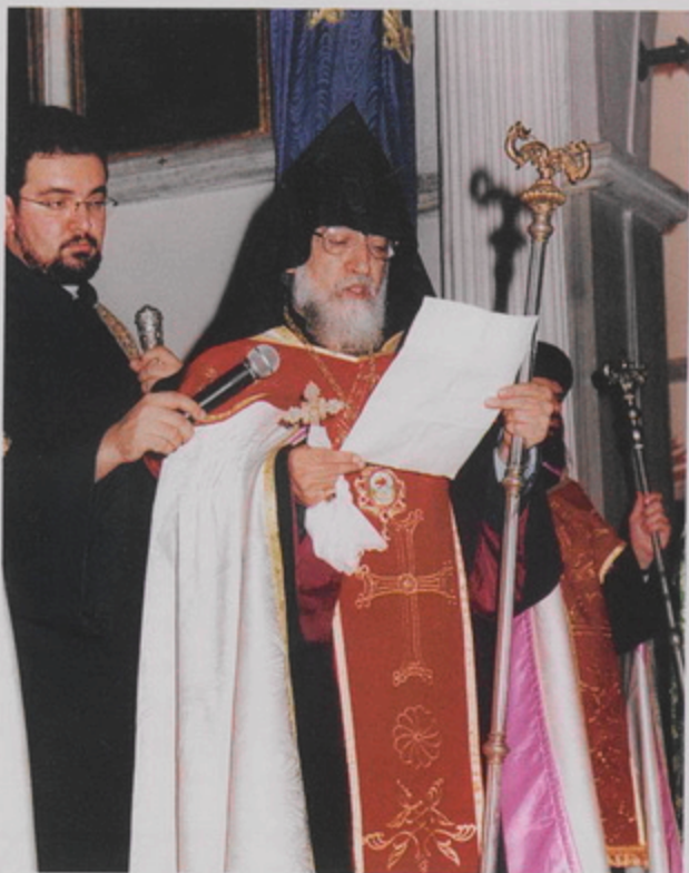
Թուրքիոյ Հայոց նորրնսիր Պատրիարք Ամեն. Տ. Մեսրոպ Աբբ. Մուրաֆեանի գահակալութեան առիթով՝ Տ. Սևան եպս. Ղարիպեան կ'ընթեռնու շնորհաւորական գիրը Երուսաղէմէն Թուրքոմ Պատրիարքին (21 Նոյ. 1998)