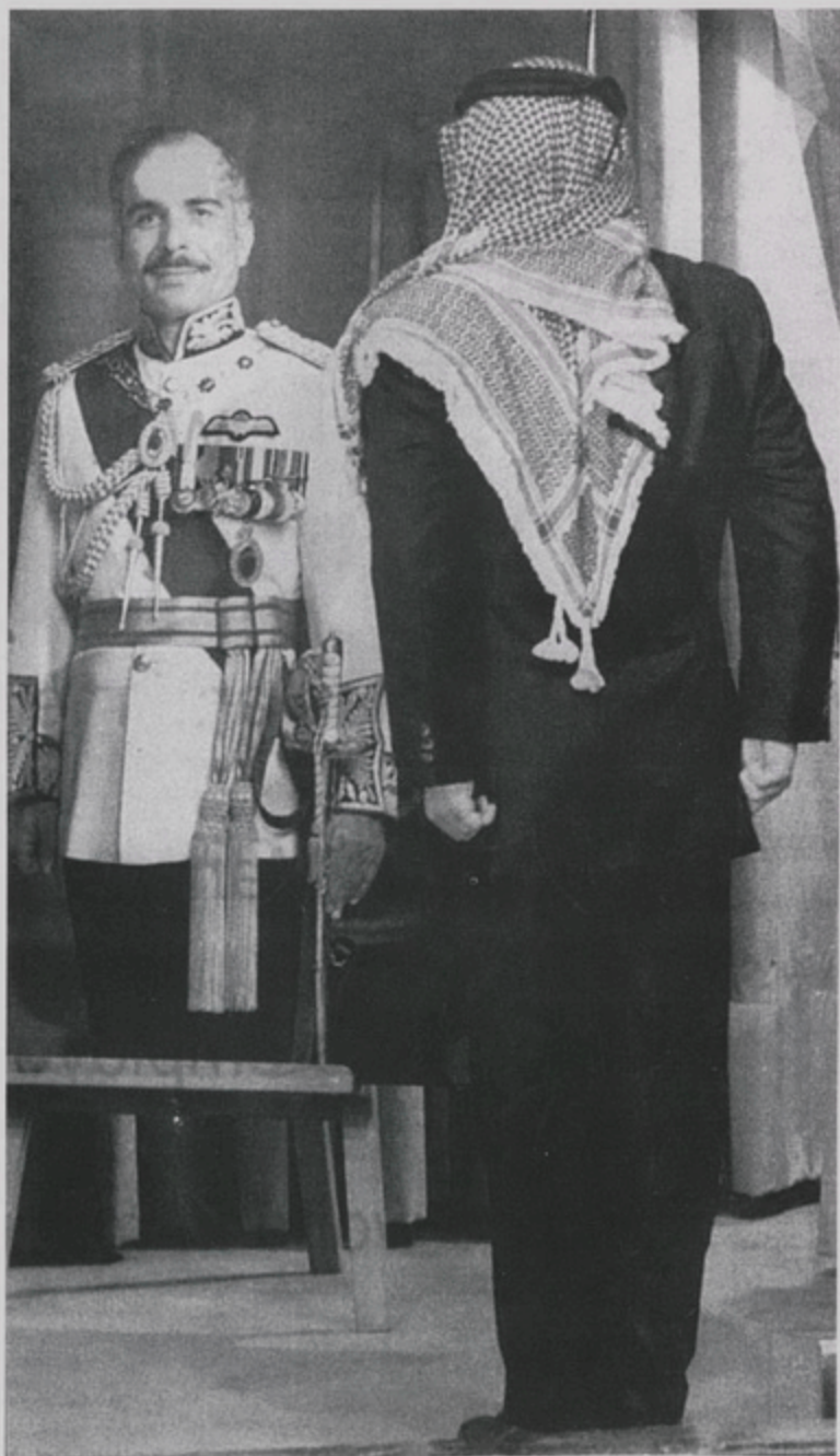
Ապտուլլահ Բ. Քազար Յորդանանի ուխտառության համար ստի մը նկարին առջև՝ հանգուցեալ Հիւսէյն Քազարին (8 Փետր. 1999)