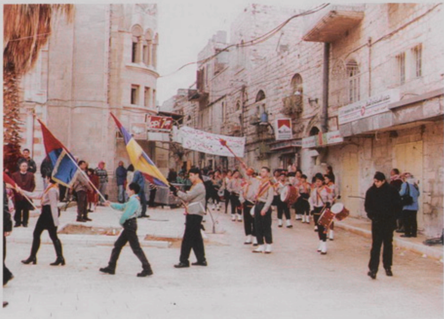
Հայկական Մեծին դեպի Քերդիէմ, 18 Յնվր. 1999, Հայ Մարմնակրական Ընդհանուր Միութեան սկաւումնը կ'առաջնորդեն բափօրը Քերդիէմի մուտքն դեպի հրապարակը