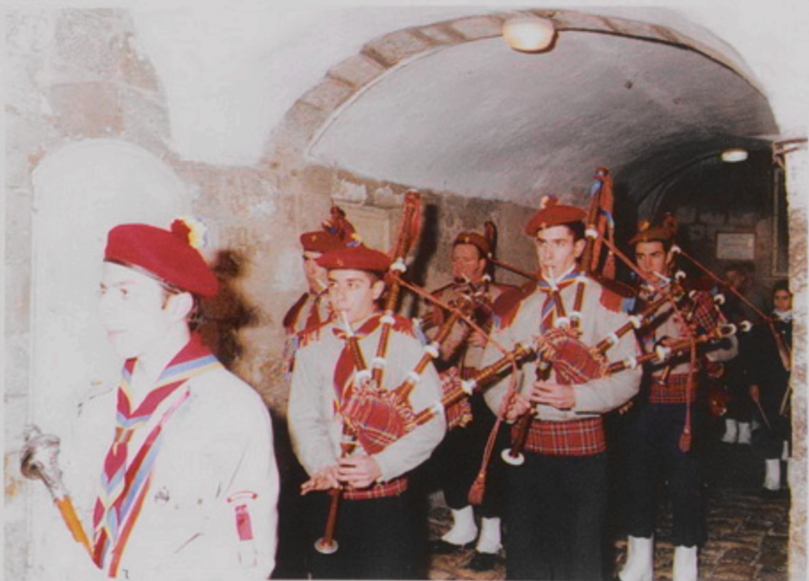
Հայկական Մեծին դեպի Քերդիէմ, 18 Յնվր. 1999, Հայ երիտասարդաց Միութեան Պարկապուկի խումբը