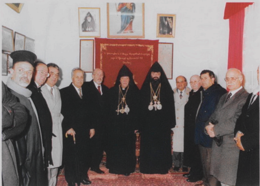
Պաղեստինեան իշխանութեան ներկայացուցիչներ Թորգոմ և Մնարոյ Պատրիարքներուն հետ Բերդիէմի Հայոց Վանի Տնայարանին մէջ, 18 Յնվր. 1999