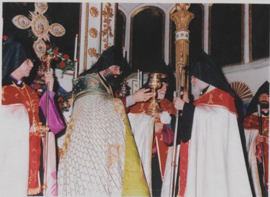
Թուրքիոյ Հայոց նորրնսիր Պատրիարք Ամեն. Տ. Մեսրոպ Աբբ. Մուրաֆեանի գահակալութեան առիթով՝ Տ. Սևան եպս. Ղարիպեան կը ներկայացնէ Երուսաղէմի Աբրոյո Արարանութեան սկիւնուէրը (21 Նոյ. 1998)