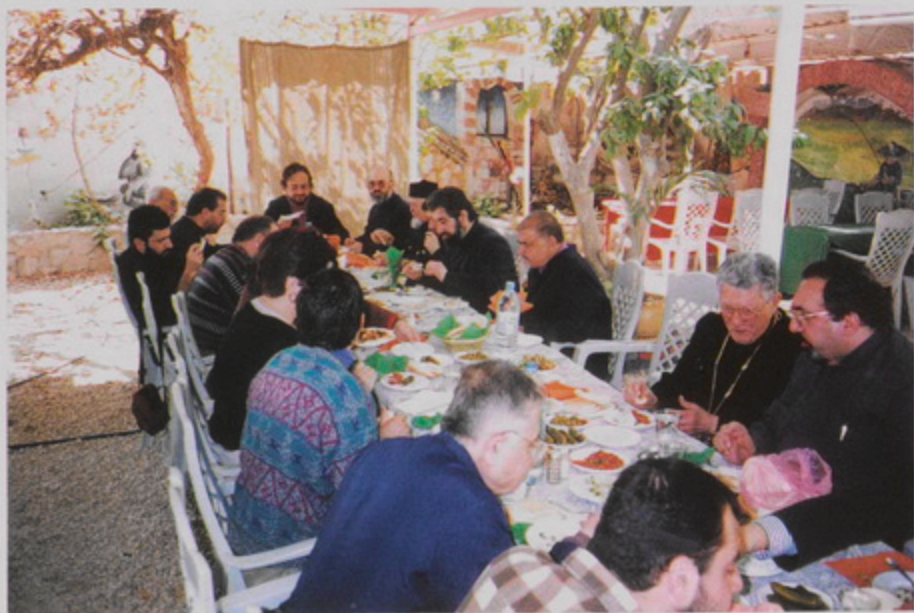
Յորդանան գետի եզերքը արգելիք գոտիի մէջ գտնուող վանհասցատեան հողին այցէն յետոյ, շրջապատյա Երիւնդի տեսարժան վայրերի եւ Միաբանական ճաշ, 22 Փետր. 1999