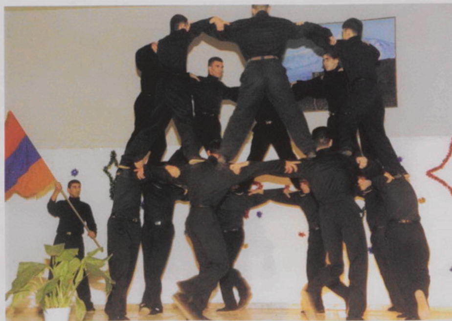
Իրիգում Պատրիարքի 80ամեակի և ճեմնադպրոցի 60ամեակի ընդմիջման ժամանակ տեղի ունեցած խաղերից մեկը