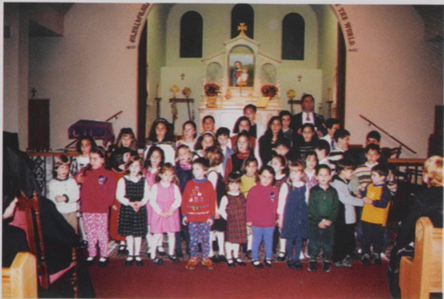
Հիսսային Գալիֆորնիոյ Գոսփերրինոի Ս. Անդրեաս Եկեղեցւոյ Հայ Գալլոցի աշակերտներու յայտագիրը ի յարգանս Թորգոմ Պատրիարքի