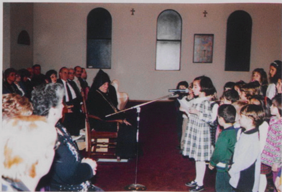
Գոսփերրինոի Ս. Անդրեաս Եկեղեցւոյ Հայ Գալլոցի աշակերտներու խաչերն արտասանութիւնը Թորգոմ Պատրիարքի այցելութեան առիթ