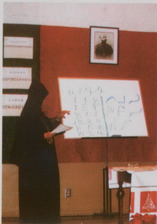
Կլետկլի մէջ Հայ Երաժշտանոցի Արաիկ մէջ, Թորգոմ Պատրիարք «Կոմիտասի Հանճարը իր երգերուն մէջէն» դասախոսութեան ընթացքին կը ներկայացնէ Կոմիտասի «Քառալարի» տեսութիւնը