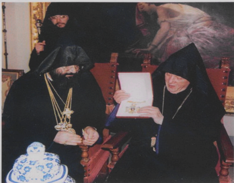
Կ. Պոլսոյ Պատրիարք Տ. Մեսրոպ Աբր. Մուրաֆեանի կողմէ, արուած նուէրը՝ Փետրակայի յակոյէ եւ արծուեկան