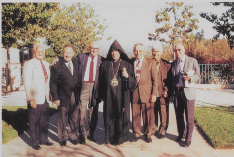
Թորգոմ Պատրիարք Լուս Ահնեկոսի Ագաթան Տունի Խնամակալ Մարմինի անդամներուն հետ