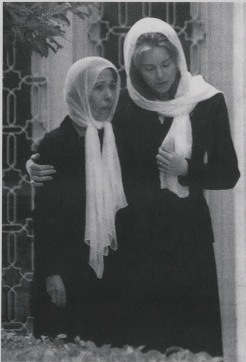
Հանգուցեալ Հիւսէյն Ա. Թագաւորի թաղումին սգակիր Թագուհի Նոր և Իշխանուհի Պատմա