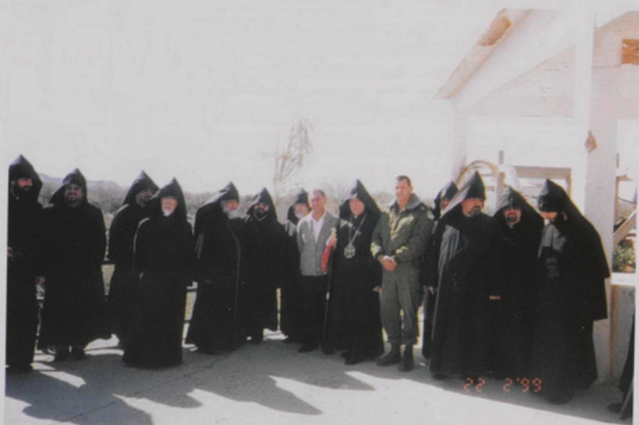
Պատրիարք Արքազանի և Միաբանության այցը Յուդանան գետի եզերքը արգիլեալ գոտիի մէջ գտնուող վանհատական հողին, 22 Փետր. 1999