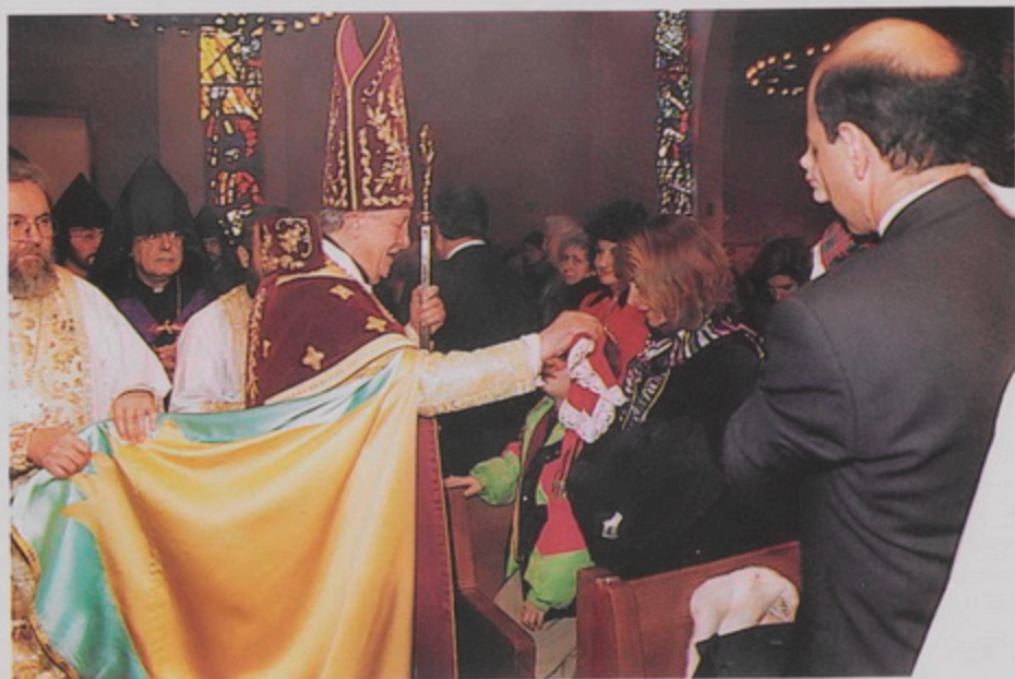
Նիւ Եօրփ Ս. Վարդան Մայր Տանարին մէջ, պատարագի Քորզոմ Պատրիարք, ճնողաց զրկի մանուկներուն «խաչ համբուրելը» (Սիր. 20 'Իկաւ. 1998)