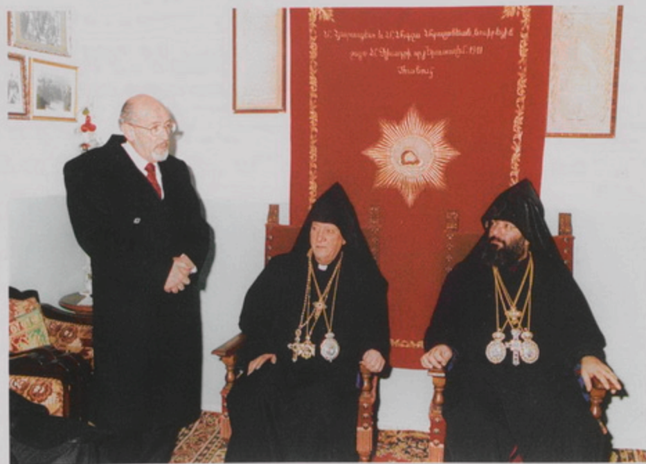
Բերդիեմէի Քաղաքապետ Հաննա Նաարրի Բարի Գալուստի խօսքը Բերդիեմէի Հայոց Վանքի Տեսչարանին մէջ, 18 Յնվր. 1999