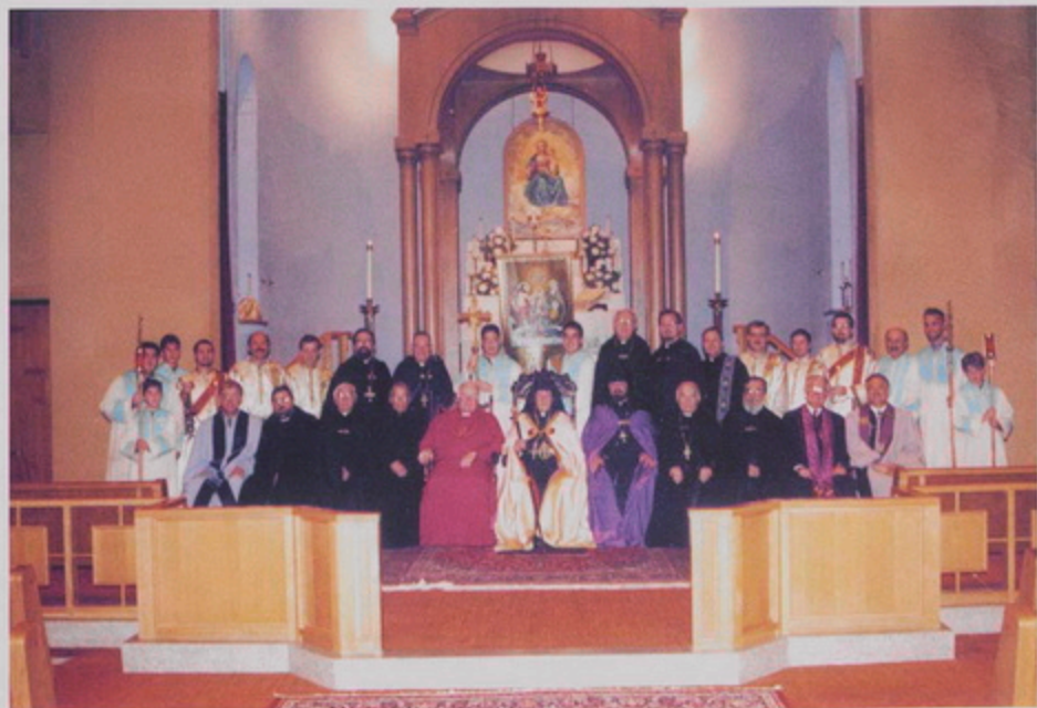
Յրեցնի Ս. Պօղոս Եկեղեցւոյ մէջ, Թորգոմ Պատրիարք Կնդրոնական Գալիֆօրնիոյ Հայ եւ Հիւր Եկեղեցականներու եւ խորանի սպասարկողներուն հետ: