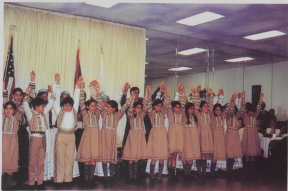
Գոսրա Մեսայի Ա. Աստուածածին եկեղեցույ ժամուկներու պարախումբը