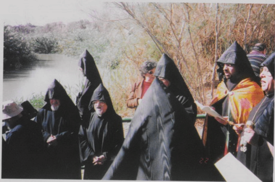
Պատրիարք Արքազանի և Միաբանության այցը Յուդանան գետի եզերքը արգիլեալ գոտիի մէջ գտնուող վանհատական հողին, 22 Փետր. 1999