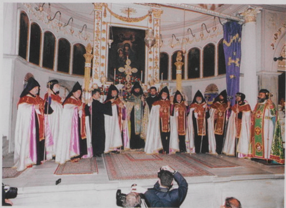
Կ. Պոլսոյ Մայր եկեղեցւոյ մէջ զատակալութիւն Թուրքիոյ Հայոց նորընտիր Պատրիարք, Ամեն. Տ. Մեսրոպ Աբր. Մուրաֆեանի (21 Նոյ. 1998)