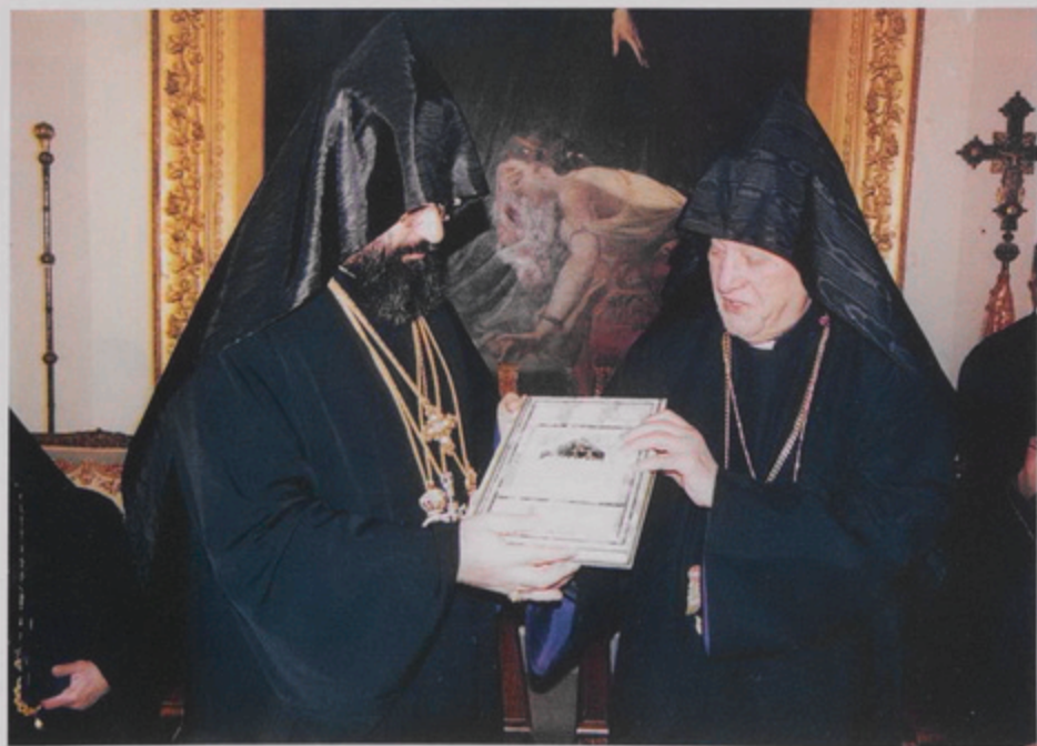
Կ. Պոլսոյ Պատրիարք Տ. Մեսրոպ Աբր. Մուրաֆեանի Միաբանութեան կողմէ, արուած նուէրը՝ սառափէ կողով Աւետարան