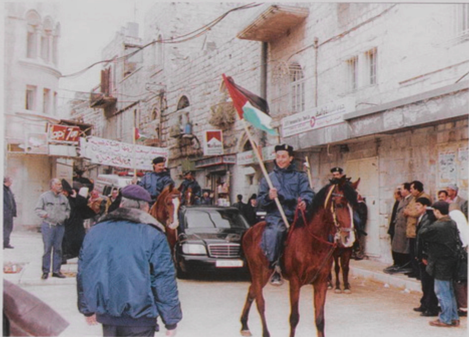
Հայկական Մնուկ դեպի Բերդիստ, 18 Յնվր. 1999. Պարտիզանական իրադրությունը Պատրիարք Սյրազանի ինքնաշարժին հետ բախորը կ'առաջնորդեն Խաչկի գերեզմանի սահմանագիծը դեպի Բերդիստի հրապարակը