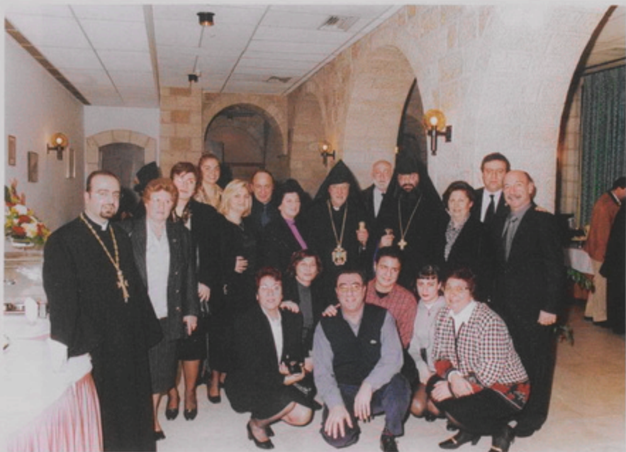
Նորրը Տամի պանդոկին մէջ ի պատիւ Մեսրոպ Պատրիարքին արուած ինչասիրութեան ուխտաւորներու խմբանկար