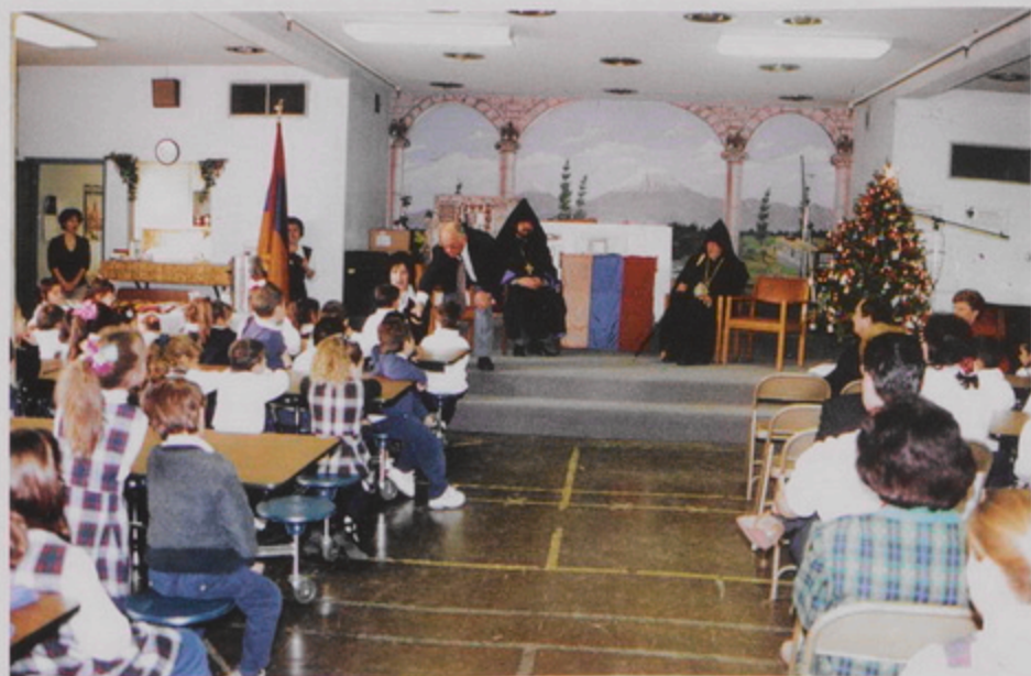
Թորգոմ Պատրիարք եւ Յրեցնի Ս. Պօղոս Եկեղեցւոյ Հովիւ Տ. Սասուն Մ. Վրդ. Զմրութեան Հայ Վարժարանի աշակերտներուն հետ: