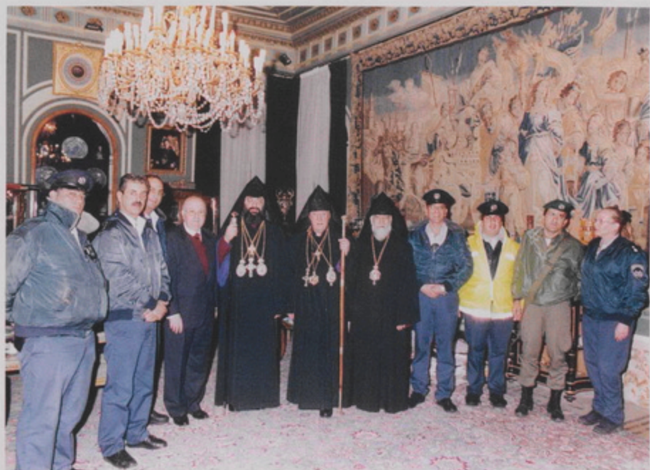
Հայկական Մեծնոց դեպի Բերդիեւ, 18 Յնվր. 1999, ոստիկանապետներուն աչքը Պատրիարքարան