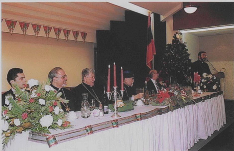
Նիլ Եօրբի Ս. Վարդան Մայր Տանարի Դատոհնան սրահին մէջ սարգեաւարտող թարեարկելու ի սահուն հաշկերոյին. Ջախն Աջ՝ ՄԱԿի մօտ Հայաստանի Դատան Մոլմտե Ապելեան. Տ. Մարտիրոս Քինյ. Չեւեան, Թորգոմ Պատրիարք Վեհափառ, Ն. Ա.Ր.Ա.Ր.Ք. Թաւառման (Պիր. 20 Դեկտ. 1998)