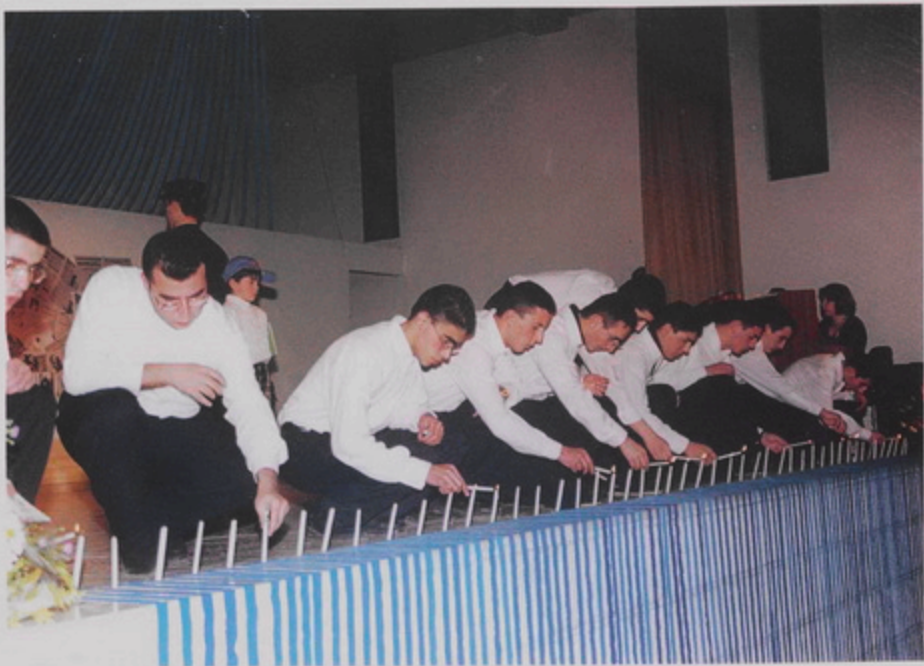
Իրիգում Պատրիարքի 80ամեակի և ճեմնադպրոցի 60ամեակի ընդմիջման ժամանակ տեղի ունեցած խաղերից մեկը