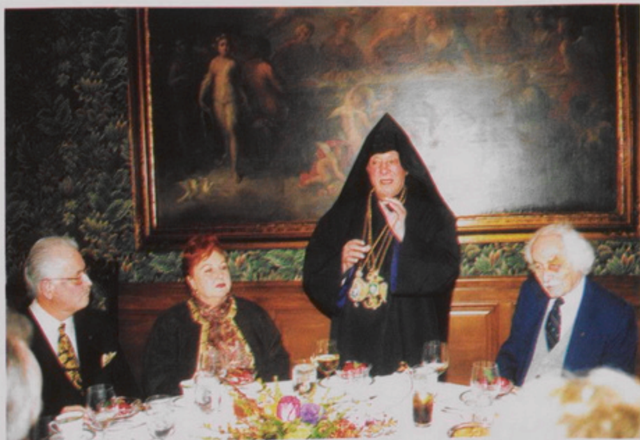
Լուս Ամենկոսի Գալիֆորնիա Գիտական մէջ Երուսաղէմի Ս. Լազարոս Ասպետական կարգի ընկերութեան անդամներուն Քորթոմ Պատրիարք և իր իրիկի Հայ Երուսաղէմի մասին