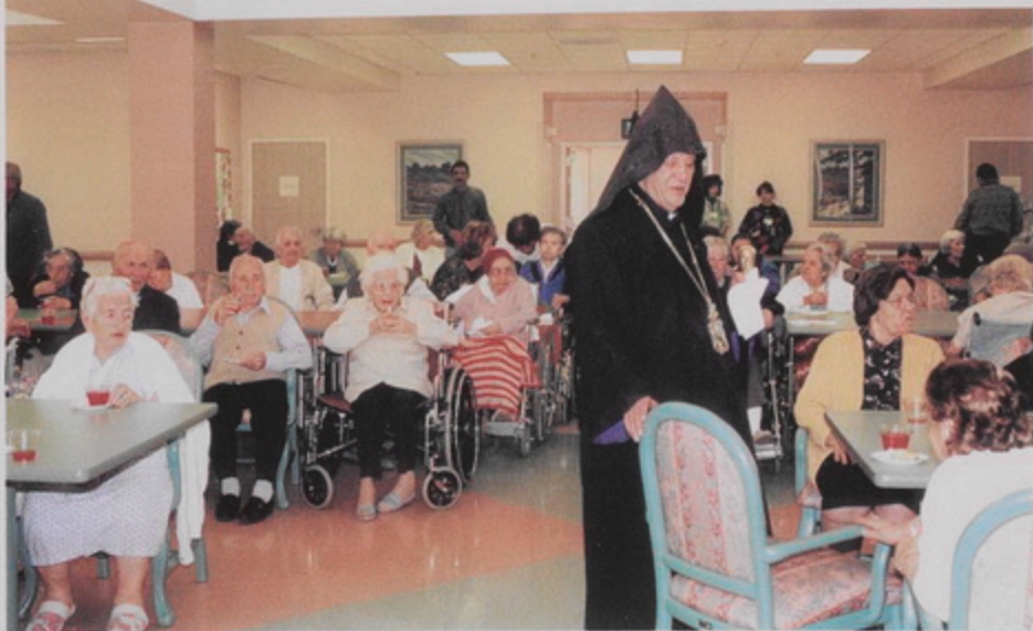
Թորգոմ Պատրիարքի այցը Լուս Ահնեկոսի Ագաթան Տունի տարեկներուն