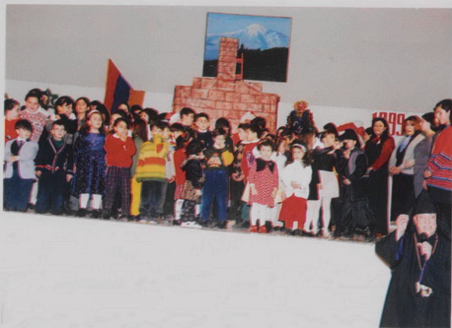
Ինքզանկաց Վարձարանի աշակերտության Նոր Տարւան հաւաքը (12 Յնիւր. 1999)