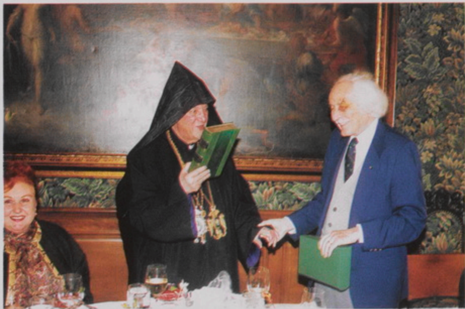
Լուս Ամենկոսի Գալիֆորնիա Գիտական մէջ Երուսաղէմի Ս. Լազարոս Ասպետական կարգի ընկերութեան Աստեղապետ Տէր. Համես Պօսն Լեւոն Ուոլշը մը կը յանձնէ Քորթոմ Պատրիարքին