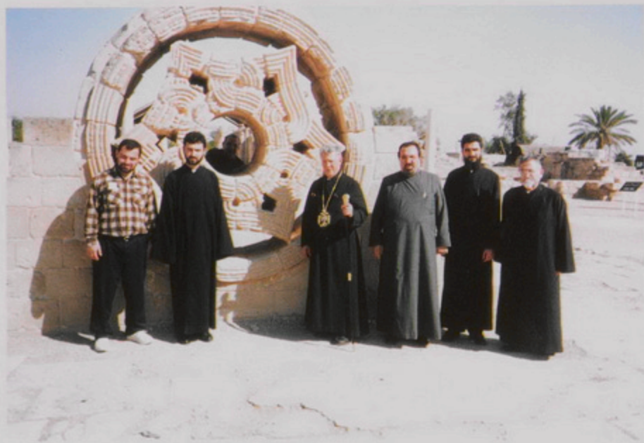
Յորդանան Դեսի եզերքը արգելիք գոտիի մէջ գտնուող վանհասցատեան հողին այցէն յետոյ, շրջապատյա Երիւնդի Հիշատակատեան տեսարժան վայրերի եւ Միաբանական ճաշ, 22 Փետր. 1999