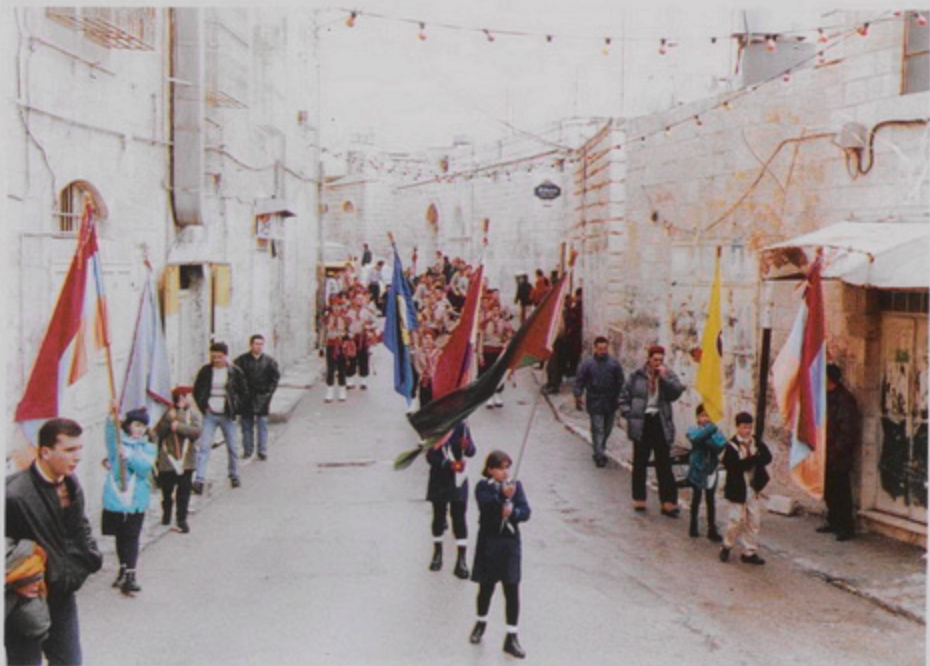
Հայկական Մնուկ դեպի Բերդիստ, 18 Յնվր. 1999. Հայ Երիտասարդաց Միության սկաուտները կ'առաջնորդեն բախորը Բերդիստի մուտքը դեպի հրապարակը