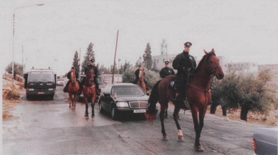
Հայկական Մեծնոց դեպի Բերդիեւ, 18 Յնվր. 1999, Իսրայելեան ինկոգիտներ Պատրիարք Արքայանի ինժեներապետին ուստ րափօրը կ'աւազ Եւ. Եղի Ա.Ր.Ա.Ր.Ք.Ձ. ղեկավար գերեզմանը