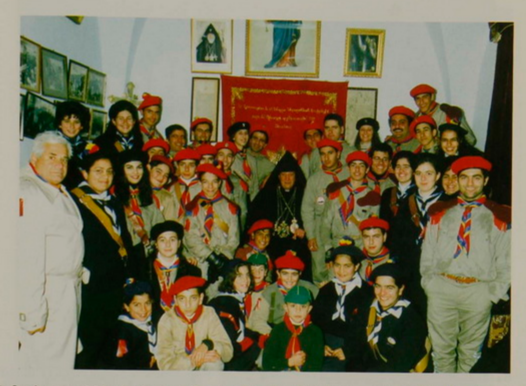
18 Յունուար 1996, Հայկական Ս. Ծնունդ, Բեթղեհէմի Հայոց Վանքին մէջ, Պատրիարք Սրրազանին հետ, Հ.Ե.Մ.ի Սքաուտներ, Արենուշներ եւ Գայլիկներ