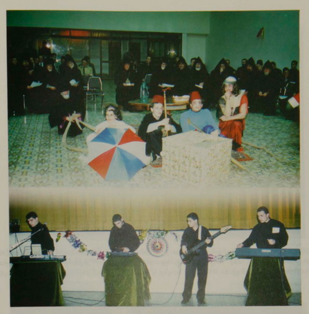
13 Յունուար 1996.- Կաղանդի գիշերուան յայտագրին մէջ ժառանգաւորացի նուագախումբը