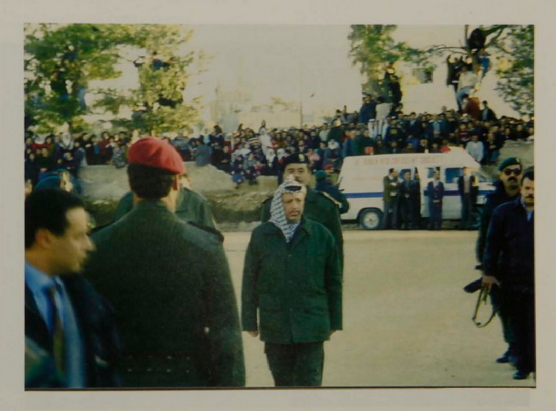
23 Դեկտ․ 1995, Պաղեստինեան Իշխանութեան Նախագահ Եասըր Արաֆաթի առաջին այցը Բեթղեհէմ