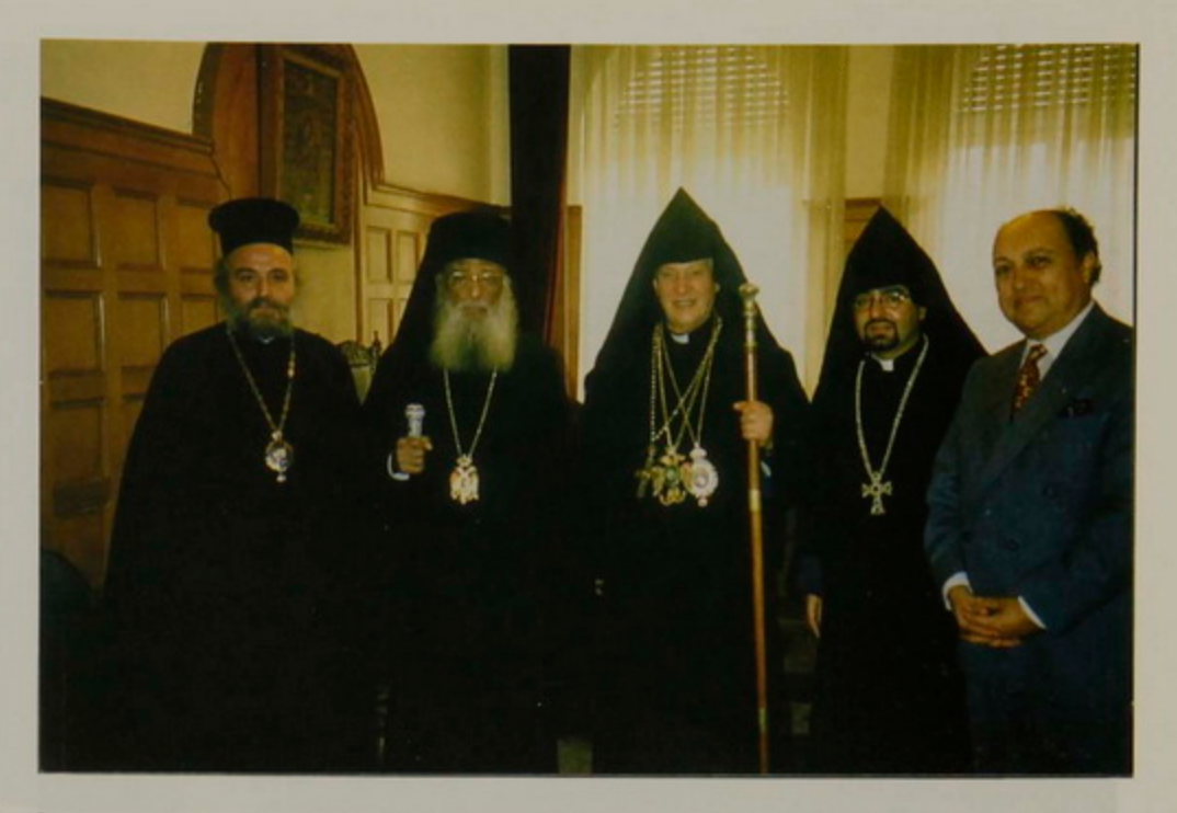
19 Դեկտ. 1995, Աթէնք, Թորգոմ Պատրիարք կ'այցելէ համայն Յունաստանի քահանայապետ Տ. Սերաֆիմ Արքեպս.ին