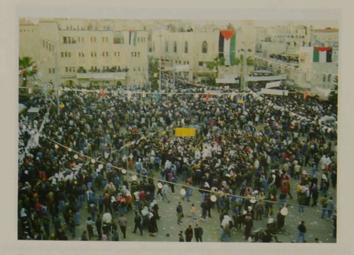
23 Դեկտ. 1995, Բեթղեհէմի հրապարակին վրայ հաւաքուած բազմութիւնը, նախագահ Եասըր Արաֆաթի առաջին այցին առիթով