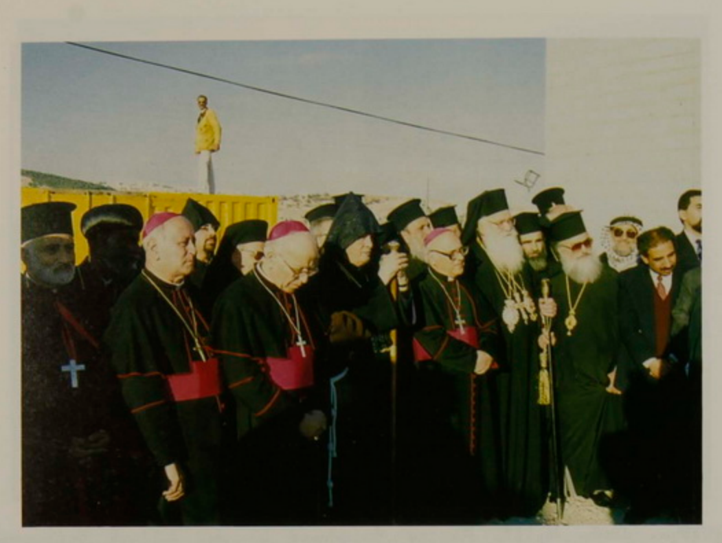
23 Դեկտ․ 1995, Հոգեւոր Պետեր կը դիմաւորեն Պաղեստինեան Իշխանութեան նախագահ Եասըր Արաֆաթի առաջին այցը Բեթղեհէմ