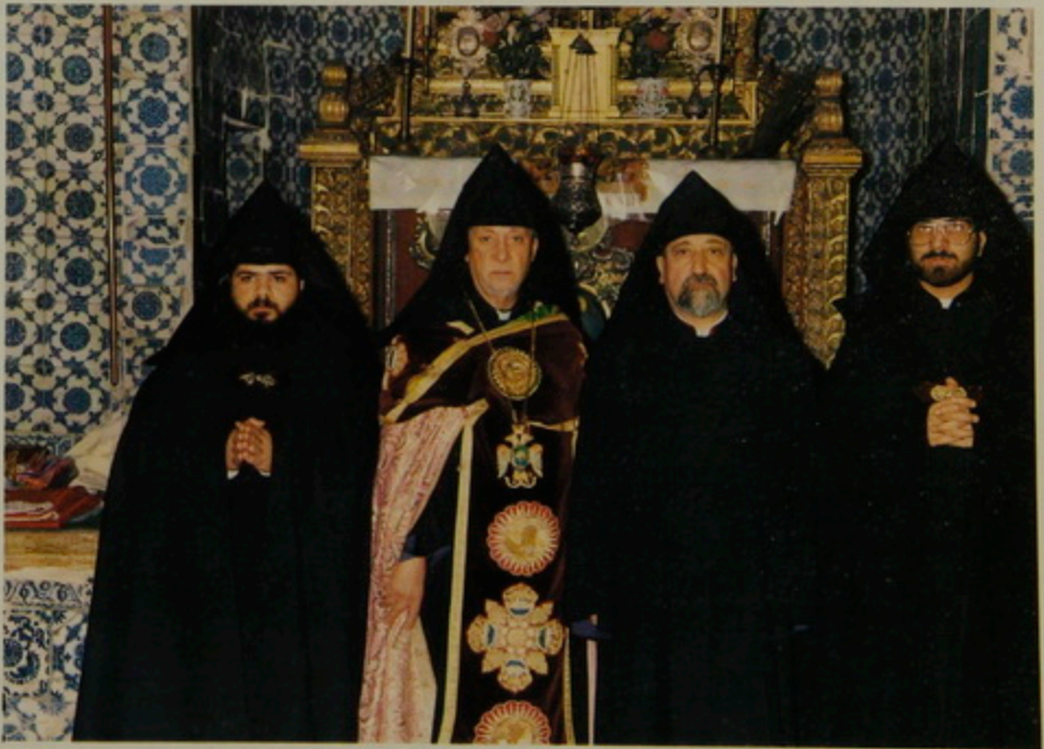
Վեղարի տրւչութիւն մօր ձեռնադրեալ երկու արեղամերու. Զախէն աջ՝ Տ. Աւետիս Աբղ. Իփրանեան, Ամեն. Ս. Պատրիարք, Լուսարարապետ Գեր. Տ. Դաւիթ Եպս. Սահակեան, Տ. Բագրատ Աբղ. Պուրմէրեան Տօմ Սրբոց Վարդամանաց, 14 Փետր. 1991