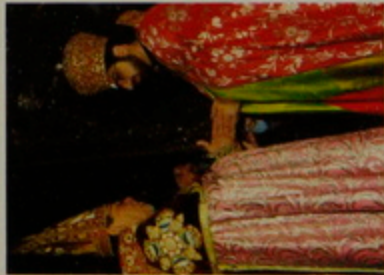
Երկու մորթման արեղամերու ձեռնադրուբներն վեց պահերը. Տ. Աւետիս Աբղ. Իփրամեան եւ Տ. Բագրատ Աբղ. Պուրմէքեան Տօն Սրբոց Վարդանանց, 14 Փետր. 1991