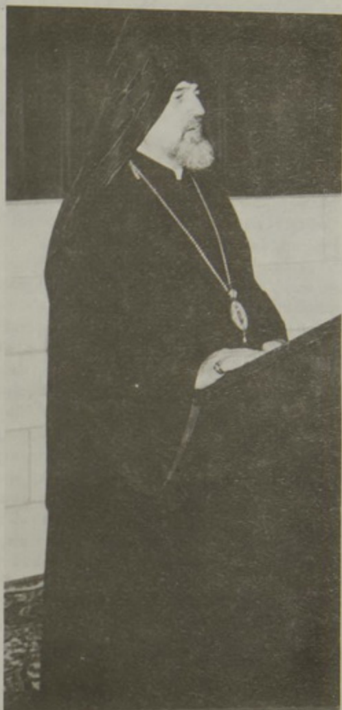
Յորեղեար Պատրիարքի Բացման Խօսքը կ'ընէ Գերշ. Տ. Շահէ Արք. Աթեմեան

Զաքարիա Պատրիարքի մասին իմձմէ խմորուած է մերկայացմել ամոր կեանքը եւ գոր- ծերը: Ասկէ մօտաւորապէս 15 օրեր առաջ, երբ որ իմացայ այս մասին, ուզեցի պրպտել աղբիւրներ գտնելու համար տեղեկութիւն ամոր մասին: Դժբախտաբար, այս շատ կարեւոր Պատրիարքի մասին, գտնէ իմ կատարած պրպտումներէս յայտնի եղաւ որ դժուար է տել տե- ղեկութիւն գտնել մէկէ աւելի աղբիւրներու մէջ: Կ'երելի աղբիւրներու կարեւորագոյնը Սաւալանեանի հատորն է, գոր միայն այստեղ կրցայ ձեռք անցնել, իսկ միւս կարեւոր աղ- բիւրը Օրմանեան Պատրիարքի Ազգապատում գիրքն է: Անշուշտ որ Օրմանեան Պատրիարք ամբողջ Հայ Եկեղեցւոյ պատմութիւնը մերկայացնելու իր մտադրութեան մէջ, շատ մեծ ուշադրութիւն եւ կարեւորութիւն չէ տուած, այսպէս ասաց, միջանկեալ դէպքերու, որոնք ազգային ամենէն կարեւոր հարցերը չէին իրեն համար: Այս մախարանիս պատճառն այն է