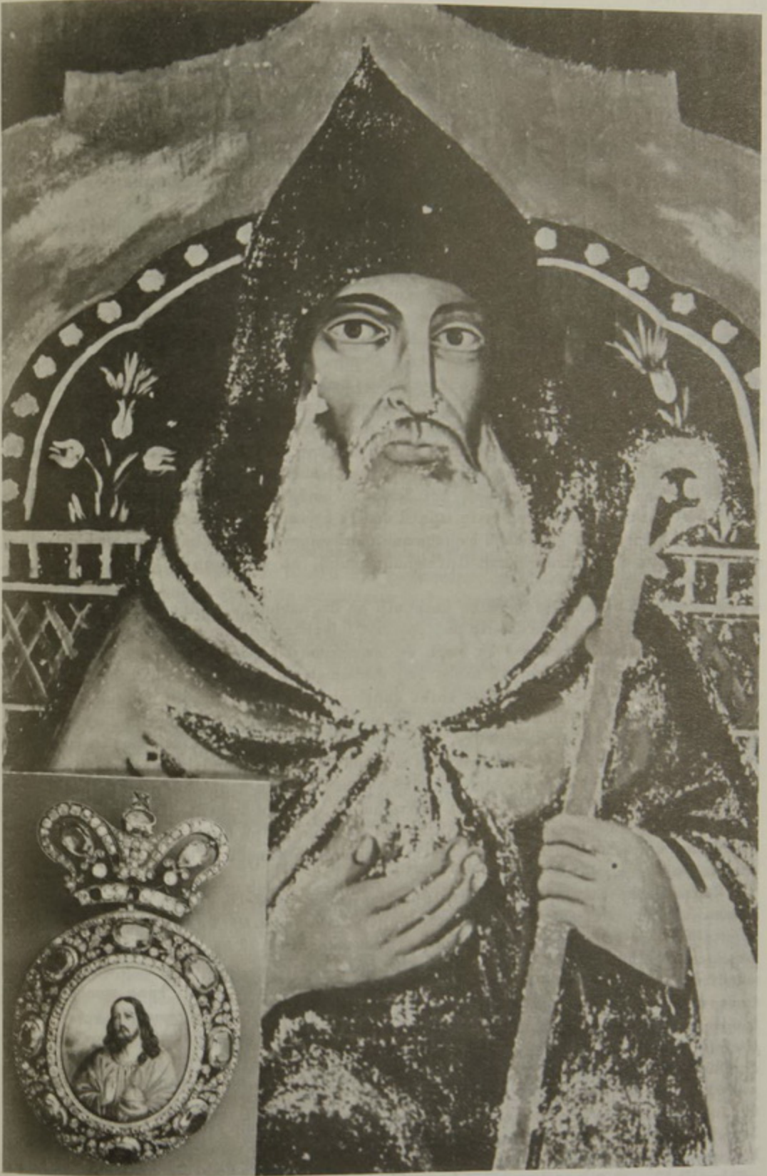
Ս. ԱԹՈՒՈՅՍ ՀԱՆԳՈՒՑԵԱԼ ՊԱՏՐԻԱՐԺ Տ. ԶԱԲԱՐԻԱ Բ. ԿՈՐԵՑԻ