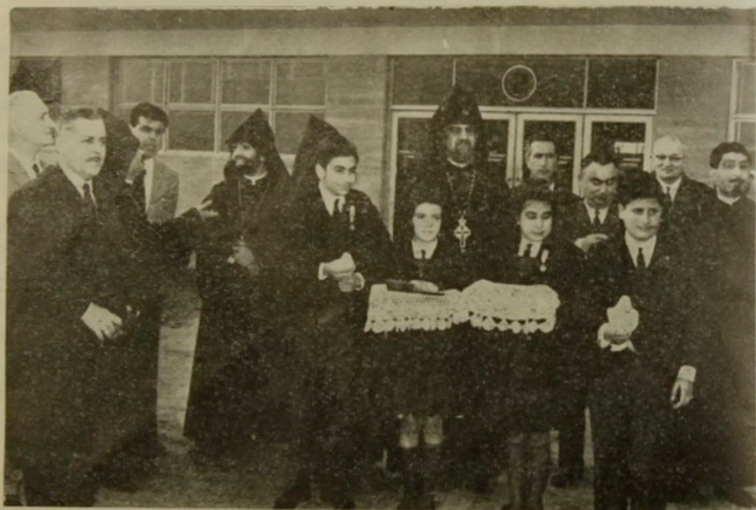
Կեդրոնական Վարչական Խորհուրդի անդամներ և Եկեղեցական դասը օղակայանին մէջ, օրհնելի աւանդական աղ ու հացով:

Առաջնորդանիստ Ս. Գրիգոր Լուսաւորիչ Մայր Եկեղեցին: