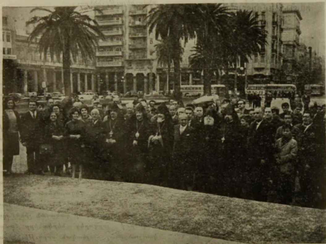
Պսակի զետեղում և յարգանք Ուրուկուայի Անկախութեան Յուշարձանին առջեւ:

Ինձի հետ միասին աւելի քան երկու ժամեր ներկայ եղաք մտքի և հոգիի այն տողանցքին, որ Արսլանեան Ազգային Վարժարանը այս բեմին վրայ բերաւ, արտայայտելով ինքզինքը իր արտասանութիւններով, երգերով, պարերով և տրամախօսութիւնով: