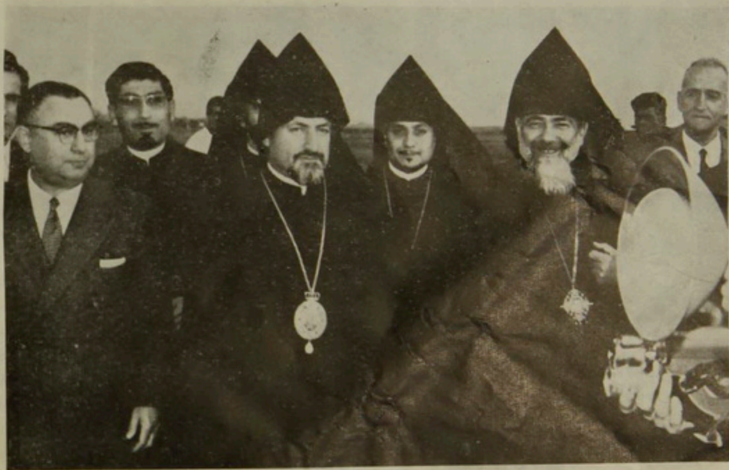
Ն. Ամենապատուութիւն Պատրիարք Սրբազան Հայրը Արժանթինի հողին վրայ, Հարաւային Ամերիկայի Կաթոլիկոսական Պատուիրակ Գերշ. Տ. Բարգէն Արքեպս. Ապատեանի հետ:

թղթակիցներու հետաքրքրութիւնը կը կեդրոնանար գլխաւորաբար Ն. Սրբութիւն Պօղոս Զ. Պապի Երեսօպօզէմ այցելութեան և քրիստոնեայ եկեղեցիներու փոխարարութեան վրայ: Պուէնոս Այրէսի գլխաւոր թերթերը՝ «Լա Նասիօն», «Լա Բենցա», «Դյարին», «Էլ Մունտօ», Ն. Ամենապատուութեան յայտարարութիւններէն ընդդէմ-ցին քրիստոնեայ եկեղեցիներու մերձեցման, զործակցութեան և բաղձալի վերամիացման տոնչութեամբ արտայայտած լատենտութիւնը: Պատրիարք Սրբազանը ըսաւ ի միջի այլոց. «Սմբողջ խնդիրը հասկացողութեան հարց է. կարեւորը այն է որ այժմ բոլոր եկեղեցիները միութիւն կը ցանկան: