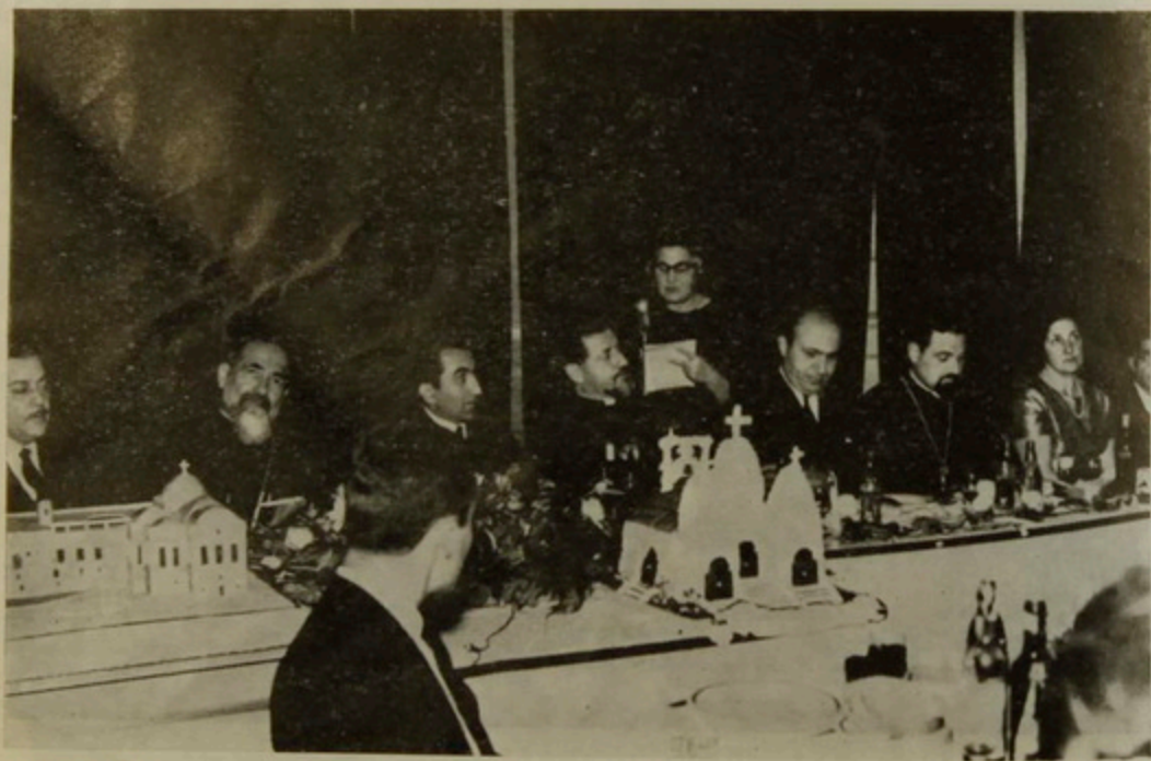
«Հայ Կեդրոն»ի Սրահին մէջ ի պատիւ Ն. Ամենապատուութեան սարքուած ճաշկերոյթի պատուոյ սեղանը:

ւոյ Հոգաբարձութեան Կեդրոնական վարչական Խորհուրդի և Արժանքինի Հայ համայնքին կողմէ մեծ հաճոյքով կու գտնուէր Ձեզի բարի գալուստ մաղթելու: Կը յուսամք որ Ձեր հովուական այս բարեբաստիկ և օրհնարքայ այցելութեամբ, մօտէն պիտի ծանօթանաք մեր հայրենասէր և ջերմեռանդ գաղութին, որուն անդամները կը բաղկանան գրեթէ քրփական երազանէն մագալուրծ բեկորներէ, որոնք եկած են իրենց օճախները վերաշինելու Հարաւ. Ամերիկայի այս բարի և եւրասէր երկնակամարին տակ՝ միշտ կառչած մնալով իրենց եկեղեցական և ազգային սրբութիւններուն: