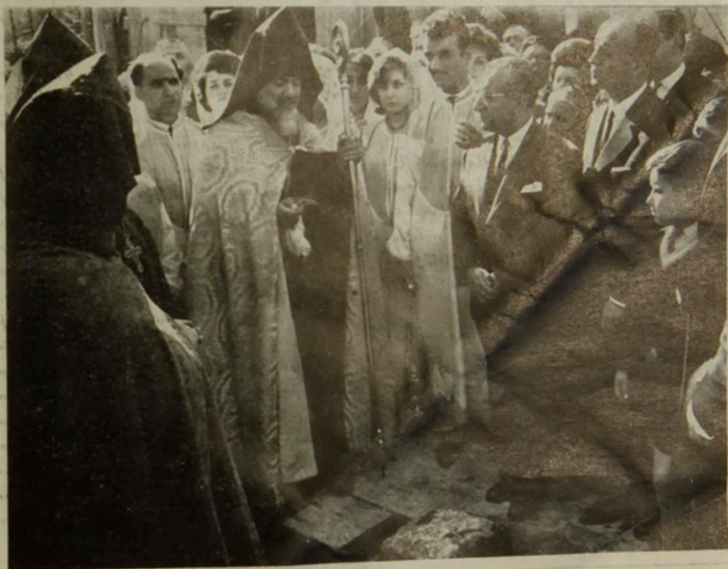
Ն. Ամնապատուութիւնը կը կատարէ Մոնթփիլտէնի հայկական մօր եկեղեցիի հիմնարկէի արարողութիւնը:

Արտասահմանի մէջ, ամէն Հայ դպրոց Հայաստանէն բերուած ափ մը հող է: Մենք այդ հողին վրայ կենալով միայն կը գի-