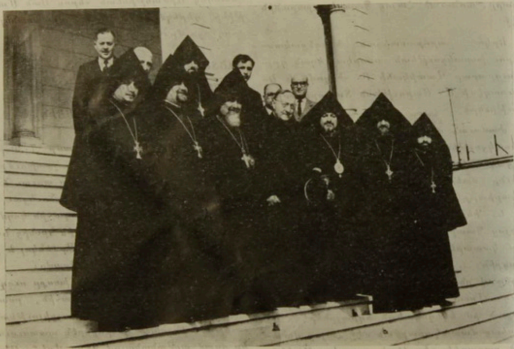
Ն. Գ. Կարտինալ Գանիանօ՝ Ն. Ամենապատուութեան, Եկեղեցական դասին և Կեդր. վարչութեան անդամներուն հետ, Ս. Գրիգոր Լուսաւորիչ մայր Եկեղեցիին մուտքին։

Կէս ժամ տևող այցելութեան ընթաց- քին, խօսակցութիւնը շարունակուեցաւ հա-