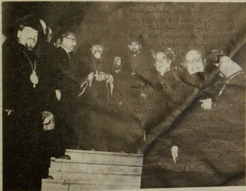
Ն. Ամենապատուութիւնը, շրջապատուած հայ եկեղեցականներէ և այլ յարանուանութիւններու ներկայացուցիչներէ, Սան Բաւլոյի օդակայանին մէջ:

Նոյն օրը, Կ. Վ. ժամը 4-ին, Պատրիարք Սրբազանը պաշտօնական այցելութիւն մը տուաւ Սան Բաւլօ քաղաքի Կառավարչին՝ Ն. Վահմութիւն Ատեմար Տէ. Պարբօսի,