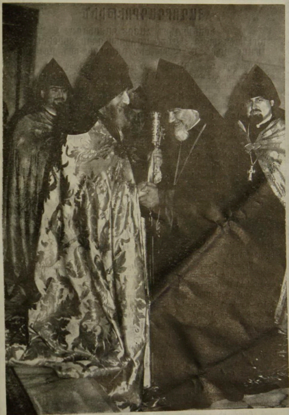
Ն. Ս. Օ. Տ. Տ. Վազգեն Ա. Վեհափառ Կարողիկոսի Գանակալութեան Տարեդարձին, Ն. Ամենապատուութիւնը կը մերկայացնէ իր քերմ շնորհաւորութիւնները Սուրբ Օծութեան: