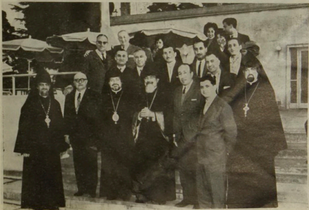
Ն. Ամենապատուութիւնը Պուէնոս Այրէսի Հ. Մ. Ը. Միութեան վարչական կազմին հետ:

Յուլիս 20-21, Երկուշաբթի-Երեքշաբթի, Պատրիարք Արքագան Հօր բարի գալուտի աշխույթեան եկան Հայ թէ օտար կողմակերպութիւններու վարչութիւնները, որոնց մէջ նաեւ Արար Մշակութային Միութեան ներկայացուցիչները: