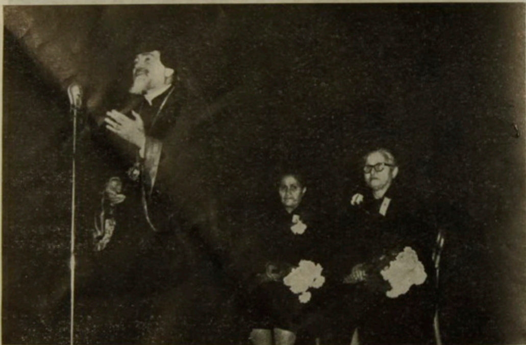
Ն. Ամենապատուութիւնը կը խօսի Մայրերու Օրումն հանդիսութեան:

Նախադահեց «Հայ Կեդրոն»ի սրահին մէջ կազմակերպուած Քսան Կախաղաններու 49-րդ. Յուշատօնի Հանդիսութեան: