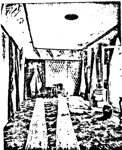
Ս. Էջմիածնի վեհաժողովի սպասման սրահը

Նուազ թիւով մը տարիներու վրայ Հանդես Ամսօրեան կ'ընէ սպասը ուիշ կարիքներու: Մեր օրերուն երկու հաստատութեանց ներսը զգալի նուազումը պարտաւոր ենք չաճեցնել աւելի անդին քան իր իսկական իմաստը: Քսաներորդ դարուն կէսին մէջ ի զօրու են նոր, ուրիշ պայմաններ, ոչ այնքան գիւրբմունքի, որքան չեն 1700ի ազիտակի հանգամանքները: Բանալ այս պայմանները, կէս այդ դարու ընթացքին մեր միտքը ինչպէս սիրտը նոր կերպարանքներու առաջագրող, պիտի նշանակէր վեր-