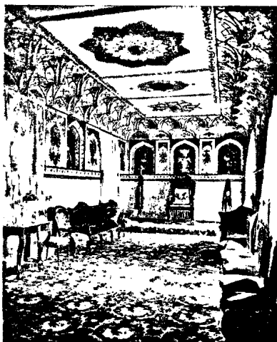
Ս. Ելմիածնի վեհաճառման ծաղկեայ դահլիճը

Ուրեմն, մօտ երկու հարիւր տարի, համեստով սկզբով ու յստակ առաջագրութիւններով սա շարժումը, որ մեզի համար