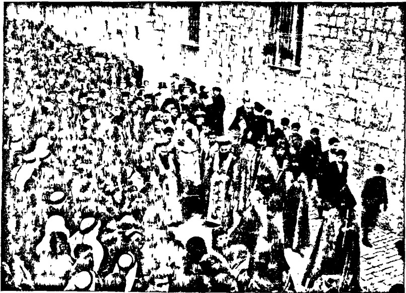
Տեսարան մը յուզարկաւորութեան քափօրէն.

Երբ բարձրասիճան հրաւիրեացնեալ, ժողովուրդը խոնուած էր Վերնասուն եւ դուրսը՝ գաւիթին մէջ: Անկողացի զինուորներ եւ հայ սկաւուսներ կը հսկէին կարգ ու կանոնի պահպանման: Հոգեւորական ներկայացուցիչներէն ոմանք դաս անցած էին, իսկ այլք հանդիսապետ Սրբազանի ետեւ տեղ բռնած էին: Կառավարական պատեօնասարներ գրաւած էին Ասեանին աջ կողմը, հիւպատոսներ՝ ձախ կողմը. դպիրներ եւ Սարկաւագներ սեւազգեստ շարուած էին Դասին մէջ բեմին առջեւ: Վարդապետք շուրջառ առած՝ ա-