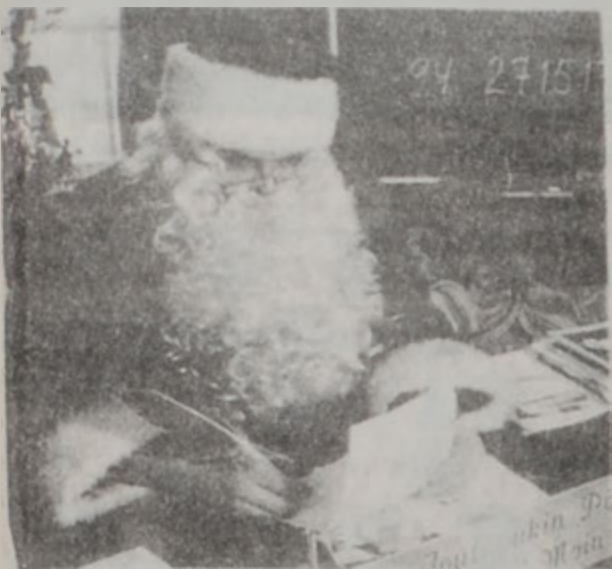
ՊԵՏՔ ԵՒ ԵՐԱԶԵԼՈՒ ԱՌԻԹՔ ՏԱՆՔ ԸՆԴՈՒՄՆԵՐՈՒՆ

Երեւանի քաղաքացիները կարիք ունենան՝ Պէտք է ձգել, որ անոնք հաւատան բարի, օրինակելի տիպարներու ինչպէս՝ Կաղանդ պապային: Այսպէսով կը զարգանայ անոնց երեւակայութիւնը: Պէտք է երեւային ձգել իրականութիւնը սուտէն զանազանիւ եւ օր մը իրականութիւնը յայտնաբերելու պահը: Երեւանի միամիտ չեն: Երբ անոնց պատմութիւն մը կը կարդանք, անոնք շատ լաւ դիտեն, թէ պատմութեան տիպարները զոյգութիւն չունին, բայց եւ այնպէս կը ձեւաւորեն հաւատալ, որովհետեւ անիկա երազելու առիթ մը կը ստեղծէ իրենց համար...: Նոյնն է պարագան կաղանդ պապային: Երեւանի քիչ թէ շատ կը կասկածին անոր գոյութեան, բայց եւ այնպէս կ'ուզեն շարունակել հաւատալ: