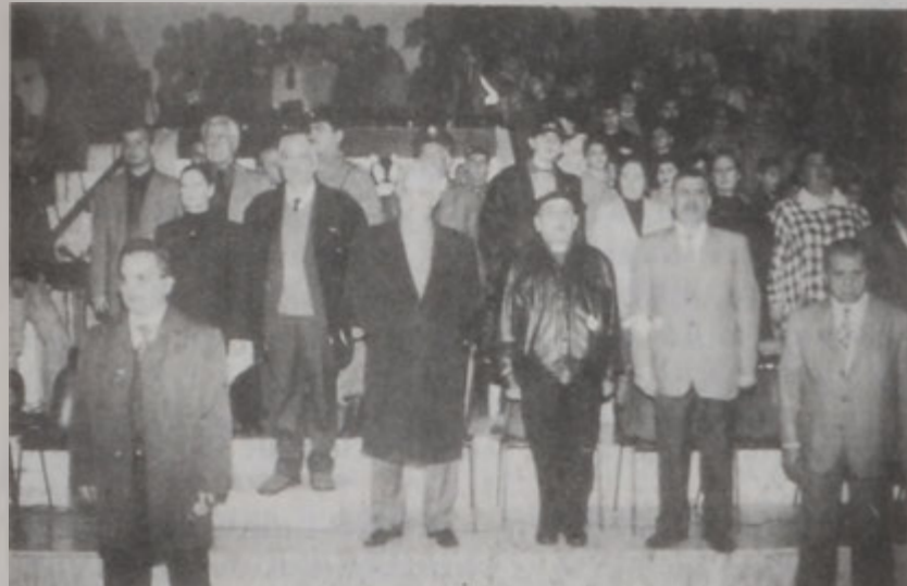
Լիբանանեան քայլերգի ունկնդրութեան պահուն: