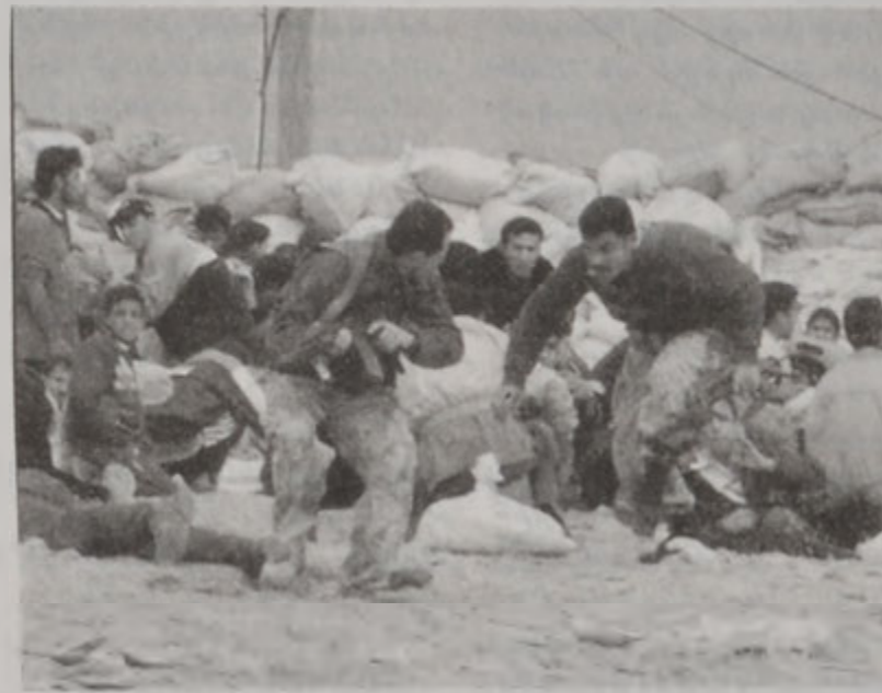
Պաղեստինցի ոստիկաններ կը փորձեն պաշտպանուիլ իսրայէլացի զինուորներու արձակած փամփուշտներէն:

Այս յորդանանի Հեպրոն քաղաքին մէջ իսրայէլեան ուժեր իր վաճառատան դիմաց սպաննեցին պաղեստինցի մը՝ փամփուշտներու տարափի մը տակ առնելով պայն, յայտնեցին ականատեսներ: Իսրայէլեան Համառ շարժումը ըսաւ, որ պաղեստինցի իր պինտալ թելին մէկ անդամ էր, եւ թէ անոր սպանութիւնը ահաբեկչութիւն է: Իսրայէլեան բանակը յայտնեց, որ քննութիւն բացած է ստուգելու համար իրականութիւնը: