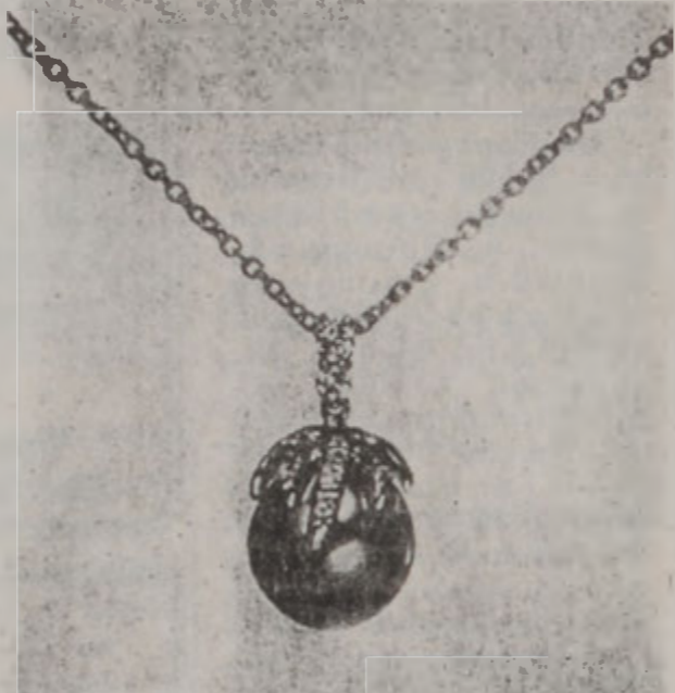
Մեծամարար նոր է, կու գայ 80ական թուականներէն, երբ մեծ գոհարավաճառ Հէրի Ուինսթըն յղացաւ սեւ մարգարիտով զարդեղէններ, որոնք մեծ ընդունելութիւն գտան:

Սեւ մարգարիտը ծանօթ է նաեւ Թահիթի մարգարիտ անունով: Հինէն ի վեր այս քարը եղած է վերանորոգուող կեանքի խոստումի խորհրդանշան, բայց նաեւ՝ իմաստութեան: Ասիական կարգ մը ժողովուրդներու համար անիկա կը խորհրդանշէ անմահութիւն: Սեւ մարգարիտը բոլոր մարգարիտներուն մէջէն կը դասուի ամէնէն որակաւորն ու փնտուածը. անոր գոյնը կը կարծաւորաբար մոխրագոյնի, սմրուկի գոյնի (օպէրիմ), կապոյտի եւ մուրի սեւի միջեւ: Սեւ մարգարիտին մշակումը Փոլիներտոյ մէջ հասած է կատարելութեան: Ամէնէն յարգիւնները կատարելագոյն գնդաձեւ են, ապա երկրորդ կարգի տեսակները՝ կատարեալ գնդաձեւ չեն եւ, վերջապէս, երրորդ տեսակը՝ պարզները: Ներկայիս մեծ գոհարավաճառները բոլոր թանկագին քարերուն մէջէն ամէնէն աւելի կը փնտուեն սեւ մարգարիտը: Այս քարին գտած յաջողութիւնը հա-