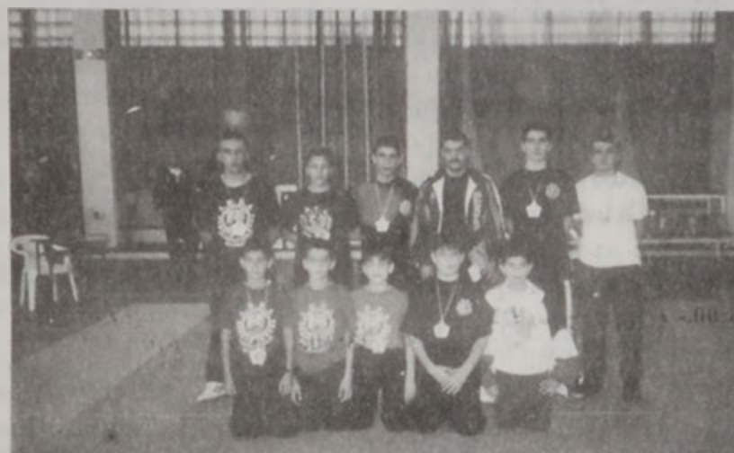
Քիւնտայի կրտսերներու կազմը:

Կիրակի, 3 Գեկտեմբեր 2000ին, Ժուլիէի «Արթուր» դպրոցի մարզադահլիւն մէջ տեղի ունեցաւ «Լիբանանի Անկախութեան» քիւնտայի կրտսերներու մրցումները, ներկայութեամբ ֆետերատիոնի պատասխանատուներուն եւ մասնակցութեամբ լիբանանեան մարզական պանպան ակումբներու: