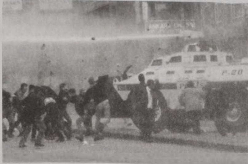
Ցուցարարներ կը քարկոծեն ոստիկանական գրահապատ մը:

Չ ախակողմեան շուրջ 250 բանտարկեալներ շարքաւորուած էին: