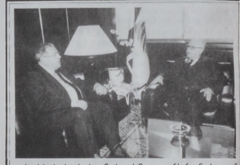
Երկ, Երեսփոխան Ժորժ Գասարճի հանդիպում մը ունեցաւ փոխ վարչապետ Իսամ Ֆարէսի հետ. անոնք քննարկեցին երկրին վերջին իրադարձութիւնները:

Երկ, հայ կաթողիկէ պատրիարքական ընդհանուր փոխանորդ Վարդան Եպ. Աշգարեան այցելեց հանրապետութեան Առաջին Տիկին Անտրէ Լախուտի եւ վայն հրաւիրեց հովանաւորելու իր նոր լոյս տեսած գիրքին շնորհահանդէսը, 26 Յունուար 2001ին, Սէն Ժոզէֆ Համալրարանին մէջ: