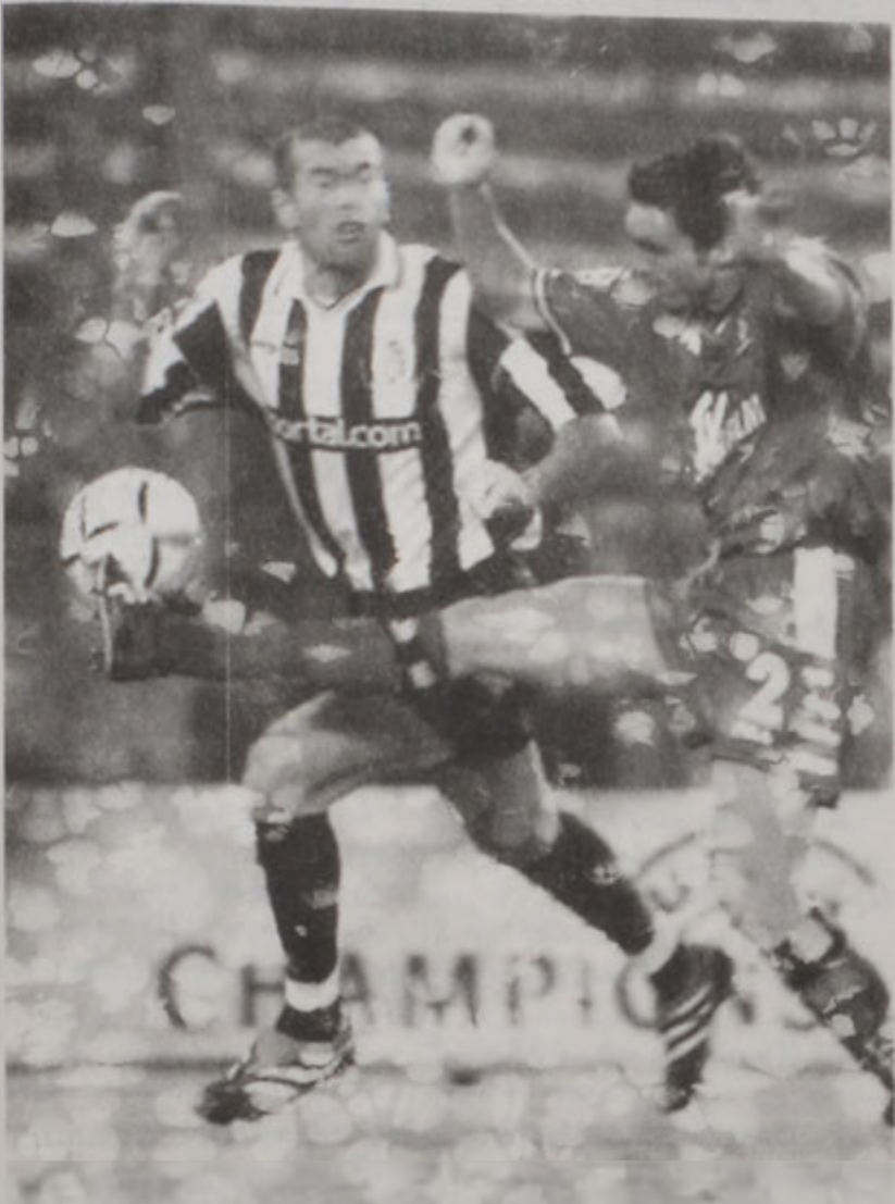
ՋԻՏԱՆԻ ՋԻՏԱՆ (ճախից), որ ՖԻՖԱԿԿ կողմէ երկ ընտրուեցաւ 2000 տարուան լաւագոյն մարզիկը:

ՁԻՏԱՆ ԸՆՏՐՈՒԵՑԱԲ 2000Ի ԱՇԽԱՐՀԻ ԼԱԲԱԳՈՅՆ ՖՈՒԹՊՈՒԽՍԸ, ԻՍԿ ՓԵԼԷ ԵՒ ՄԱՐԱՏՈՆԱ ԱՐԺԱՆԱՅԱՆ ԴԱՐՈՒ ԼԱԲԱԳՈՅՆ ՖՈՒԹՊՈՒԽՍԻ ՏԻՏՂՈՍՒՆ