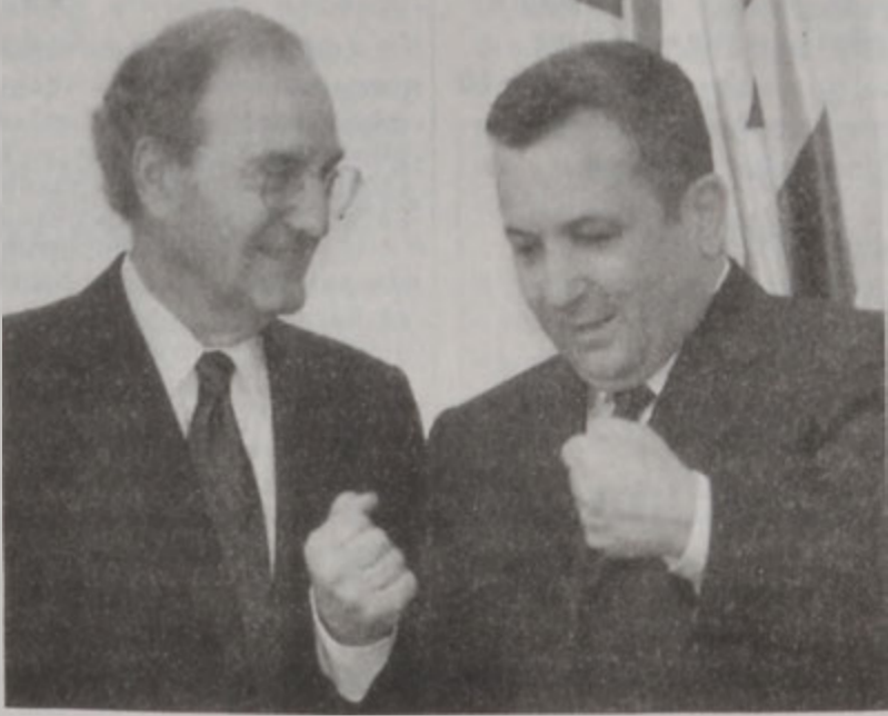
Պարաք եւ Միչըլ

Ամերիկեան առաջնորդութեամբ քննիչ մարմինը երէկ սկսաւ իր աշխատանքին, որոշուած ժամանակը պահելու համար, որոշուած էր իր աշխատանքը վերջ տալու համար արիւնահեղութեան, որ տար շաբաթէ ի վեր աւելի քան 312 կոտի եւ հազարաւոր վիրատուներ խլած է: