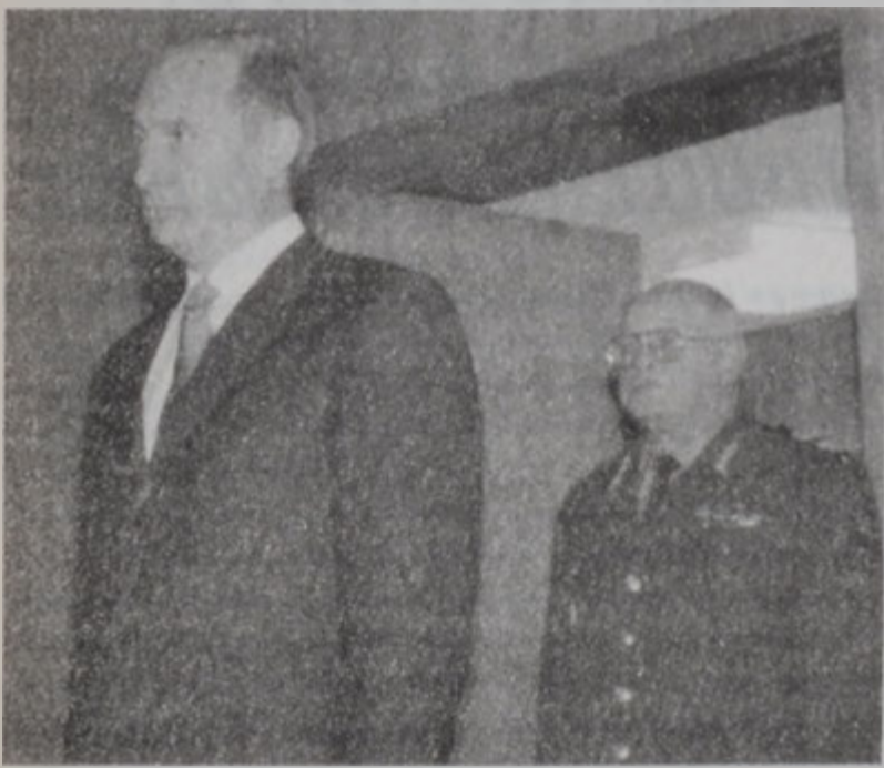
Սերկեյ քայլ պիտի պահե՞՞ Փորթինի հետ