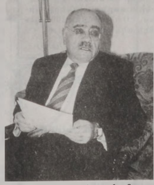
Դեսպանը խօսքի պահունգ:

Երէկ, երեկոյեան ժամը 7:00ին, Լիբանանի մէջ Հայաստանի դեսպան Արման Նաւասարդեան Հայաստանի դեսպանատան մէջ ունեցաւ հանդիպում մը լիբանանահայ հայրեր կառուցներու եւ կազմակերպութիւններուն ներկայացուցիչներուն հետ: Հանդիպումը կը նպատակադրէր պարզել Հայաստանի մէջ քրիստոնէութեան փոփոխութեան կրօն հոգակման 1700ամեակի առիթով Լիբանանի մէջ դեսպանատան ծրագրած գործունէութիւնը, ինչպէս նաեւ՝ ապահովել լիբանանահայ միութիւններուն գործակցութիւնը եւ այս առիթով սոյն հարցին շուրջ լսել անոնց առաջարկներն ու տեսակէտները: Հանդիպումին ներկայ գտնուեցան Հ. Յ. Դաշնակցութեան, Ս. Դ. Հ. Կ. Ի, ՌԱԿԻ, Համազգայինի, Հ. Մ. Ը. Մ. Ի, Հ. Բ. Ը. Մ. - Հ. Ե. Ը. Ի, Ազգային Առաջնորդարանի, Կաթողիկէ Պատրիարքարանի եւ Հայ Արուեստագէտներու Միութեան ներկայացուցիչներ: Հանդիպումին սկիզբը Արման Նաւասարդեան ներկայացուց 1700ամեակի եւ Ֆրանսախոս երկիրներու կազմակերպութեան Հայաստանի անդամակցութեան մասին վերջերս իր ունեցած հանդիպումները՝ Լիբանանի նախագահին, վարչապետին եւ նախարարներուն հետ: Ան նաեւ ներկայացուց յառաջիկայ տարուան իրագործուելիք ծրագիրներու հետեւեալ յայտագիրը: