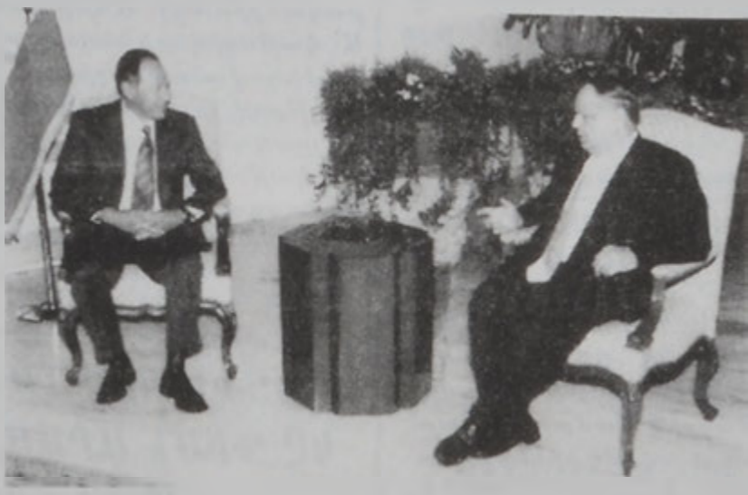
Նախագահ Լահուտ կ'ընդունի Զարաբը:

Նախագահ զօր. էմիլ ահուտ երէկ հաւաստեց, որ Լիբանանի եւ Սուրիոյ ղրաշարական կապերը յանգանուած եւ ամուրն, եւ երկու երկիրներուն եկամտաբեկեանց խորհրդակցութիւնը երբեք չէ նդհատուած. «Այս տրհրդակցութիւնը ակըն- ախ էր Գահրէի մէջ գու- 'արուած արարական ար- տակարգ վեհաժողովին, եւ այս գործելաձեւը նպաս- տաւոր է երկու երկիրնե- ուն ու ժողովուրդնե- ուն», ըսաւ ան: