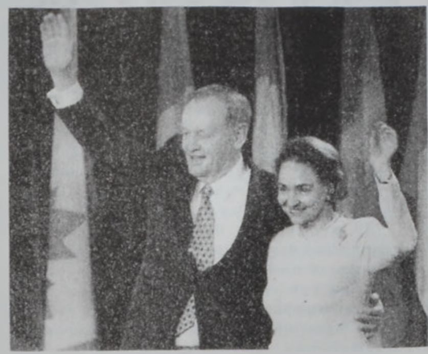
Երեթիւն ամուլը կ'ողջունէ համակիրները:

Բանատայի վարչապետ Ժան Բրեթիէն ջանքատէր մեծամասնութիւն մը ապահովեց խորհրդարանական ընտրութիւններուն, որոնք տեղի ունեցած էին Երկուշաբթի օր: Բ. Աշխարհամարտէն ի վեր ան քանատայի առաջին ղեկավարն է, որ յաղորդական երեք ընտրութիւններու մեծամասնութիւն ապահոված է խորհրդարանին մէջ եւ երեք անգամ վարչապետ դարձած: