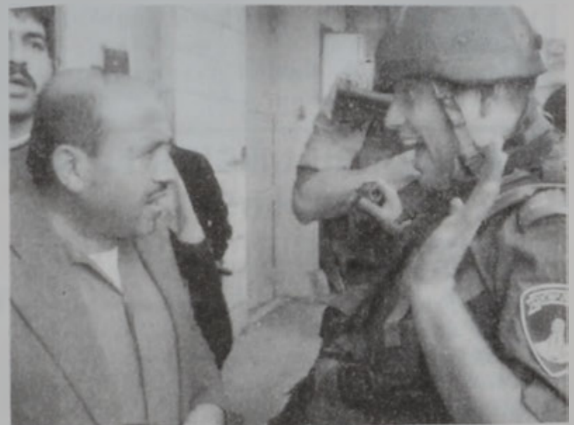
Իսրայէլացի զինուոր մը կը սպառնայ պաղեստինցիի մը՝ ձեռնառումը ցոյց տալով:

Իսրայէլացիներուն եւ պաղեստինցիներուն միջեւ բախումները վերսկսան կիրակի գիշեր, Ռամատանի նախօրեակին: Նոյն պահուն հանդիպումները տեղի ունեցան պաղեստինեան հանրային ապահովութեան պատասխանատու զօր. Ապտէլուզէք Մաթայտէի եւ իսրայէլեան բանակի հարաւային ուժերու հրամանատար զօր. Եոմ Թոմ Սամիայի միջեւ: Իսրայէլեան բանակը հաստատեց հանդիպումին լուրը, սակայն մանրամասն