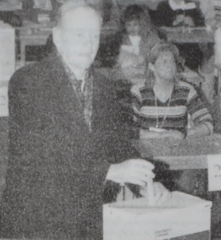
Քրեթիկ կը քուէարկէ:

ՕՐԱՎԱ, 27 (ՌՈՅԹԸՐԸ).- Քանատացիները Երկուշաբթի օր ուղղուեցան քուէարկութեան կեդրոնները ընտրելու համար իրենց նոր խորհրդարանը: Կանադիայի այս ընտրութիւններէն դժգոհ է ժողովուրդին մէկ մասը, որ հարցականի տակ կ'առնէ անոնց անհրաժեշտութիւնը, երբ վարչապետ Ժան Բրեթիէն տակաւին մէկուկէս տարի ունէր աւարտելու համար հնգամեայ նստաշրջանը: