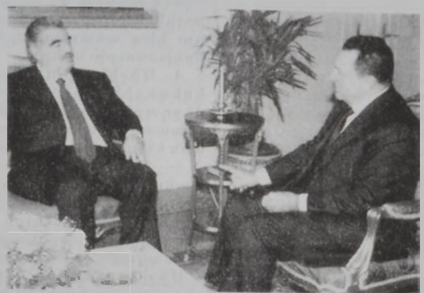
Հարիրի տեսակցեցաւ նախագահ Մուպարաբի հետ:

Վարչապետ Ռաֆիք Հարիրի Շարաթ օր այցելեց Գահիրէ, ուր տեսակցութիւններ ունեցաւ Եգիպտոսի նախագահ Հիւսնի Մուպարաբի, վարչապետ Աթէֆ Օպէյտի եւ այլ պաշտօնատարներու հետ: