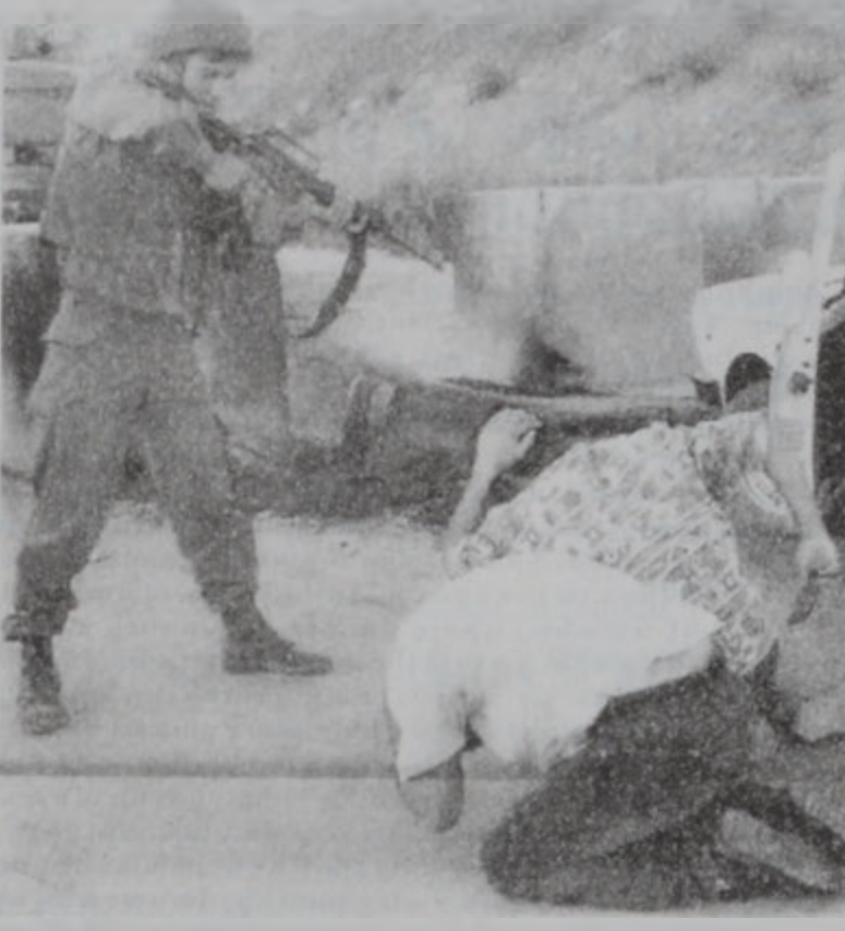
Պաղեստինցի անցորդներու Եկատմամբ անմարդկային վերաբերում: Միւս կողմէ, իսրայէլեան աղբիւրներ յայտնէ Շար.Ղ' Էջ 10

Համոզութեան իրենց մասնակցութիւնը կը բերեն հայ համայնքի բոլոր վարձարաններու միջնակարգի եւ երկրորդականի աշակերտները: ՅԱՆՕԹ. Յատուկ օթոպիւսներ պիտի տրամադրուին, ժողովուրդը փոխադրելու համար ձեռնարկին վայրը, առաւօտեան ժամը 10:30էն սկսեալ, «Ճաղոցեան» կեդրոնի կից կառուած մէջ (Պուրճ Ճամուտ, «Մասքըր Սոլ»ի դիմաց):