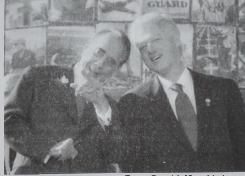
Պոլ Քլիմբըն եւ Պոպ Տոլ իմնադրութեան արարողութեան ընթացքին

Վերջերս Միացեալ Նահանգներու Փենսիլվանիա նահանգի Փայլթը Թաուն-շիփի բնակիչներէն Սարգիս Ակոբեան մէկ միլիոն տոկոսով նուիրատուութիւն կատարած է Ուշաքիկի մէջ Համաշխարհային Բ. պատերազմի Ազգային յուշակոթողի շինութեան: Յուշակոթողին շինութիւնը հովանաւորող յանձնախումբը նախագահն է 1996ին Միացեալ Նահանգներու նախագահական ընտրութեան հանրապետական թեկնածու Պոպ Տոլ, որ յայտարարած է, թէ յուշակոթողին յիշեալ նուիրատուութիւնը ցարկ հաւաքուած 90 միլիոն տոկոսին մաս կազմող մէկն է մեծ անհատական նուիրատուութիւնն է: