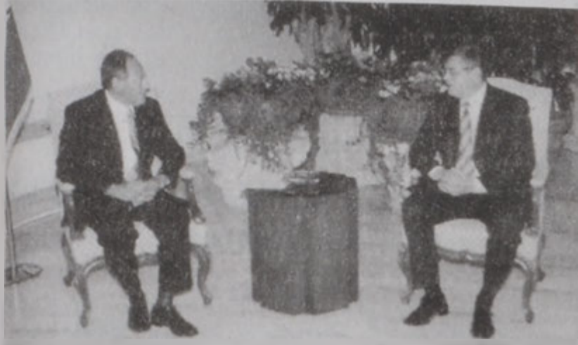
Ռուսիոյ դեսպանը այցելեց Գալստիան Լախուտի:

Ռուսիոյ նախագահ Վլադիմիր Փուտին երէկ նախագահ զօր. էմիլ Լախուտի ուղղած իր նամակին մէջ հաստատեց, որ Մոսկուա ճիշդ պիտի թափէ Միջին Արեւելքի մէջ ՄԱԿի Ապահովութեան խորհուրդի որոշումներուն վրայ հիմնուած արդար եւ ամբողջական լուծումի մը հասնելու համար: