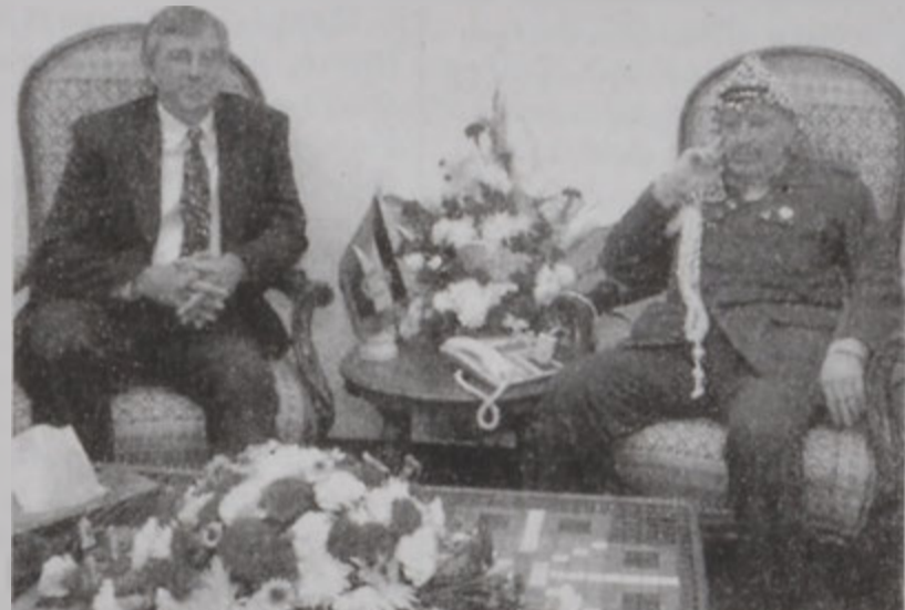
Ռոս եւ Արաֆատ

Թուրքիոյ ընդլիմադիր կուսակցութիւններ երէկ քննադատեցին Եւրոպական խորհրդարանին կողմէ Հայկական Ցեղասպանութեան վերաբերեալ որոշումին որդեգրումը: «Մենք կ'առաջարկենք բանախորհրդարանական քննադատութիւններ, որոնք նպատակ ունենան պահպանել իրաւունքները, յայտնեց իսրայէլացիները»: