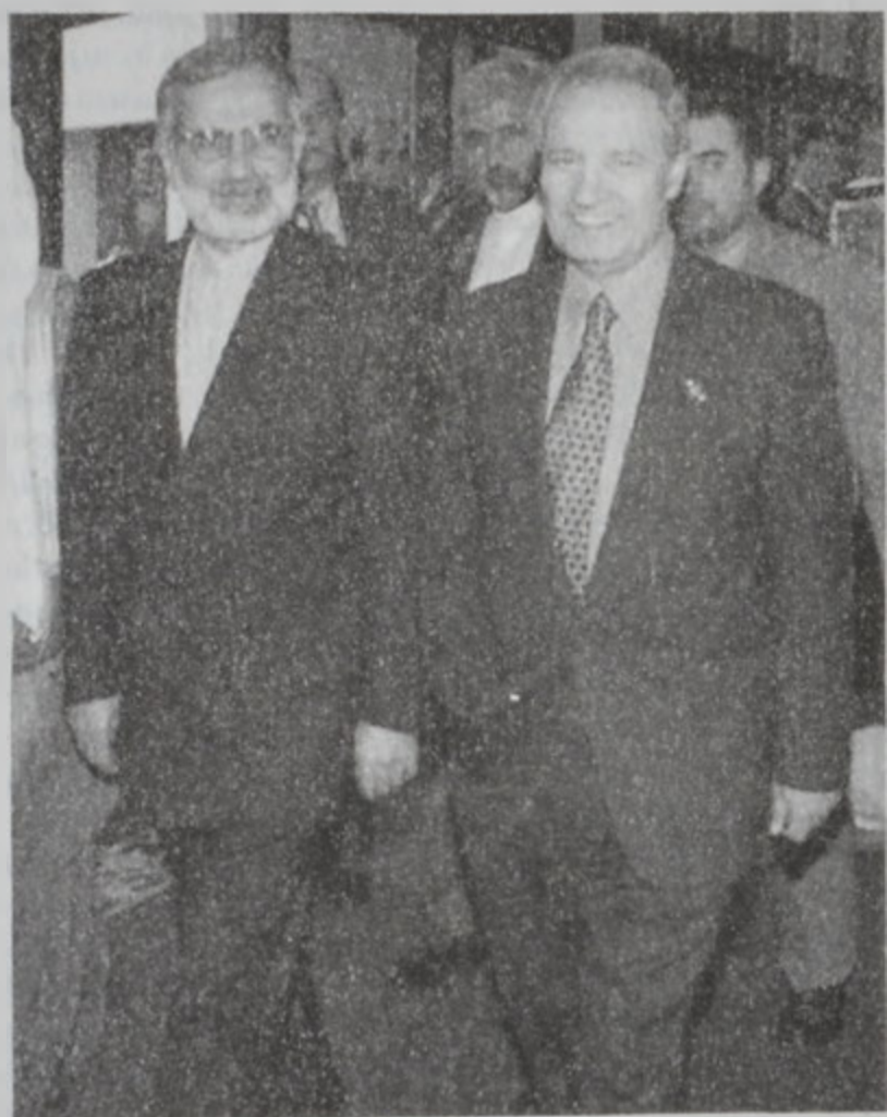
Խարազի եւ Շարեհ Տոհա կը հասնին:

Քաթար տեղի տալով արաբական ճնշում-ներուն դիմաց, երէկ փակեց Տոհայի մէջ իս-րայէլեան առեւտուրի գրասենեակը: Մէու-տական Արաբիա, Իրան եւ իսլամական ու արաբական այլ երկիրներ սպառնացած էին պոլքոթի ենթարկել Տոհայի մէջ 12-14 Նոյեմ-բերին կայանալիք Իսլամական Խորհրդաժո-ղովի Կազմակերպութեան վեհաժողովը, եթէ Քաթար չխլի Իսրայէլի հետ կապերը: