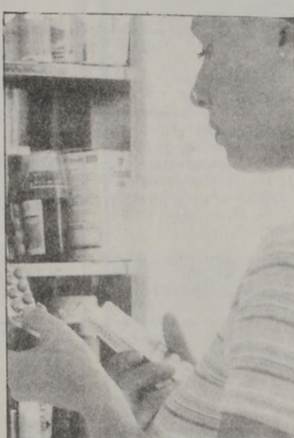
Ինքնադարձանում՝ այո՛, բայց...

● Բացատրողագիրքին վրայ նշուած քանակը երբեք չանցնելու՝ աւելի արագ առողջանալու նպատակով: Այսպէս, զլիտե ցաւ մը, որ չանցնիր, կրնայ իր ետին պահել այլ պատճառներ, ինչպէս՝ սիմիւլցիոյ կամ արեան գերճնշում... ● Նախապէս գնուած դեղի մը մնա-