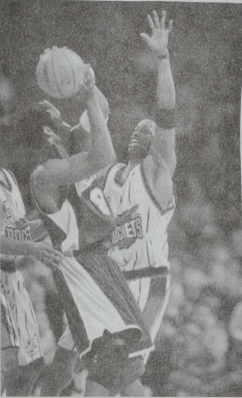
Զոպէ Պրայնթ «կը խաբէ» մրցակիցները: