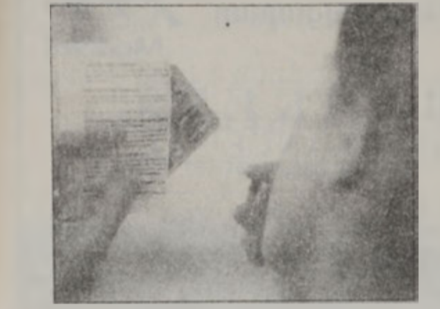
Լաւ կարդալ բացատրողագիրք

● Եթէ արդէն իսկ քրոնիք հիւանդու-թեան մը համար դեղահատ կը գործա-