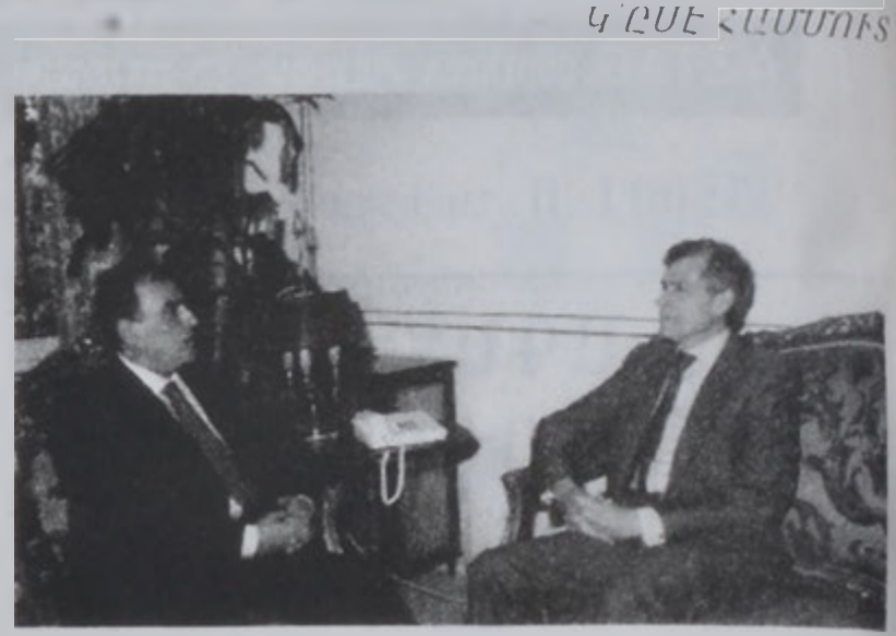
Համմուտ Կ'ընդունի Մաքլիքընը:

Արտաքին գործոց նախարար Մահմուտ Համմուտ երէկ յայտարարեց, թէ հանրապետութեան նախագահ Կոր. Էմիլ Լահուտի պահանջով ՄԱԿի մէջ Լիբանանի դեսպան Սալիմ Թատուրիին պահանջած է ՄԱԿի ընդհանուր քարտուղար Քոֆի Անանի եւ Ապահովութեան խորհուրդին փոխանցել իսրայէլեան օդուծին Լիբանանի դէմ ռազմականներուն հարցը, որ Լիբանանի գերիշխանութեան եւ ՄԱԿի թիւ 425 որոշումի խախտումներ են: