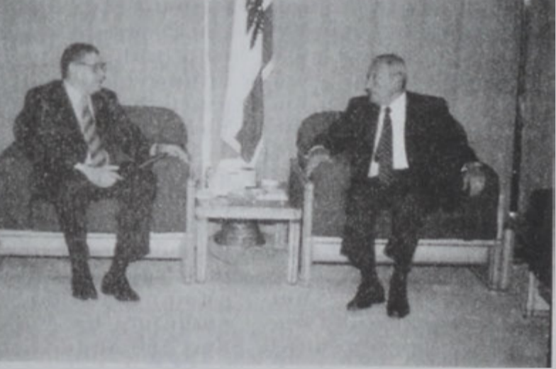
Պըրրի Կ'ընդունի Ռուսիոյ դեսպանը:

Խորհրդարանի նախագահ Նեպիի Պըրրի երէկ ընդունեց Ռուսիոյ դեսպան Պորիս Պոլոթնիկը, որ յայտարարեց, թէ անոր փոխանցած է Տումայի նախագահ Կենատի Սելեպինին Նամակ մը, որ կը շնորհակտը Պըրրիի վերջնականութիւնը, մարտիկները երկու երկիրներու խորհրդարանական յարաբերութիւնները: Ան նաեւ փոխանցեց Ռուսիոյ դաշնակցային խորհուրդի նախագահ Իվոյ Ս. Թրոյեւին շնորհագրական նամակ մը, որուն մէջ կը հստատուէ, թէ ռուս խորհրդարանականները մեծ կարելորութիւն կ'ընծայեն Միջին Արեւելքի մէջ արդար եւ վերջնական խաղաղութեան հաստատումին, որ պէտք է հիմնուի Ապահովութեան խորհուրդի որոշումներուն եւ «խաղաղութեան փոխարէն հող» սկզբունքին վրայ: