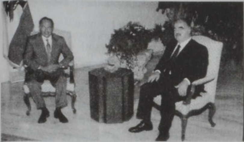
Նախագահ Լահուտ կ'ընդունի Հարիրին:

Հանրապետութեան նախագահ Վոր. Էմիլ Լահուտ երկ Գաղափարային պալատին մէջ ընդունեց վարչապետ Ռաֆիք Հարիրին եւ անոր հետ քննարկեց ընդհանուր վարչապետութեան խորհրդարանի վստահութեան քուէին եւ այդ նիստերուն ընթացքին յայտարարուած երեսփոխաններու կեցուածքները, ինչպէս նաեւ Լիբանանի դէմ իրականացուած վերջին ռազմագործիւններն ու այս հարցին ՄԱԿի մէջ արծարծումը: Նախագահը եւ վարչապետը քննարկեցին նաեւ կառավարութեան այսօրուան նիստին օրակարգերը եւ Տոհայի մէջ գումարուելիք իսլամական գերաստիճանին արծարծուելիք հարցերն ու Լիբանանի ներկայացուցիչք առաջարկները: