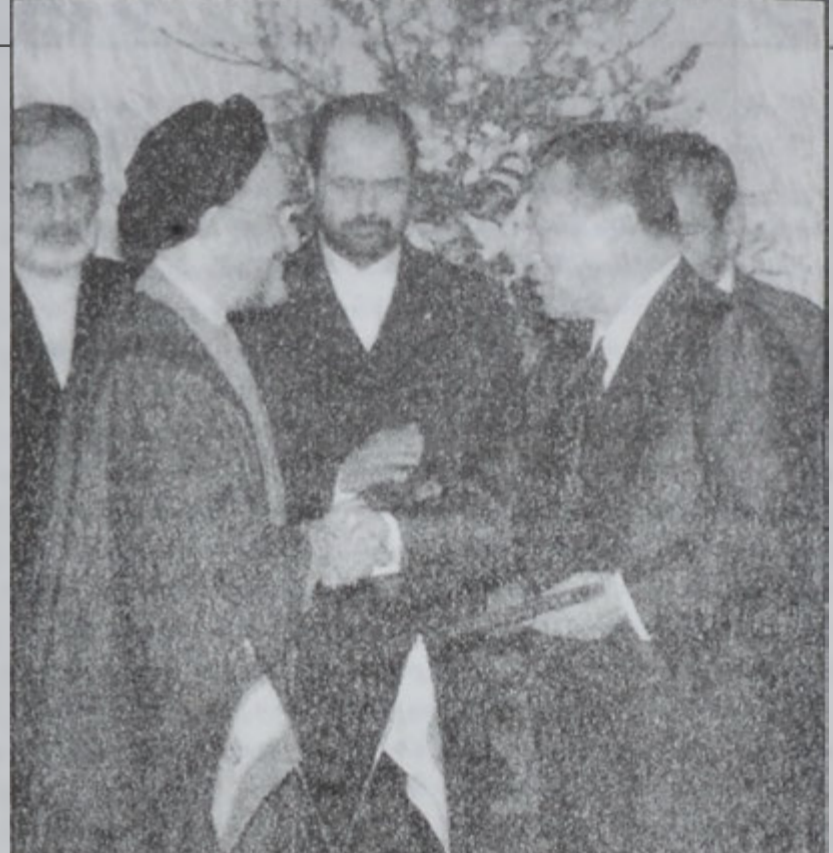
Նախագահ Խաթեմի եւ վարչապետ Սորի ուսուցիչի մարզին մէջ գործակցութեան համաձայնագիրին կնքումէն ետք

Ուաշինկթըն դեռ միջոցառումներ պիտի դիմէ Իրանի հետ համաձայնութիւններ կնքած կարգ մը օտար ընկերութիւններու դէմ, ինչպէս՝ Էնի, Թոթալ Ֆին Էլֆ եւ Շէլ: Այս ընկերութիւններուն կողքին Լամսօ եւ Պի Փի