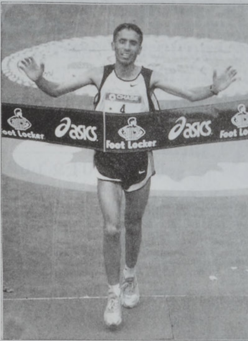
Ապտէլբատեր կը հասնի ժամանան գիծ: ֆա (երովպիա) 13' 16" ուշ, 3.- Մարկարէթ Օքսնիզ (Քենիա) 26' 36" ուշ, 4.- Հեյն Քիմուլայ (Քենիա) 26' 42" ուշ, 5.- Ֆլորանս Պարսոնս (Քենիա) 27' 00" ուշ