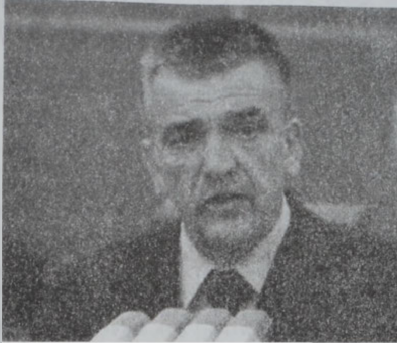
Վարչապետ Չորան Չինյիչ

«Շատ դժուար աշխատանք ունիք կատարելիք», ըսած է Չինյիչ, որ նաեւ խոստացած է շուկայի արեւելումով բարեկարգումներ հաստատել եւ Եուկոսլաւոյ օրէնսդրութիւնը Ե. Միութեան օրէնսդրութեան չափանիշներուն հասցնել՝ ի վերջոյ պոլիթոնի անդամակցելու առաջադրութեամբ: