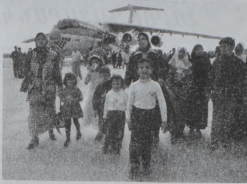
Իրաքցիներ Պաղտատէն Պաքա հասած են առաջին թիջքով:

Իրաքի մէջ երէկ վերական ներքին թիջքները հիւսիսային եւ հարաւային «արգիլեալ գօտի»ներուն մէջ: Իրաքի այս քայլը յաւելեալ փորձ մըն է բօթափելու համար Արեւմուտքին կողմէ հաստատուած պատժամիջոցները: