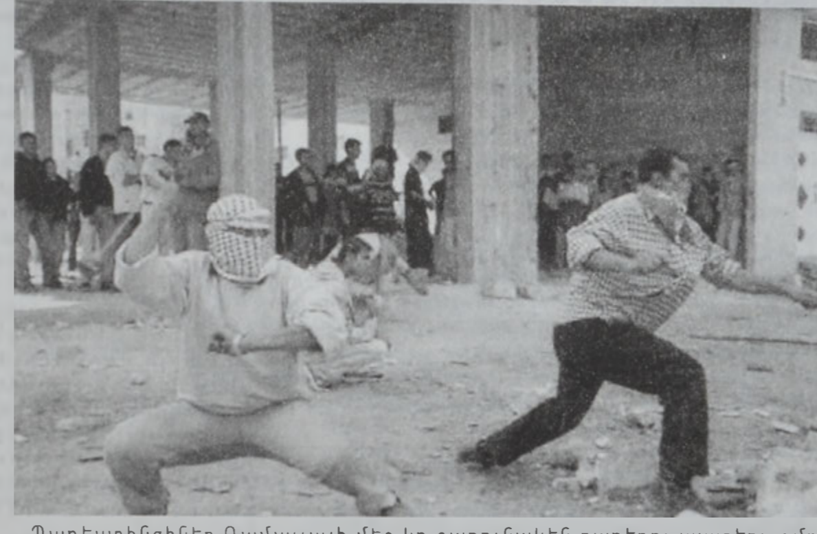
Պաղեստինցիներ Ռամալլայի մէջ կը շարունակեն քարերու պատերազմը:

Միջին Արեւելքի խաղաղութեան յոյսերը, որոնք գրեթէ չբացած էին անցնող շաբաթներուն, երէկ վերստին թափ ստացան եւ գործացան, երբ պաղեստինեան իշխանութեան նախագահ Եսէր Արաֆատ ընդառնեց Միացեալ Նահանգներու նախագահ Պիլ Քլինթոնի Ուաշինկթընի այցելութեան հրահրումը: Արաֆատի խորհրդատու Նապիլ Ապու Ռուսայնա յայտնեց, որ պաղեստինցի ինքզինութեան գործընթացին եւ պաղեստինցիներուն դէմ շարունակուող իրարայնեան բռնարարքներուն: