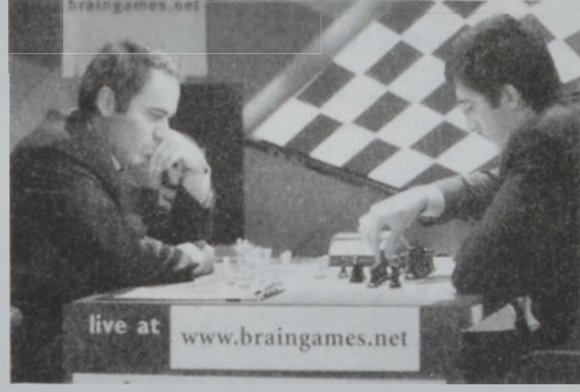
Գասպարով (ձախին) - Զրամնիք երեկուան մրցումէն տեսարան մը:

Մանթիք, որ այս մրցաշարքին 8,5 կէտ ապահովողը (16 հանդիպումներու ընթացքին) պիտի շահէր աշխարհի ախոյեանի տիտղոսը (որ սակայն ՖիՏԻ կողմէ չի ճանչցուիր), ինչպէս նաեւ մեծ պարգեւ մը՝ 2 միլիոն սոլար: 37 տարեկան Գասպարով ոչ մէկ յաղթանակ կրցաւ տանել 25 տարեկան