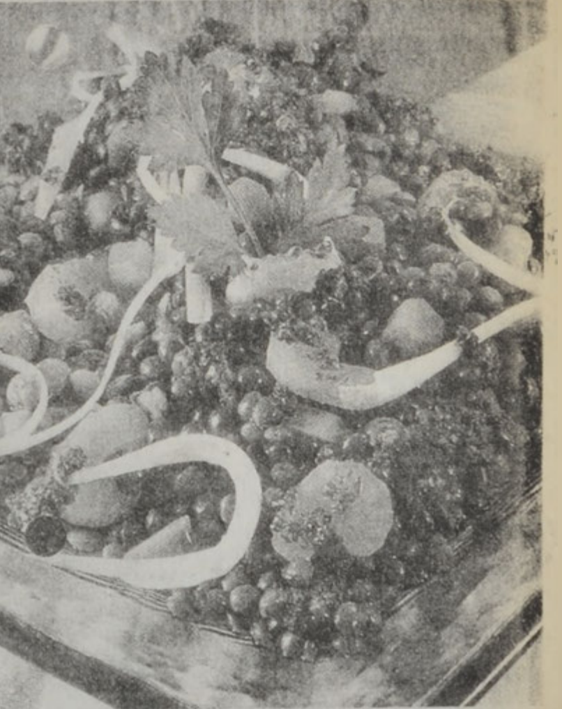
Հրամցնել գաղջ վիճակի մէջ: Բարի ախորժակ:

Ոսպը խաշել շուրջ 20 վայրկեան, մանրուած սխտորին հետ: Ապա աղել եւ 5 վայրկեան եւս եփել: Ստեպլիցները կեղուել եւ մանր խորանարդներու վերածել. իսկ կարոսը օղակաձե կտրտել եւ աղի ջուրի մէջ 2 վայրկեան եռացնել: Մանրել ազատեղը: Հրամցնել առաջ ոսպ քամոցէ անցնել. աղցանի մը կը խառնուի ձեթը եւ քաղախը, աւելցնել աղն ու սեւ համեմը, ստեպլիցն ու կարոսը եւ վերջապէս՝ տաք ոսպը: Բոլորը խառնել եւ երեսը զարդարել սոխով եւ մանրուած ազատեղով: