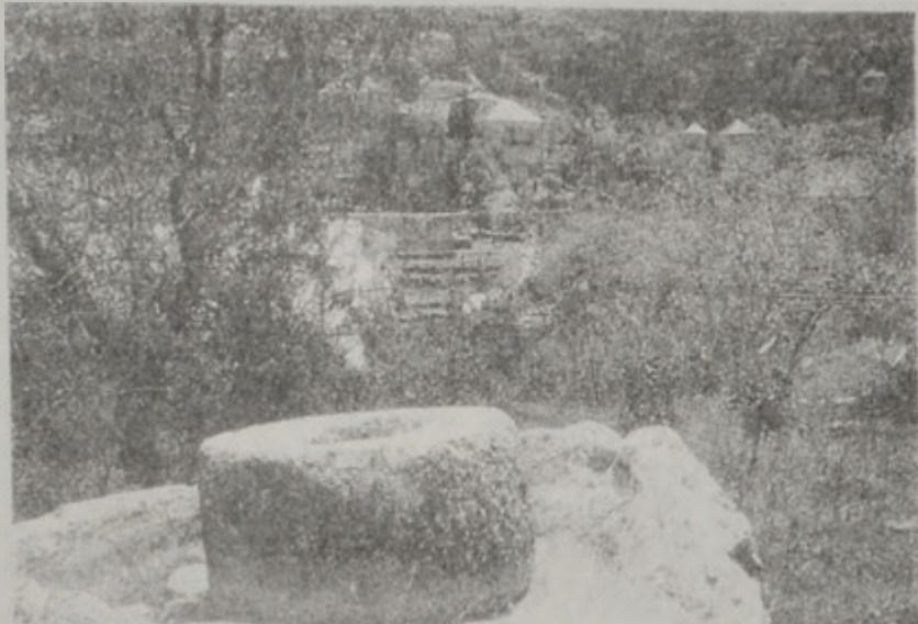
Զիրաիւղի պատրաստութեան օգտագործուող հսկայ քար: