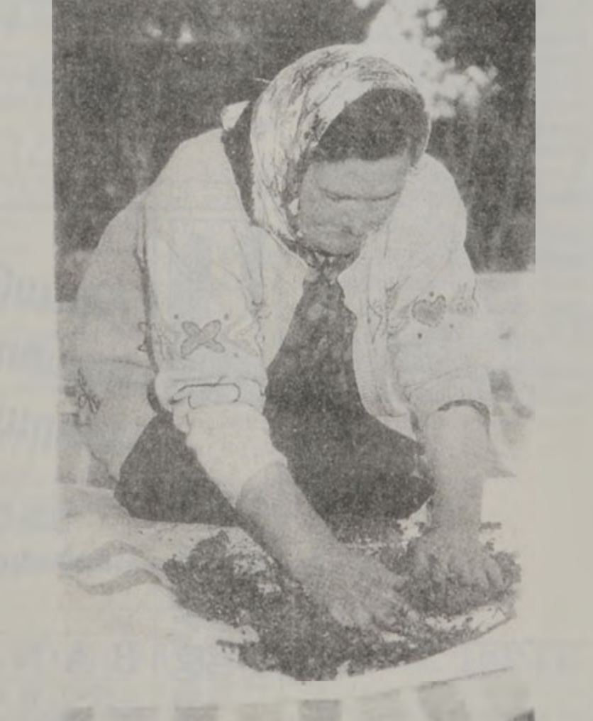
Լիբանանցի գիւղացին մուճԵՆի պատրաստութեան պահուն:

թացքին: Մնացեալ միտերը կը բաժնէին ոսկորէն. կը համեմէին եւ երկար ժամեր կ'ետացնէին: