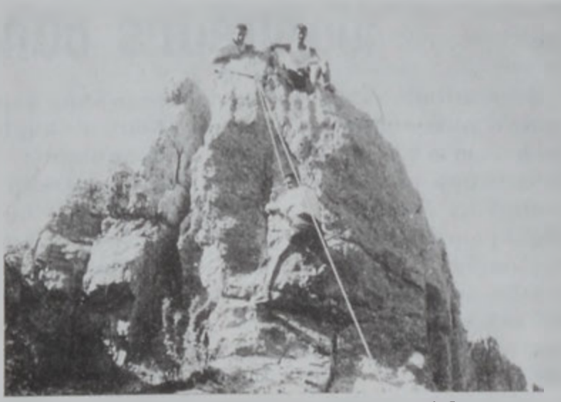
Լեռ բարձրանալու ընթացքին:

Հ.Մ.Ձ.Մ. Պուրճ Համուտի Սկաուտական խորհուրդը ծրագրած է սկաուտական տարբեր աշխատանքներ եւ ձեռնարկներ, որոնց մասին ծանօթացումի տեղեկագրութիւն պիտի կատարուի այս սինակով: