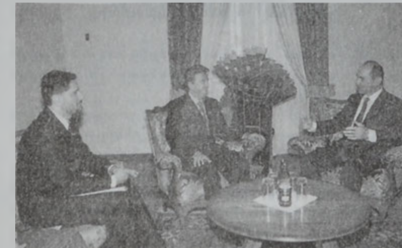
Նախագահ Զոհարեան (աջից) կը ընդունի Սալամէն (կեդրոնը) եւ Սարգսեանը:

ԵՐԵՒԱՆ, 31 (ԱՐՄԷՆՓՐԷՍ)։ Հայաստանի նախագահ Ռաֆիկ Զոհարեան Երեւանի մէջ ընդունեց Լիբանանի Կեդրոնական Կոմիտէի նախագահ Սալամէն և փոխ կառավարիչ Յարութիւն Մամունջեանը: