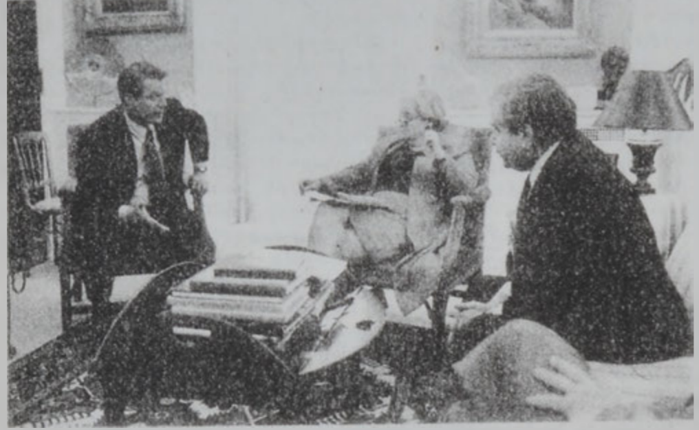
Կոր մախարար Օլարայթի հետ:

Շուրջ մէկ տասնամեակ աշխուժ գործակցութեան հարց, Միացեալ Նահանգներ կրնան արժատական փոփոխութեան ենթարկել Ռուսիոյ նկատմամբ իրենց մօտեցումները, եթէ հանրապետական ծորը Պուշին յաջողի Մ. Նահանգներու նախագահական ընտրութիւններուն: