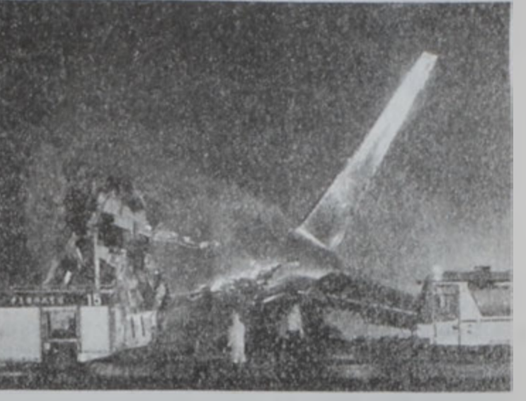
Արկածահար օդանաւից պոչը:

Անունակ 48 հոգի գոհ կ'ընայ օդանաւային արկածի մը, որ երէկ պատահեցաւ Թայլանտի մայրաքաղաք Թայփիէ օդակայանին մէջ: «Ալեկսանդր Էրիկով» պատկանող «Պոլսիկ 747-400» ճամբորդատար օդանաւ մը, որ 179 հոգի կը փոխադրէր, թռիչք առնելէն քանի մը երկվայրկեան ետք կրակ առաւ եւ պայթեցաւ: Արկածին պատճառը փոխութիւն էր: Օդանաւը կ'ուղղուէր Հոս Աննելըս: Պայթիւնը առջ արկածահար օդանաւը լախեցաւ երկու օդանաւերու, որոնք կանգնած էին էջուղին վրայ: Անոնք պարապ էին: