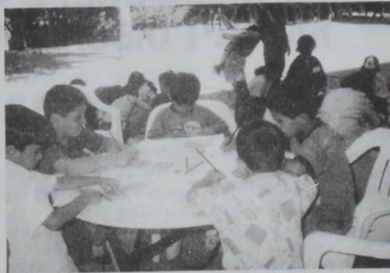
Կազգորման կայանի մանուկները՝ աշխատանքի պահուց:

Տարիներ շարունակ ԼՕՒՍԻ Շրջանային վարչութեան տարեկան գործունէութեան անրժամանակ է կազգորման կայանը: