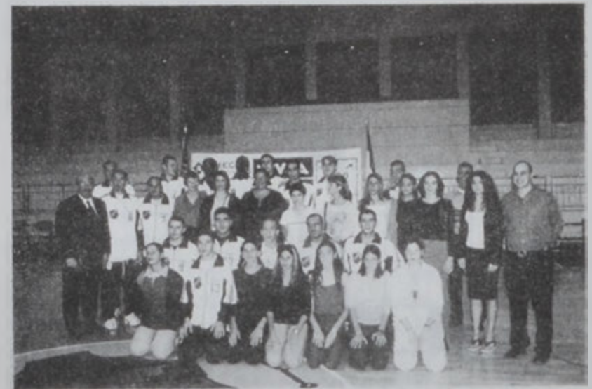
Հ.Մ.Ը.Մ.ի տղոց և աղջկանց կազմերը:

Մրցումը անցավ հարուստ և հաջողակ: Մեր թիմը հաղթեց 78:63 հաշվով: Մրցումը անցավ հարուստ և հաջողակ: Մեր թիմը հաղթեց 78:63 հաշվով: