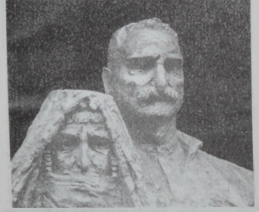
Երկրիմանկար «Ղարաբաղցիներ», գործ՝ Սարգիս Բաղդասարեանի:

ներուն արուեստագէտի կեանքի հնցին մէջ պիտի թրծուին, զարգանան ու կատարելագործուին: