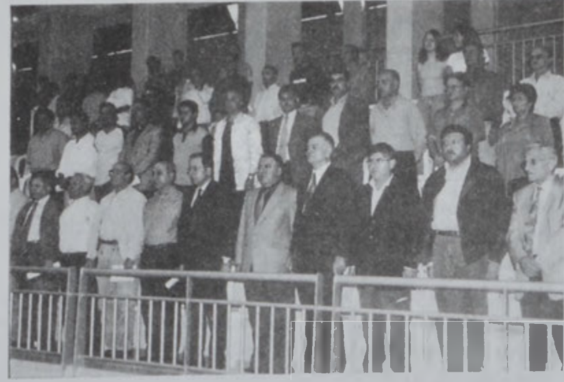
Պատուոյ թրիպիւնը և տեսարան մը:

Մրցումը անցավ հարուստ և հաջողակ: Մեր թիմը հաղթեց 78:63 հաշվով: Մրցումը անցավ հարուստ և հաջողակ: Մեր թիմը հաղթեց 78:63 հաշվով: