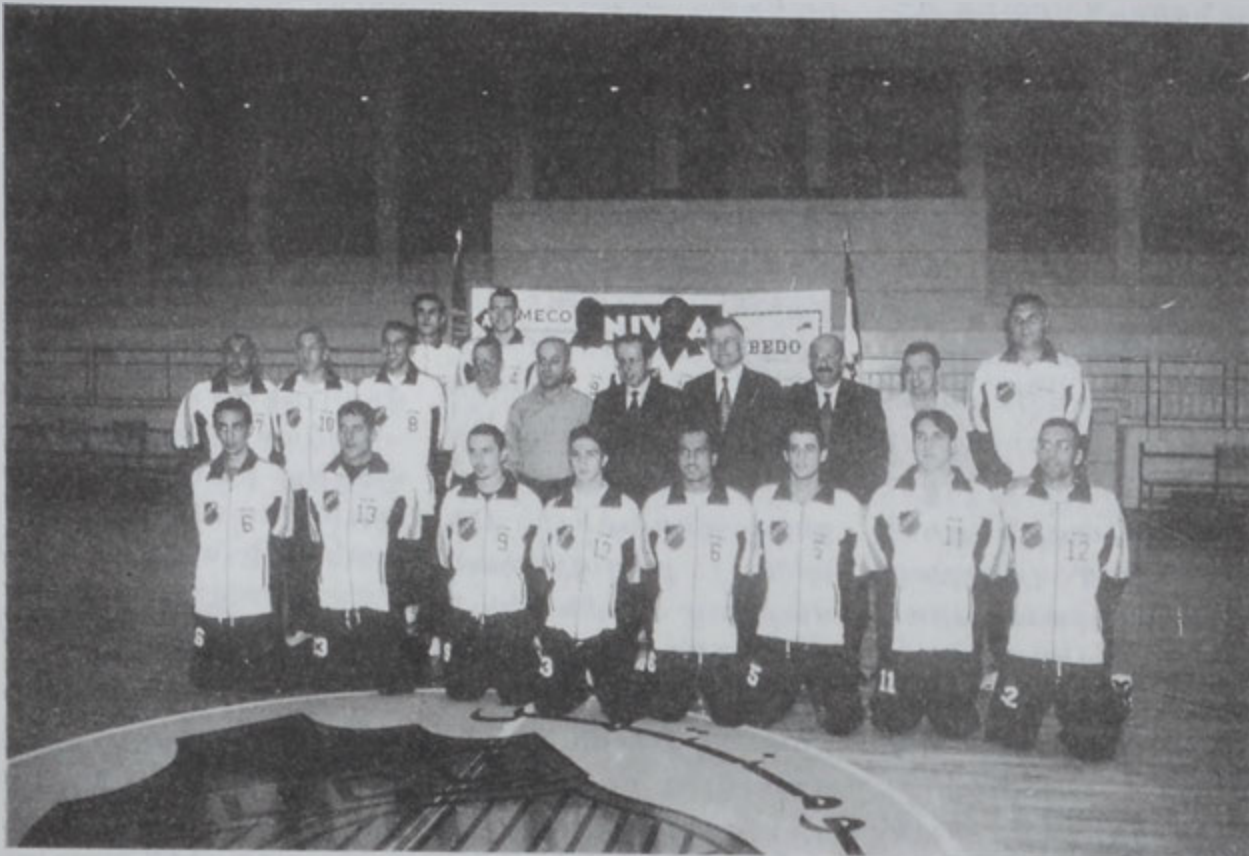
Հ.Մ.Ը.Մ.ի պասքեթպոլի տղոց կազմը, ֆետերասիոնի անդամները և ակումբի անդամները:

Պասքեթպոլի բարեկամական մրցումի մրցումը քաղաքում, երեկ, Հ.Մ.Ը.Մ.ի տղոց կազմը Անթիլիասի «Ատոմ ԵՍՍԵՆ» թմի հետ մրցում էր: Մրցումը անցավ հարուստ և հաջողակ: Մեր թիմը հաղթեց 78:63 հաշվով: Մրցումը անցավ հարուստ և հաջողակ: Մեր թիմը հաղթեց 78:63 հաշվով: Մրցումը անցավ հարուստ և հաջողակ: Մեր թիմը հաղթեց 78:63 հաշվով: