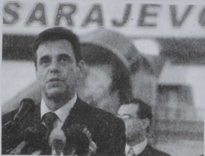
Քոշթունիցա Սարաեւոյի մէջ, աստիճախ պահուց:

Պոսնիոյ սերպ դեկավարները Եուկոսլաւիոյ նոր նախագահ Վոյսլաւ Բոշթունիցայի նախագահական ընդունելութիւն մը վերապահած էին երէկ՝ անոր նախկին եուկոսլաւ հանրապետութեան սերպական բաժինը վիճելի այցելութեան մը առիթով: