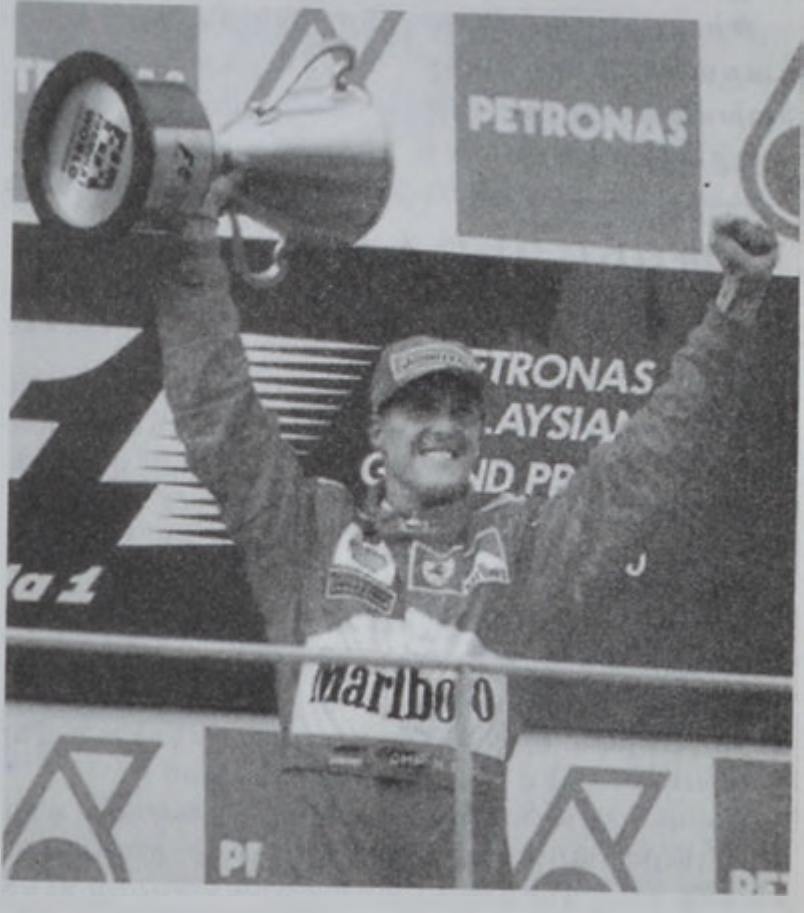
Ֆորմուլա 1-ի աշխարհի ախոյեան Միքայել Շումպերը կը սօցէ իր յաղթանակը:

Ֆորմուլա 1-ի 2000 թվականի աշխարհի ախոյեանությունը 17րդ և վերջին հանգրուանին, գերմանացի Միքայել Շումպերը, որ նախաձեռնեց հանգրուանին (Մուլուրա, Ճափոն) արդեն տիրացած էր ախոյեանի տիտղոսին, երեկ շահեցավ այս մրցումին տիտղոսը եւս եւ իր «խուրճի»՝ Ֆեռարիի շնորհից նաև խմբային տիտղոսը, յաջորդաբար երկրորդ տարին ըլլալով: Երեկ երկրորդ հանդիսացավ բրիտանացի Տեյվիտ Քուլթարտ (Մաքլարըն), իսկ երրորդը՝ պրաչիցի Ռուպենու Պարիքելլո (Ֆեռարի): Այսպիսով, 21 տարուան մէջ առաջին անգամ ըլլալով Ֆեռարի կ'իրագործէ տուրյէ մը, այսինքն կր խլէ թէ՛ միայն ախոյեանի տիտղոսը, այլ նաև խմբային տիտղոսը: