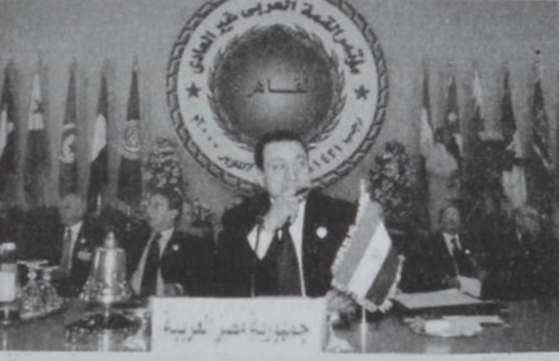
Եգիպտոսի Գահիրէի Հիւսիս Մուսարաբ կը կատարէ վեհաժողովին բացումը:

Երկօրեայ վեհաժողովին աւարտին հրապարակուած հաղորդագրութիւնը կը պահանջէ, որ ՄԱԿ պատերազմի ռճիրները