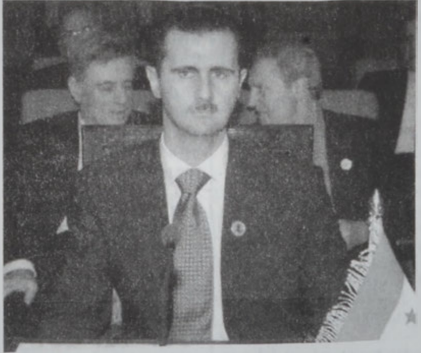
Սուրիոյ Գահիրէի Պաշտար Ասատ Խօսքի պահուն:

թիւնը կ'աւելցնէ, որ խաղաղութիւնը պիտի չիրականանայ մինչեւ որ Իսրայէլ արաբներուն վերադարձնէ 1967ին գրաւած բոլոր հողերը, որոնց կարգին է Արեւելեան Երուսաղէմը, որ պաղեստինեան պետութեան մը մայրաքաղաքը կը նկատուի: