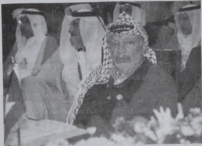
Եսաեր Արաֆաթ՝ ժողովի ընթացքին:

Վեհաժողովին արտասանած իր խօսքին մէջ, պաղեստինեան իշխանութեան նախագահ Եսաեր Արաֆաթ ըսաւ, որ իր ժողովուրդը պիտի շարունակէ Իսրայելի դէմ պայքարը մինչեւ յաղթանակ: Արաֆաթ սակայն աւելցուց, որ պաղեստինցիները տակաւին կառչած են խաղաղութան, հակառակ անոր որ Իսրայել «հաւաքական շարժեր եւ բարբարոս ոմբակոծումներ» կը կատարէ: Ան վերստին շեշտեց, որ պաղեստինցիները պիտի ունենան անկախ պետութիւն մը, որուն մայրաքաղաքը Արեւելեան Երուսաղէմն է: