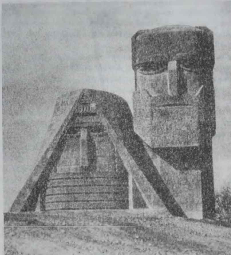
«Մենք ենք, մեր սարերը», գործ՝ Սարգիս Բաղդասարեանի:

Բախտի ճամբէքը տարբեր են լինում, Բախտն ամէն մէկին սիրում է տարբեր: Նրանք ծնունդ են, որ ապրեն հարբած, Իսկ դու՝ որ քեզնով երբեւէ հարբեն: Պ. ՍԵՒԱԿ