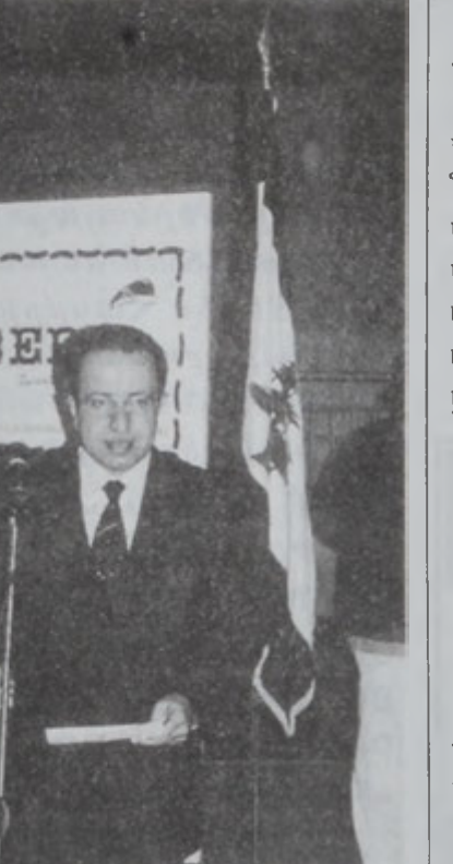
Լիբանանի պասքեթպոլի ֆետերասիոնի նախագահ Ժան Լամամ կ'արտասանէ իր խօսքը:

Մրցումը անցավ հարուստ և հաջողակ: Մեր թիմը հաղթեց 78:63 հաշվով: Մրցումը անցավ հարուստ և հաջողակ: Մեր թիմը հաղթեց 78:63 հաշվով: