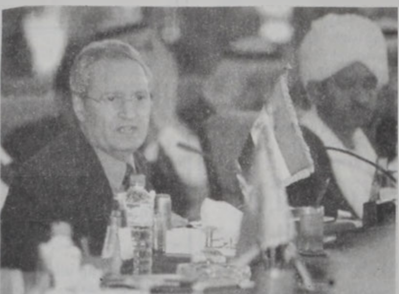
Սուրիոյ արտաքին գործոց նախարար Ֆարուք Շարէհ իր խօսքի պահուն:

ԳԱՀԻՐԷ, 19 (ՌՈՅԹԸՐԶ).- Արաբական երկիրներու արտաքին գործոց նախարարները Հինգշաբթի օր ժողով մը գումարեցին Գահիրէի մէջ, պատրաստելու համար շարաթաւերէին կայանալիք արաբական վեհաժողովը, որմէ կ'ակնկալուի դատապարտել Իսրայէլը եւ վայն վաերացնել, որ խաղաղութեան գործընթացին յառաջխաղացքը կախեալ է իրմէ: