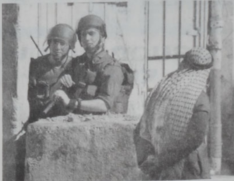
Պաղեստինցի մը հետիոտն կ'անցնի իսրայէլացիներուն կողմէ վերաբացուած անցքէ մը շտապարան մէջ:

մի պահով լուրջան կեդրոնատեղին: Աւելի ուշ յստակացաւ, որ կապի շիշեր է որ պայթած են կեդրոնատեղիին մէջ: