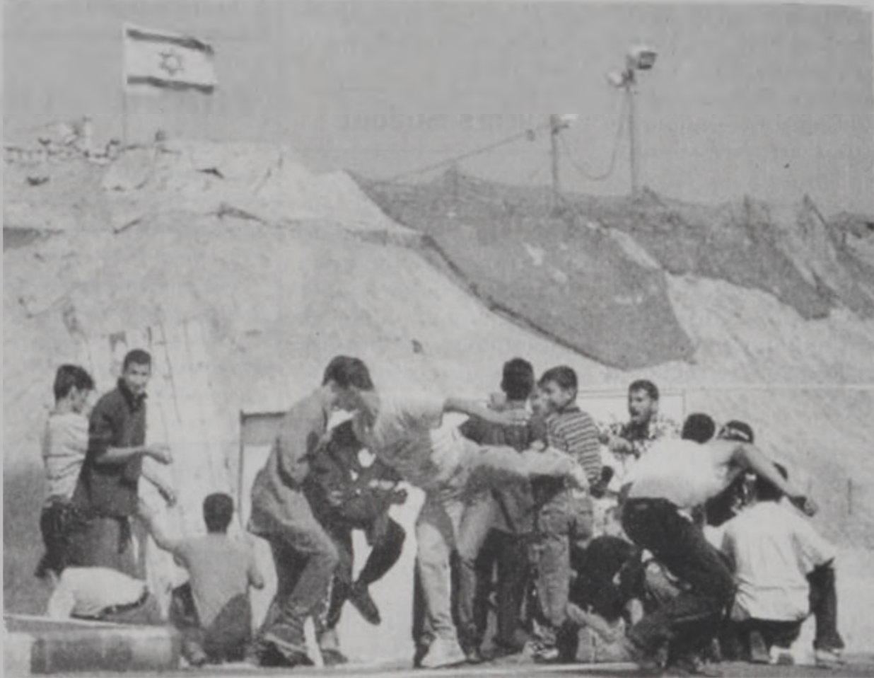
Պաղեստինցի պատանիներ եւ երիտասարդներ կը փորձեն պաշտպանուիլ իսրայէլացի զինուորներուն փամփուշտներէն:

Իսրայէլ լրացաւ կազայի անցքը՝ արտօնելով առեւտուրը եւ բնակարար ինքնաշարժներու անցքը միայն: Իսրայէլի ղնելը փակ մնացին պաղեստինցի գործաւորներուն ղիմաց, որոնք հրէական պետութեան սահմաններէն ներս կ'աշխատին: Մօտաւորագէտ երկու շարաթ առաջ, Իսրայէլ փակած էր պաղեստինեան շրջանները՝ արգիլելով պաղեստինցիներուն մուտքն ու ելքը: Իս-