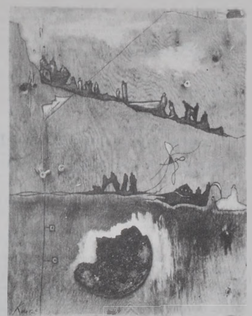
«Տեսիլքներ» շարքէն NO 6, գործ՝ Գօգօ Սագայի

Ան ցարդ արժանացած է Վենետիկի «Ռենաիստ Երկր» արժանացման: