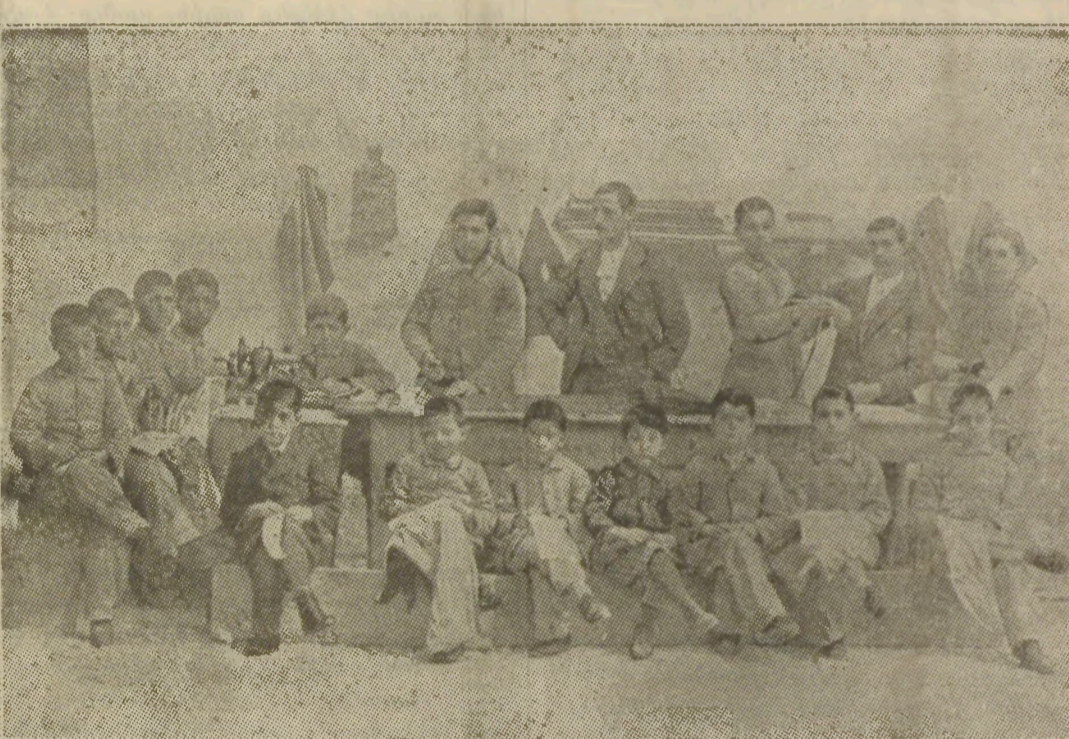
ԴԵՐՁԱԿ ՀԱՅ ՈՐԲԵՐԸ ԿԻՊՐՈՍԻ ՈՐԲԱՆՈՑԻՆ ՄԷՋ

ազգաները շահագործել և: Մենք քրիստոնեայ ենք արգէն: Հայութիւնը իր դարաւոր մարտիրոսութեամբ ամբողջ քրիստոնեայ աշխարհին հետ կարող է մրցիլ, ան մեր միակ պարծանքն է արգէն: Բազմաշարժար, նահ սակ, մարտիրոս և այլ ամակոնքի, որոնք աւետարանի հետևողներուն կը արուէին քրիստոնէութեան նախնական դարերուն մէջ, հազար հինգ հարիւր տարիէ ի վեր Հայ ազգը այդ ստորագիւղները իրեն սեփականացուցած է գրեթէ: Ու եթէ Հանդերձ անհալին մէջ փրկութեան առաջին մրցանակին արժանի մէկը կայ, ան ապահովաբար Հայ ազգն է, որովհետեւ ոչ մէկ ազգ կրնայ այնքան ազնուալի տարեգրութիւն մը ունենալ կենաց գրքին մէջ, ի՛նչ որ մենք ունինք: